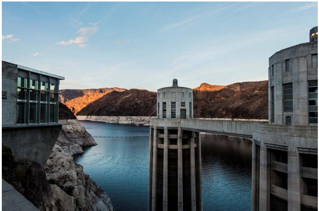
Fig. 6. View from upper part of Hoover Dam.

Ryc. 5. Granica stanów: Nevada i Arizona na Zaporze Hoovera.