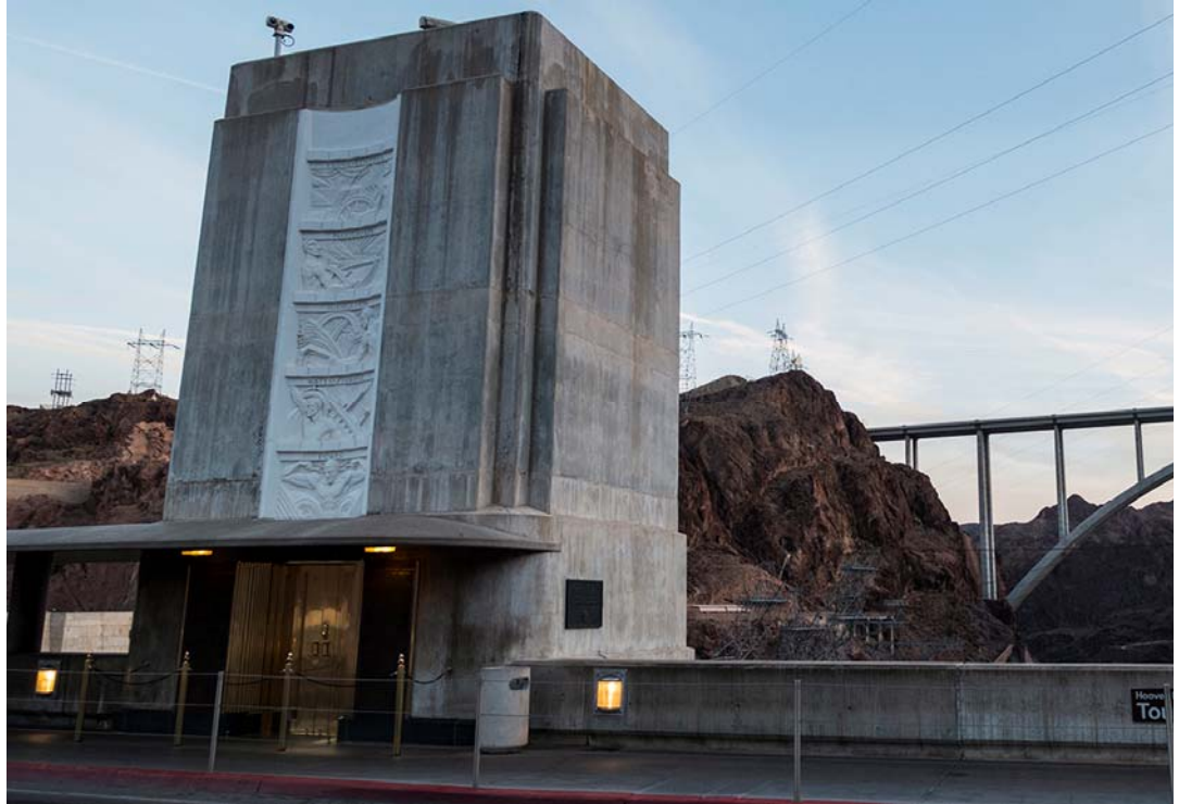
Fig. 3. Nevada elevator with Hansen's bas-relief.

Ryc. 3. Winda po stronie Nevady z płaskorzeźbą autorstwa Hansena.