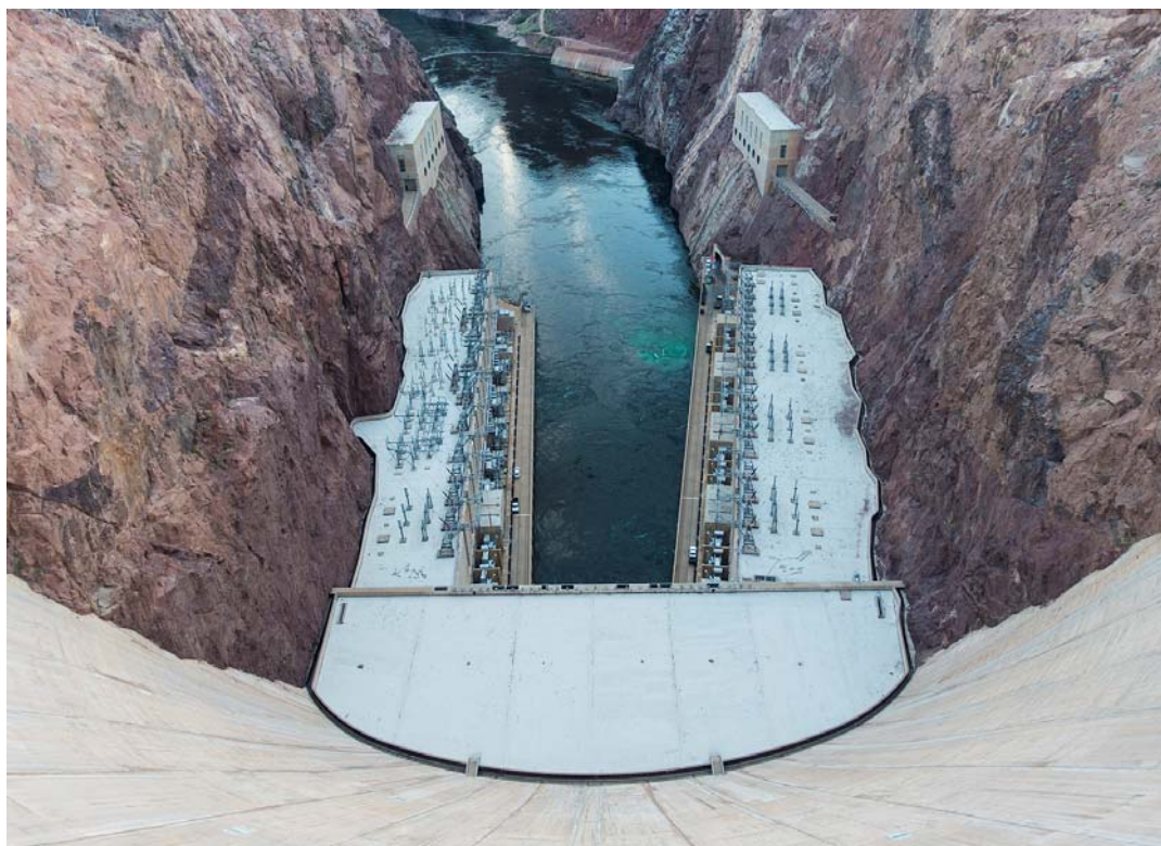
Fig. 2. View from Hoover Dam to the part of it.

In the Fall-Davis report, the proposed location was Boulder Canyon or its surroundings, but turned out to be inadequate. Only Black Canyon was fit for such a venture. Despite the change of place, the name of the investment was Boulder Canyon Project.