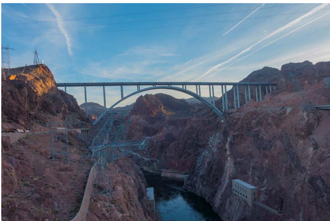
Fig. 7. View to the Mike O'Callaghan – Pat Tillman Memorial Bridge.

In 2010 was opened (fig. 7) Mike O'Callaghan - Pat Tillman Memorial Bridge, which took over the road traffic of the dam.