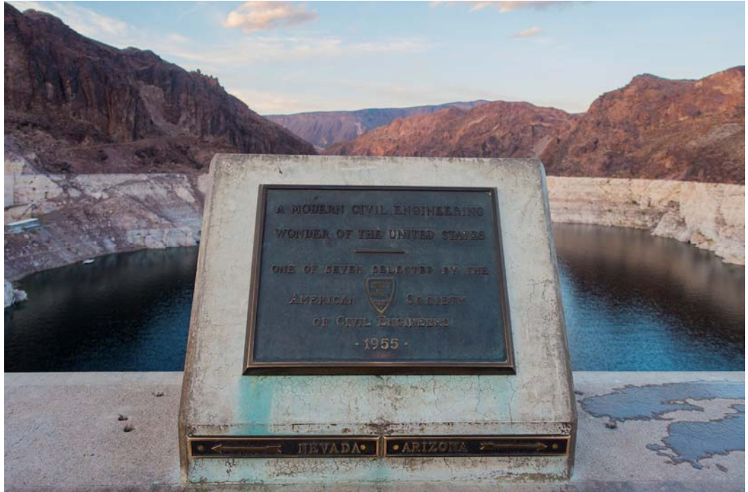
Fig. 5. The border of Nevada and Arizona States on Hoover Dam.

Ryc. 5. Granica stanów: Nevada i Arizona na Zaporze Hoovera.