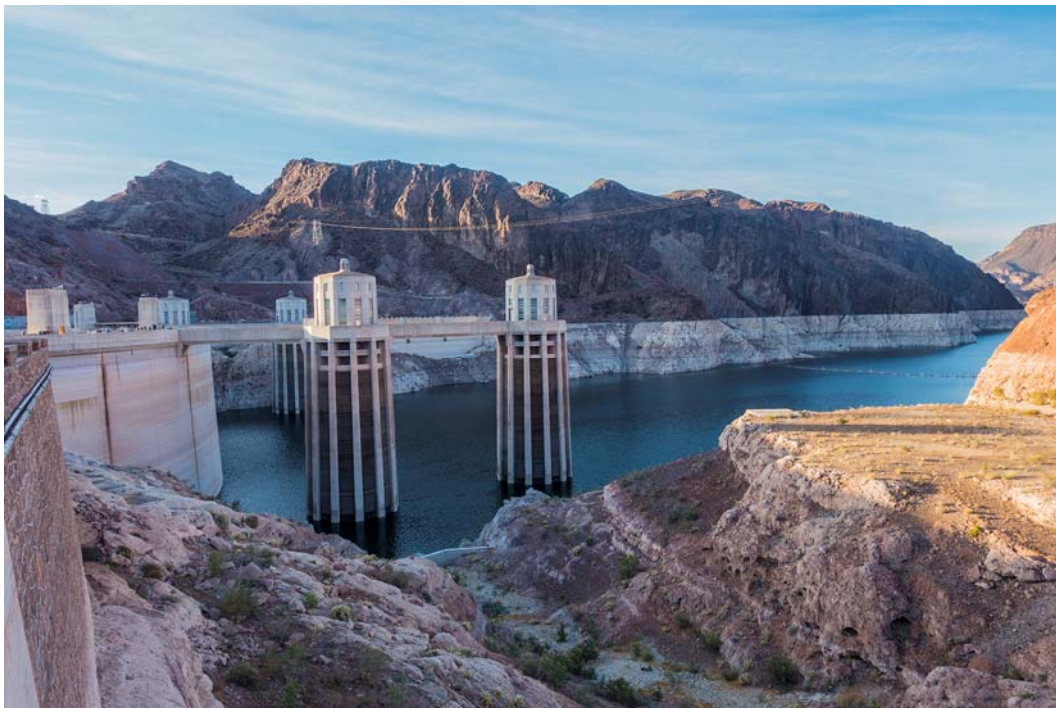
Fig. 4. View to the part Hoover Dam and Colorado River.

Ryc. 4. Widok na część Zapory Hoovera i rzekę Kolorado.