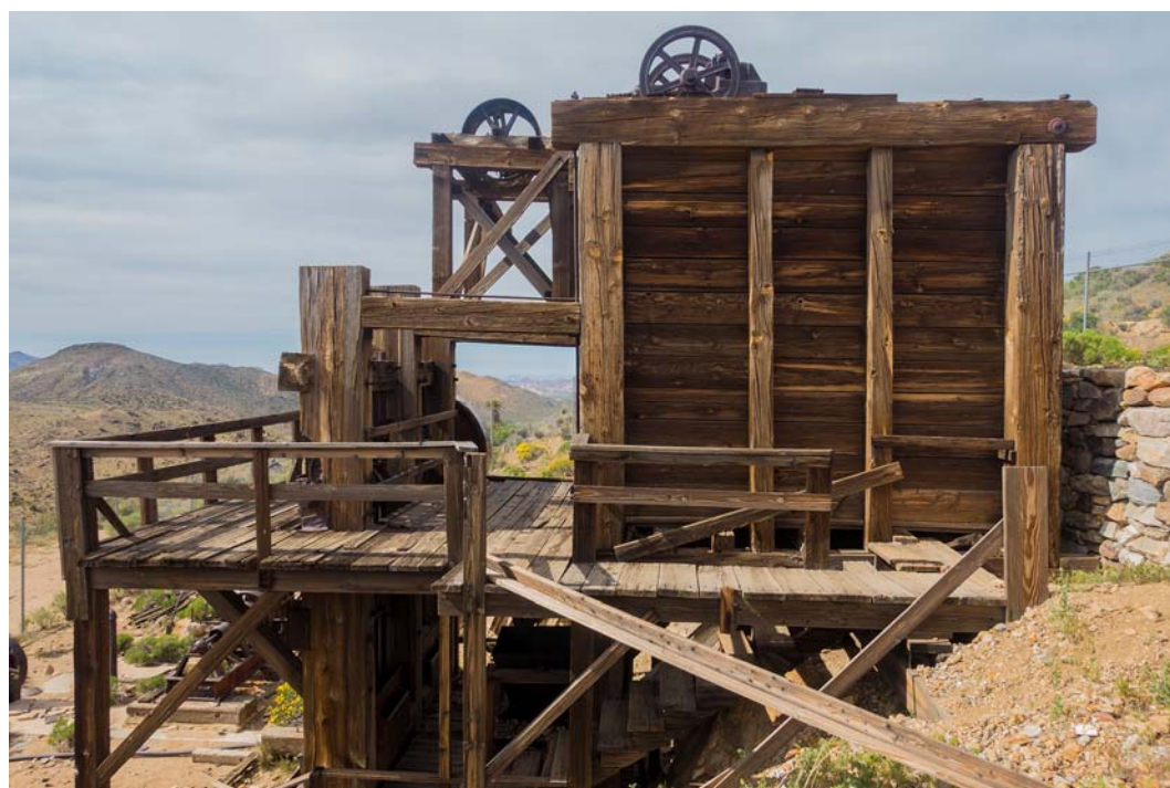
Fig. 5. Lost Horse Mine.

By road, in most cases, it's permitted to stop in lay-bys, where viewpoints are designated. Many times this point has an information board that informs the public what is in a given location and describes its history.