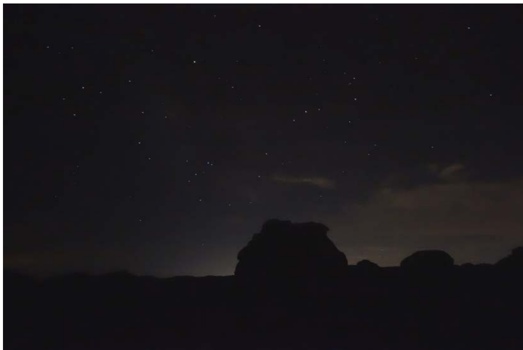
Fig. 11. Night view from Hidden Valley Campground.

Ryc. 11. Nocny widok z campingu Hidden Valley.