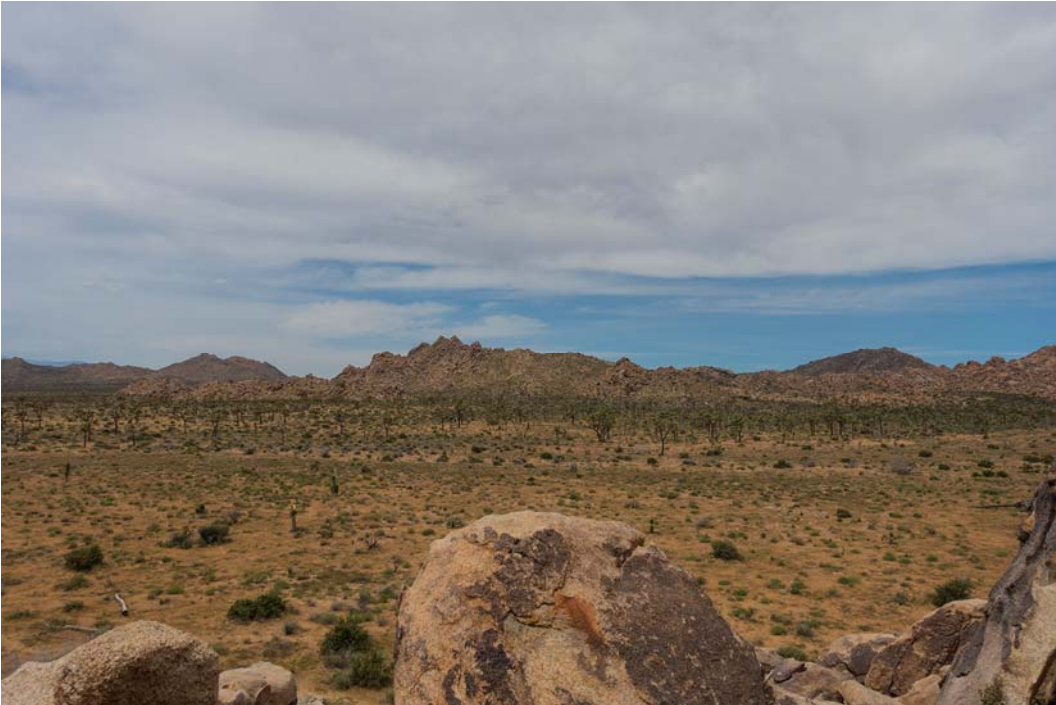
Fig. 8. View of Joshua Tree National Park.

Ryc. 8. Widok w Parku Narodowym Drzewo Jozuego.