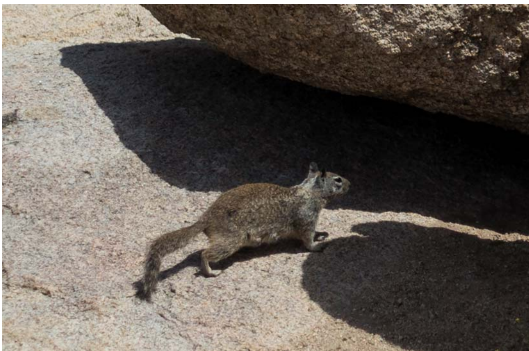
Fig. 4. Fauna in Joshua Tree National Park.

The boundary of the Joshua Tree National Park is not clearly defined. Desert areas extend beyond its borders. Also medium greenery, like the Joshua tree is outside the park area. By moving along the road towards the park, there can be seen vast transitive areas, the desert with park-like elements of greenery, but less dense than the park.