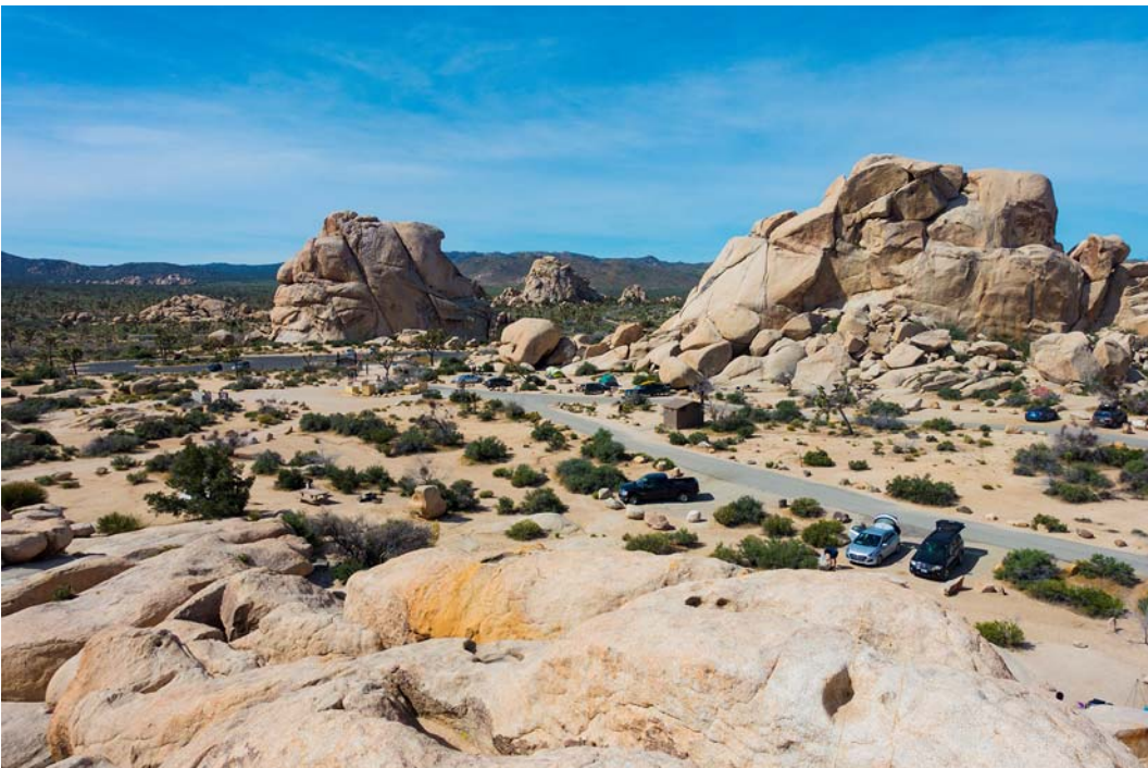
Fig. 9. View of Hidden Valley Campground.

Camping Hidden Valley (fig. 9) harmonize well the nearby landscape. It is surrounded by huge boulders and Joshua trees. In the middle of the campground there are viewpoints - rocks from which the countryside can be admired.