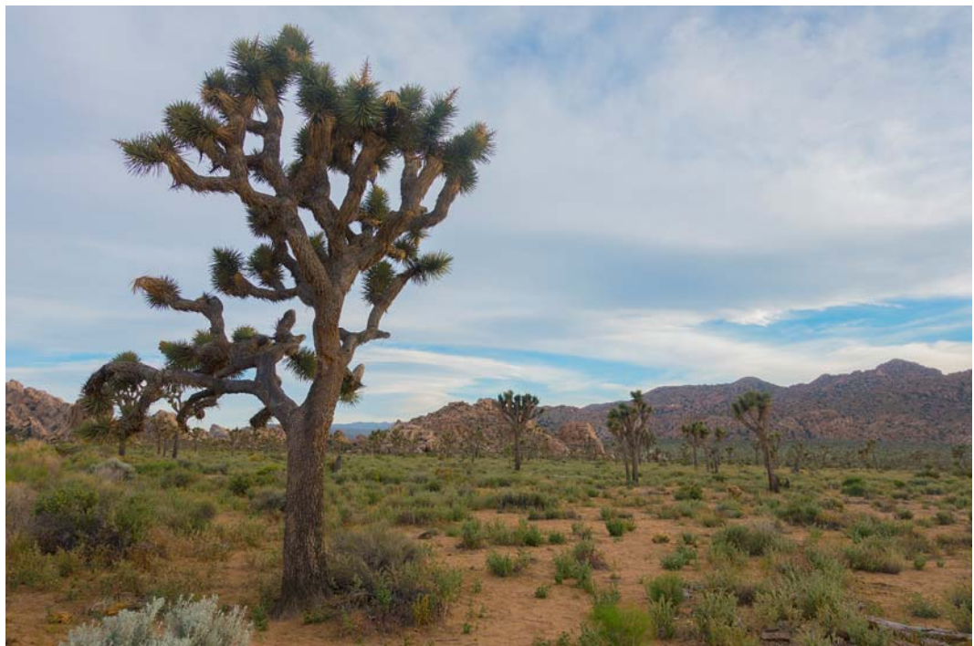
Fig. 10. View of Joshua Tree National Park.

Most of the places from which the magnificent sceneries spread are view points and view planes. Below, there is an observation foreground usually ended by a mountain range and the eternally blue sky. Sometimes, it is possible to see different views from the same view point, turning eyes to the other side. Doubtless, this difference is influenced by the position of the Sun. It has a huge impact on the reception of a space. The same places, visited at different times of a day give visitors a completely different aesthetic feeling.