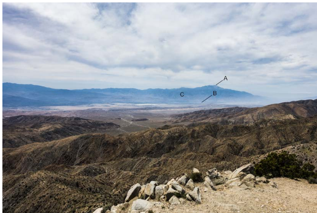
Fig. 7. View from Keys View.

The view extends to the Coachella Valley. In photo number 7, with the letter A, is marked the top of San Jacinto (3304 m). In front of it, with letter B is marked Palm Springs. Letter C indicates the Santa Rosa mountains. The picture number 4 shows that the viewpoint is located in the way that it is possible to see a varied landscape from it. The first what can be seen are the mountains, behind them is the foreground, then the wonderful mountain range of San Jacinto.