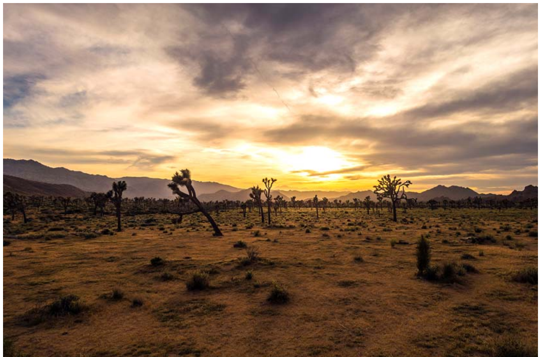
Fig. 3. View of Joshua Tree National Park. Source: the author.

Ryc. 2. Plan Parku Narodowego Drzewo Jozuego. Źródło: na podstawie [10].