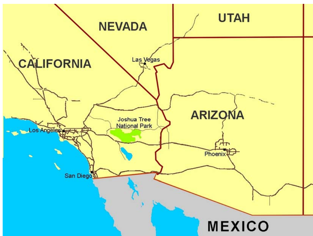
Fig. 1. Location of Joshua Tree National Park.

The Joshua Tree National Park is located in the southeastern part of California, United States (fig. 1, 2). It covers an area of 3207 km 2 . It is located in the Mojave Desert and Colorado Desert. It became a national park in 1994. Previously, since 1936, it was a national monument.