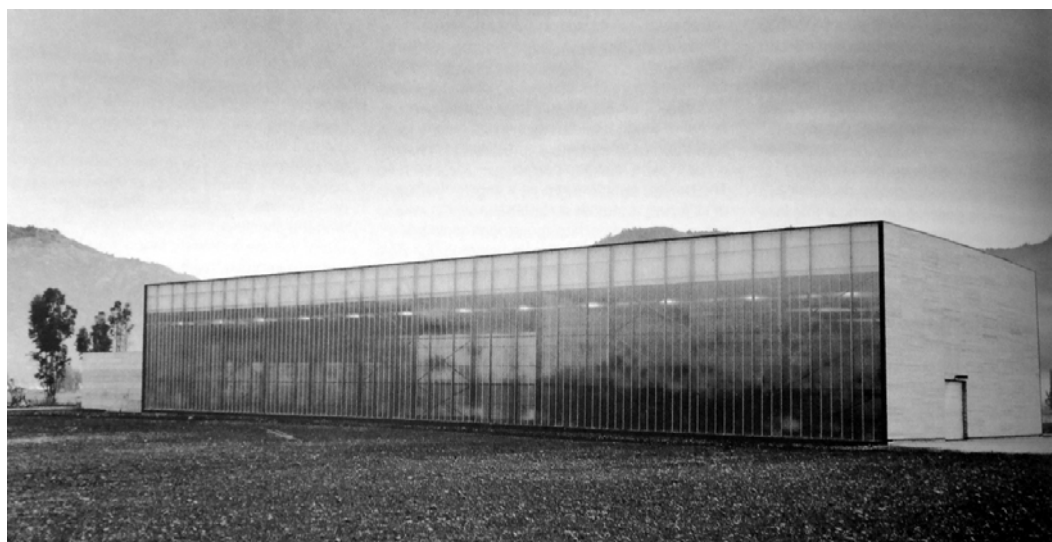
Ryc. 6. Winiarnia Las Niñas, Santa Cruz, Chile.

Las Niñas to wykonany przez M. Klotza i zrealizowany projekt zespołu industrialnego, na zlecenie francuskiego producenta win. W tym wypadku są to wina chilijskie o renomowanej jakości i tradycyjnej nazwie, właśnie Las Niñas. Zapotrzebowanie objęło stację produkcyjną w Chile, by stamtąd eksportować wino głównie na rynki Stanów Zjednoczonych. Obiekt poza kameralnymi w skali pomieszczeniami takimi jak biura, laboratoria i sanitariaty – posiada fundamentalne trzy sektory. Pierwszy jest przystosowany do umieszczania w nim kadzi produkcyjnych; drugi służy do składowania beczulek, a trzeci – do leżakowania butelek. Każda część winiarni to osobna bryła, „pudełko”. Każde wykonane jest z tych samych dwóch, ale radykalnie innych materiałów, do czego powodem i pretekstem stały się różne funkcje w odpowiednich fragmentach tych budynków 19 .