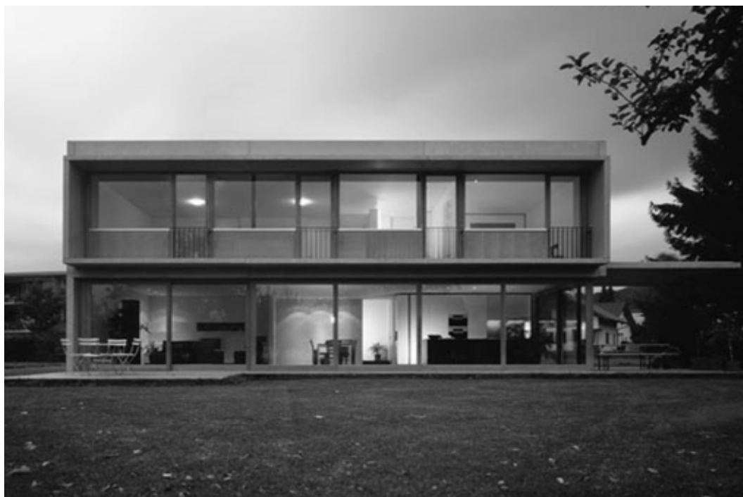
Ryc. 10. Dom Böhler–Tembl, Wolfurt, Austria. Fig. 10. Böhler–Tembl House, Wolfurt, Austria.

CHRISTIAN LENZ. Ten uznany współczesny architekt austriacki średniego pokolenia zaśląnął przede wszystkim fascynującym, ponad 100-metrowej długości jednopiętrowym budynkiem biurowo – mieszkalnym w Schwarzbach, oraz budynkiem hotelowym przy porcie lotniczym w Budapeszcie. Obydwa cechują się ascetycznymi prostymi jak liniał fasadami ze szkła, drewna i żółtego piaskowca 32 . Istotny dla niniejszych rozważań projekt tego architekta to – położony na szczycie góry dom „zawinięty” w beton, podzielony na dwie kondygnacje o całkowicie przeszklonych elewacjach. Z drewnianych tarasów domownicy mogą karmić swe oczy pięknym widokiem, rozciągającym się w kierunku sadu i dalekich gór. Wysunięta poza obręb domu, podparta betonowa wstęga, stworzyła wiatę na samochód, zaś taki sam zabieg z innej strony domu – utworzył zacieniony taras, idealny na jadalnię. Ten pomysł jest główną ideą tej realizacji, świetnym rozgrywaniem symetrią bryłową.