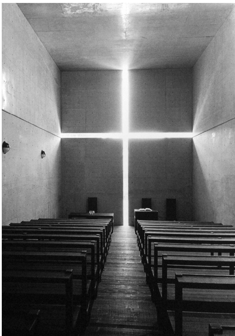
Ryc. 2. Kościół Światła, Ibaraki, Prefektura Osaka, Japonia. Źródło/source: Ando T. Fig. 2. The Church of Light, Ibaraki, Osaka Prefecture, Japan.

„Takie czynniki jak światło i wiatr mają tylko wówczas znaczenie, gdy wpuszcza się je do wnętrza domu – tak, że tam są izolowane od świata zewnętrznego. Takie izolowane fragmenty światła i powietrza, symbolizują cały świat przyrody. Formy, które stworzyłem, zmieniają się i zyskują na znaczeniu przez elementy te przyrody, którymi są właśnie światło i powietrze – które zaznaczają bieg czasu oraz przemiany pór roku.” 8