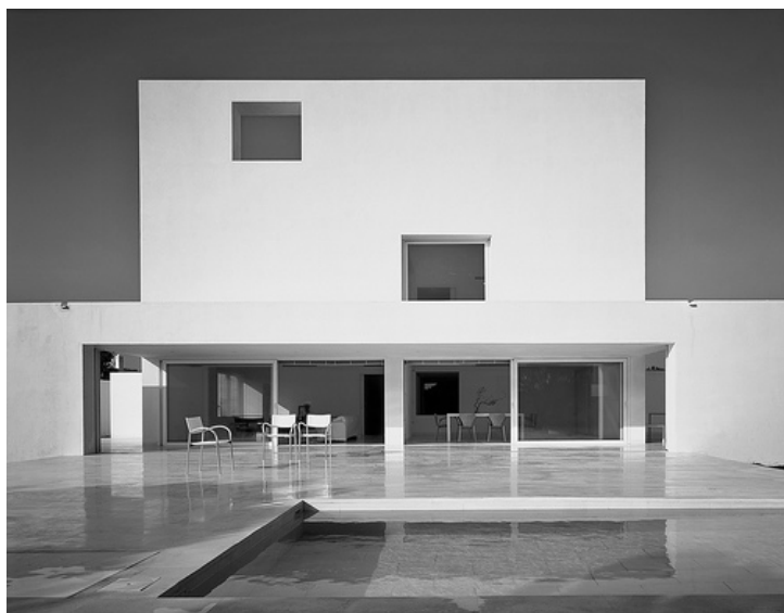
Ryc. 13. Asencio, Kadyks, Hiszpania, Źródło/source: Campo Baeza 2 .

Umieszczony w strategicznym miejscu świetlik, pokazuje – jak zręcznie i artystycznie manipulując światłem, tworzyć można smugi, oświetlające różne strefy domu – z tylko i wyłącznie jednego źródła. Kwadratowy rozkład domu został podzielony niejako w klasyczny sposób. Wydzielona została przestrzeń gościnna – w przedniej części domu, a część prywatną ulokowano z tyłu. Przednia część zawiera salon, jadalnię i bibliotekę, natomiast tylna sypialnię i łazienki. Jednak wspomniane czynniki ideowe związane ze światłem, pomimo podręcznikowego wręcz układu funkcjonalnego - czynią ten budynek małym zindywidualizowanym arcydziełem sztuki. 38 Jest to sztuka powiązana w niezwykle sposób z naturą. Sensu stricto : w tym wypadku – z wodą, a przede wszystkim ze słońcem, zaś sensu largo – z iberyjskim pejzażem zielonych i wypalonych słońcem wzgórz, poza białym murem rezydencji.