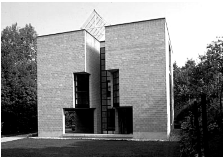
Ryc.9. Casa Pregassona, Ticino, Szwajcaria.

„Na początku dwudziestego wieku trudnym do pojęcia było zrozumienie, że architektura może obyć się bez ornamentu. Należało również zrozumieć, że manifestacje Alfreda Loosa 'ornament to zbrodnia', nie była jedynie odrzuceniem zdobnictwa, ale kryła w sobie pewien (nowy) sposób rozumienia przestrzeni architektonicznej.” 30