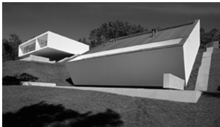
Ryc. 12. Dwa Domy. Sante De Lima, Portugalia, Źródło/source: Souto de Moura E.

Te dwa domy 36 , jakby „zakopane” w krajobraz, formują dynamiczną kompozycję geometrycznych linii i łamanych powierzchni, które nadają im niezwykle nowoczesny charakter. Nie są bowiem w swych łamanych powierzchniach tradycyjnie i sentymentalnie kryształowe, ale wyglądają jak minimalistyczne pudełka, jednak o dziwnie trapezowych lub całkiem nieregularnych czworobocznych ścianach. Dzięki tej nieprostokątności – położone na zboczu wzgórza domy zaprojektowane zostały w taki sposób, by mimo ekspresji nie prostych kątów, pozostać w zgodzie i dialogu ze sobą oraz z otaczającym je środowiskiem. Pochyła struktura „owijająca” wewnętrzną bryłę, odsłania widoki na krajobraz oraz tworzy zacienioną wewnętrzną werandę. Wnętrza doświetlają duże, przeszklone drzwi oraz świetliki.