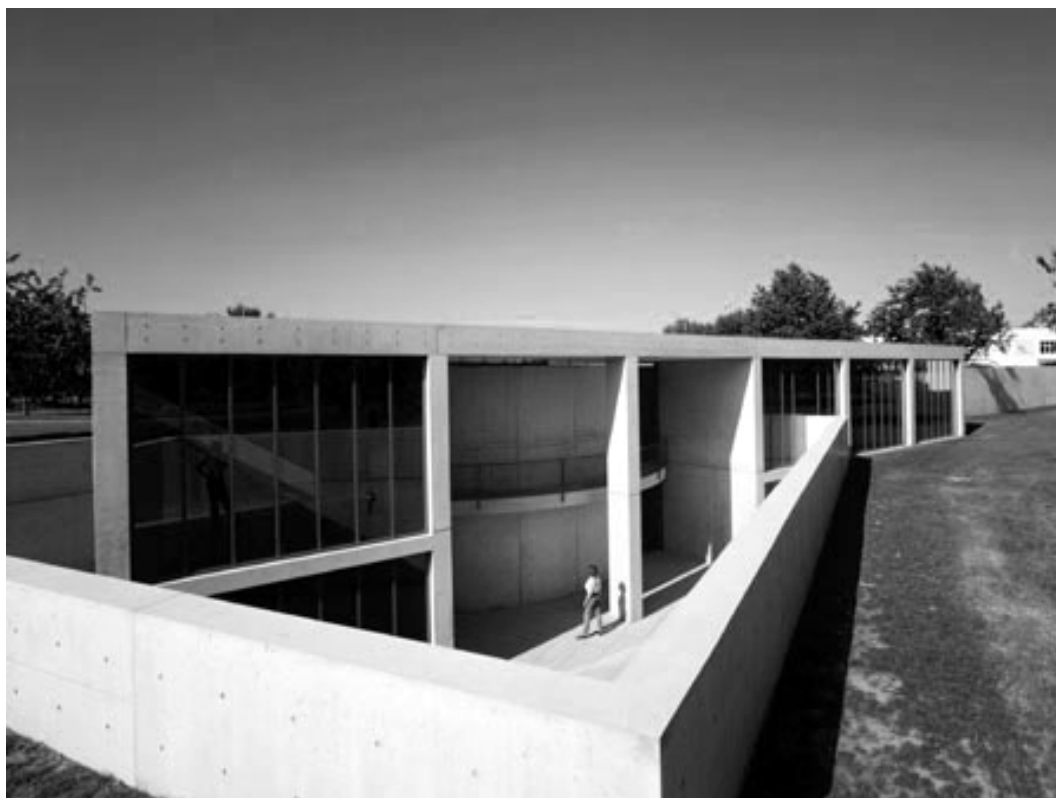
Ryc. 1. Centrum Szkoleniowe „Vitra”, Weil nad Renem, RFN. Fig. 1. The “Vitra” Education Center. Weil am Rhine, BRD.

Jednym z pierwszych budynków T. Ando, powstałych poza granicami jego ojczyzny jest Centrum Szkoleniowe Vitra. Kompozycja brył została wyjątkowo ciekawie zaaranżowana, w sposób nietypowo złożony, jak na obiekt o minimalistycznych założeniach. W centrum rzutu, od razu zauważa się zredukowany walec, do którego dostawione zostały pod różnymi kątami nachylenia dwa prostopadłości. T. Ando powycinał je, układając w ten sposób swego rodzaju architektoniczną „mozaikę”.