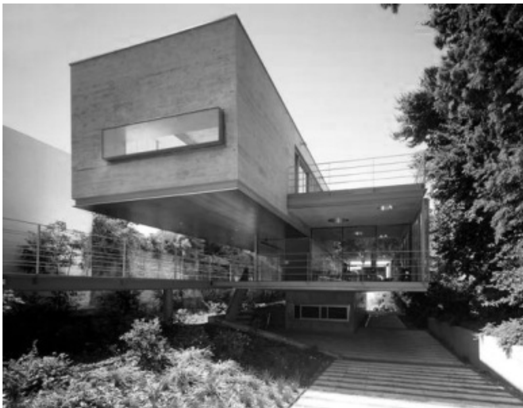
Ryc. 5. Ponce House, Buenos Aires, Argentyna. Fig. 5. The Ponce House, Buenos Aires, Argentina.

Ten chilijski neomodernista – minimalista, pokazuje wnętrzem swoich obiektów fantastyczną przestrzenność okalających je brył elementarnych. Swoiste piękno pustki daje się zauważyć właściwie w każdej realizacji M. Klotza, niezależnie od tego, czy jest to przestrzeń prywatna, czy publiczna. 16