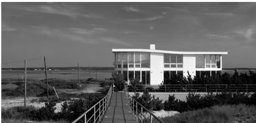
Ryc. 11. Dune House, Long Island, NY, USA