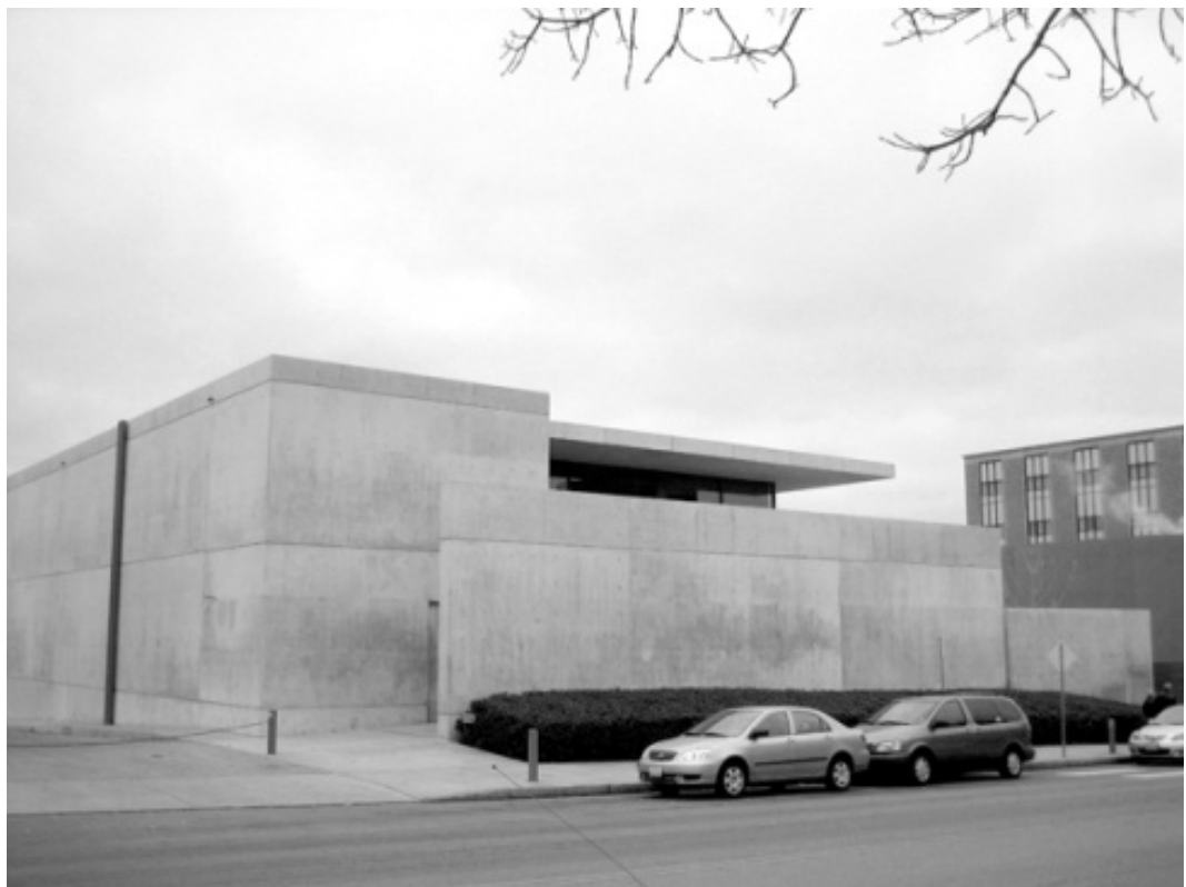
Ryc. 3. Muzeum Pulitzera, St. Louis, Missouri, USA.

„Widzę to, jako wykreowanie przestrzeni, stworzonej, aby inspirować użytkowników, a także, aby rozwinąć swoją własną świadomość projektową. Chcę stworzyć szczególnie stymulujące miejsce, gdzie dzieła sztuki nie będą wystawiane tylko jako okazy, ale przemówią do nas jak żywe.” 10