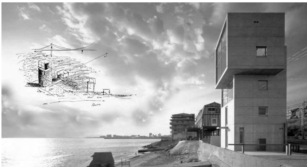
Ryc.7. Dom 4 X 4, Kobe, Japonia.

towej pomiędzy wspomnianymi dwiema wielkimi wyspami, pierwotne znaczenie nazwy wysepki to "droga do prowincji Awa" (Awa-ji).