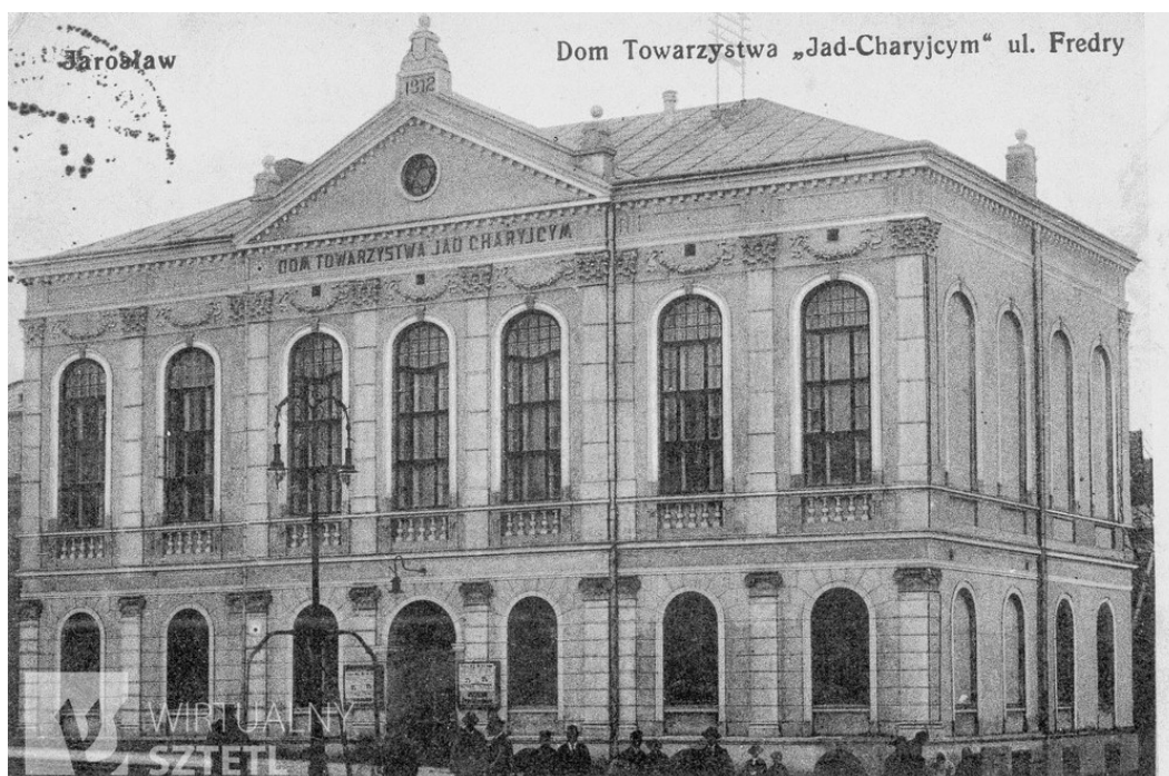
Ryc. 5. Dom Towarzystwa Jad-Charcyjm w okresie międzywojennym – stara pocztówka.

Trzeci obiekt związany z gminą żydowską pełnił funkcje świeckie – był to budynek Towarzystwa Żydowskiego Jad-Charcyjm, które zajmowało się świadczeniem usług w razie choroby członków towarzystwa, śmierci, udzielaniem pożyczek, przyznawaniem zapomóg starcom itp.; ponadto zajmowano się zakupem papierów wartościowych. 5 Powstał on w latach 1907-1912. Piętrowy budynek o prostopadłościennym kształcie uatrakcyjniony został rozrzeźbioną neoklasycystyczną elewacją, przede wszystkim zaś oryginalnymi przeszkleniami w poziomie pierwszego piętra.