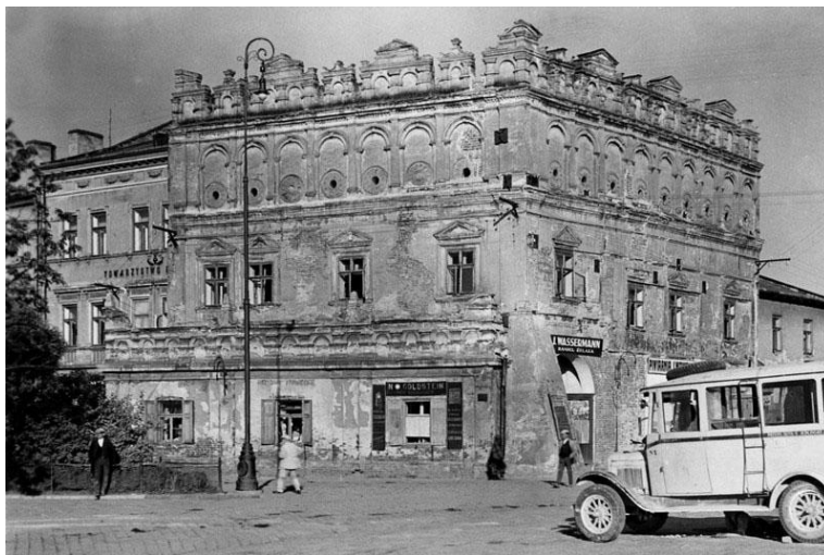
Ryc. 8. "Kamienica Marysienki" w Jarosławiu - przed 1939 r. (stara pocztówka).

Fig. 8. "Kamienica Marysienki" (the Marysienka tenement house) in Jarosław - before 1939.