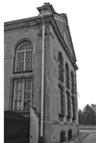
Ryc. 4. Elewacja północna.

Fig. 3. The Little Synagogue – general view.