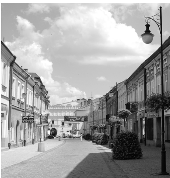
Ryc. 10. Ulica Grodzka w Jarosławiu.

Fig. 9. Street in old Cordoba.