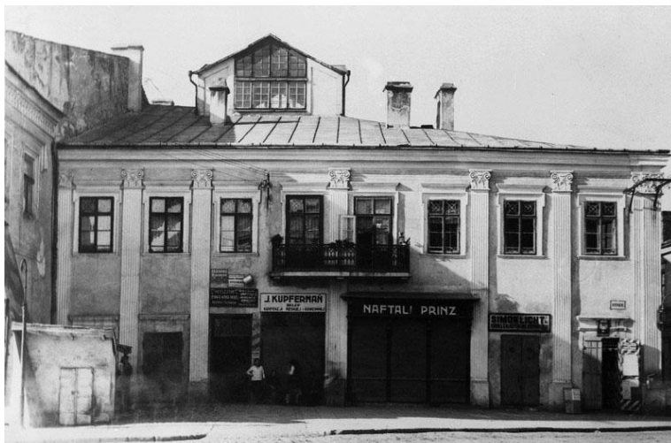
Fig. 8. "Kamienica Marysienki" (the Marysienka tenement house) in Jarosław - before 1939.

W Jarosławiu, w odróżnieniu od sąsiedniego Przeworska, dzielnica żydowska nie charakteryzowała się odrębną architekturą, stąd ciężko dopatrzeć się w dzisiejszym krajobrazie miasta śladów stricte żydowskiej zabudowy mieszkaniowej – chyba, że za taki uznamy dosłownie jeden parterowy dom położony przy ul. Opolskiej, tuż obok synagogi (pozostałe budynki, nawet w bezpośrednim sąsiedztwie, mają przynajmniej jedno piętro). Nie oznacza to jednak, że żydowskich śladów nie ma w ogóle - dopatrzeć się ich można np. na starych fotografiach, gdzie na elewacjach jarosławskich kamienic widoczne są żydowskie szyldy sklepowe – w 1926 roku Żydzi byli właścicielami 72% placówek handlowych w mieście, 11 żydowskie sklepy mieściły się m.in. w kamienicy Marysienki czy kamienicy