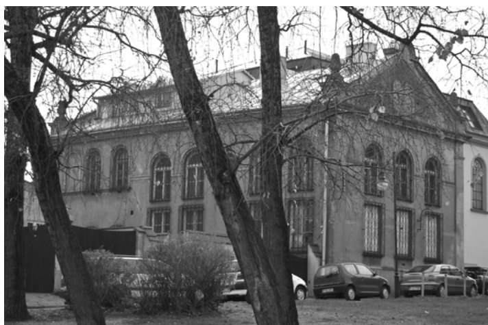
Ryc. 3. Mała synagoga – widok ogólny.

Druga synagoga, zwana małą, zlokalizowana jest w sąsiedztwie synagogi dużej, ok. 50m na północ. Jest to niewielki piętrowy budynek, którego prosta bryła ozdobiona została grą okien i stolarki. Synagoga została zbudowana w 1900 roku. Murowany budynek synagogi został wzniesiony na planie prostokąta. Główna sala modlitewna znajdowała się od strony północnej (ok.1000 miejsc siedzących). Od strony południowej znajdował się przedsionek, nad którym mieścił się babiniec. Podczas II wojny światowej wyposażenie synagogi uległo zniszczeniu, samo wnętrze zaś zostało zdewastowane.