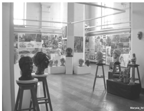
Ryc. 2. Dawna sala modlitewna – wystawa uczniów ZSP.

Fig. 1. The Big Synagogue – general view.