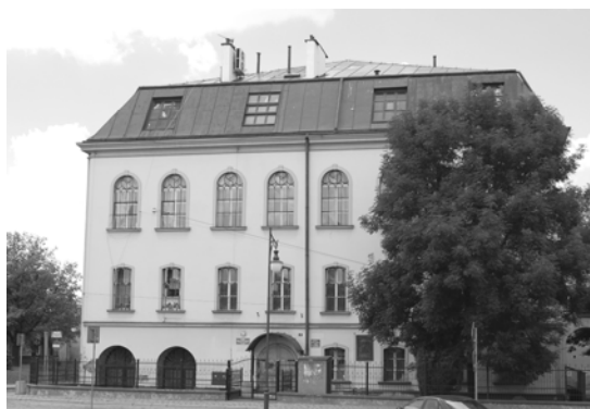
Ryc. 1. Duża synagoga – widok ogólny.

Głównym obiektem sakralnym gminy żydowskiej była tzw. duża synagoga, położona przy ul. Opolskiej. Wzniesiona została w 1811 roku, prawdopodobnie na miejscu rozebranego najstarszego żydowskiego domu modlitwy w Jarosławiu z pierwszej połowy XVIII wieku. 2 Jest to prostopadłościenny budynek na bazie kwadratu o wymiarach 25 x 25 metrów, nakryty kopertowym dachem; najważniejszym elementem stosunkowo prostej elewacji są ogromne, półkolistie zwieńczone okna, doświetlające pomieszczenia pierwszego piętra.