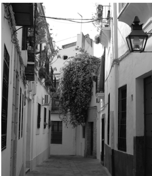
Ryc. 9. Ulica w Starej Kordobie.

Najważniejszym podobieństwem jest spójność wieloreligijnego krajobrazu miast, które tworzyły jednolitą całość. Dzielnice etniczne albo nie występują, albo są zaznaczone umownie, a ich istnienie zależy przede wszystkim od obiektów sakralnych związanych z poszczególnymi religiami. W przypadku Kordoby architektura dzielnic arabskich, żydowskiej i chrześcijańskich ma wyraźne cechy mauretańskie, w Jarosławiu – miasto wygląda na jednolicie chrześcijańskie. Stara Kordoba to piętrowe, białe budynki z niewielkimi oknami, stary Jarosław – kupieckie kamienice, dwu- lub trzykondygnacyjne w zależności od bogactwa właściciela. Wyraźne różnice w urbanistyce, wspólne dla obydwu miast, przynosi dopiero wiek XIX – szersze ulice, promenady, place i wyższe kamienice.