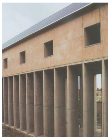
Ryc.2. Cmentarz San Cataldo, A. Rossi, G. Braghieri, Modena, Włochy, 1971–1984.