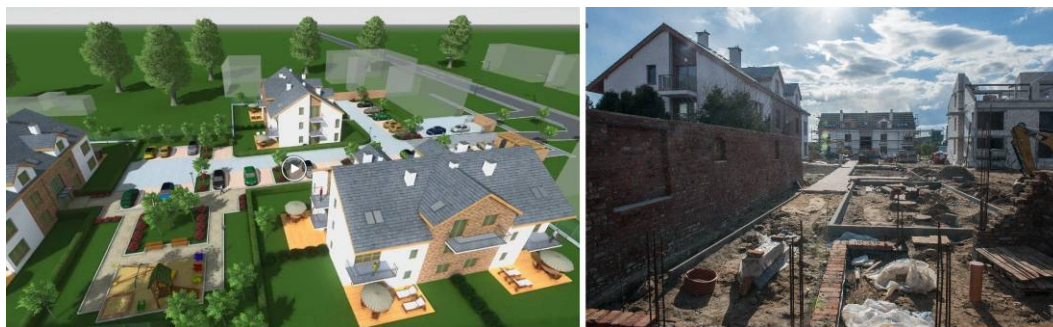
Fig. 16. Right: Printsreen from the movie promoting future investment at Szeroka 31 street. Right: current development of the investment (as for 18.05.2017).

Again, as in the previous cases the project does not include compliance with the street frontage. The empty spot after demolishment of the barn will not be filled. In exchange the frontage will be complemented with entrance gate with dumpster area. (Fig. 16,17) [2].