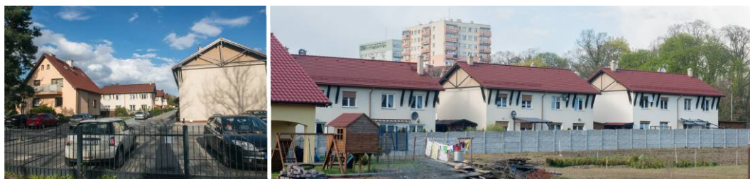
Fig. 11. Complex of residential development at Szeroka 61 street. Left: View from Szeroka street. Right: Partial view of the developments located back up the plot.

Backing up the new developments to the back of the plot generated additional space for parking spots for residents. The solution deformed the historical shape of Szeroka street frontage (Fig. 12).