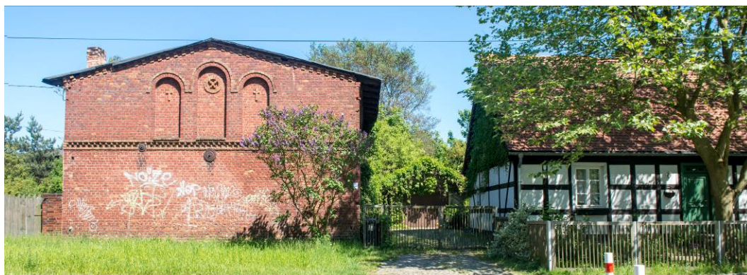
Fig. 3. Frontal wall of the barn is an important factor in the whole composition of the Szeroka street frontage.

Ryc. 2. Jedna ze stodół przeznaczonych do rozbiórki.