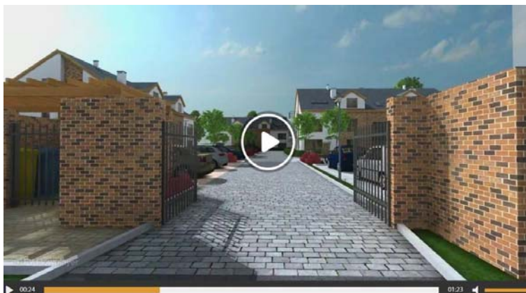
Fig. 17. Printsreen from the movie promoting the investment at Szeroka street 31 in Krzekowo. Source: [3]

Ryc. 16. Na prawym zdjęciu zrzut ekranowy filmu reklamującego przyszłą inwestycję przy ul. Szerokiej 31. Na prawym obecnny stan realizacji tego przedsięwzięcia budowlanego (stan na 18,05,2017 r.). Źródło: https://konsart-deweloper.pl/ , zdjęcie autora