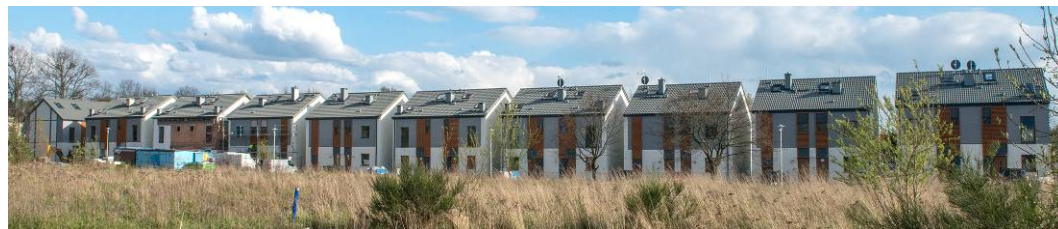
Fig. 22. View on the semi-detached housing development. Source: Photo Waldemar Marzęcki

Ryc. 21. Folder reklamujący zespół zabudowy bliźniaczej przy ul. Brzozowej łączącej ul. Szeroką z ul. Żyzną. Źródło: [2]