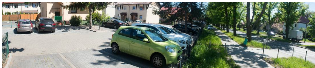
Fig. 12. Parking spots for the residents created by backing up the development from the historical linear arrangement of Szeroka street in Krzekowo.

Ryc. 11. Zespołu zabudowy mieszkaniowej przy ul. Szerokiej 61. Po lewej widok od ul. Szerokiej. Po prawej widok fragmentu zabudowy ulokowanej w głębi działki.