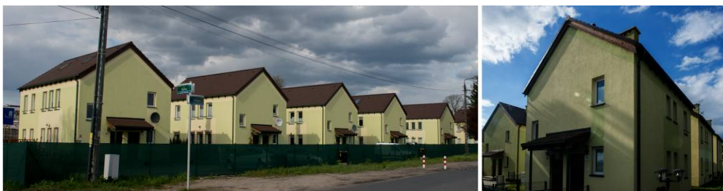
Fig. 14. Complex of housing developments built at the crossing of Żniwna and Żyzna street in Krzekowo.

Ryc. 13. Zespół zabudowy mieszkaniowej wzniesiony przy skrzyżowaniu ulicy Żniwnej z ulicą Żyzną w Krzekowie.