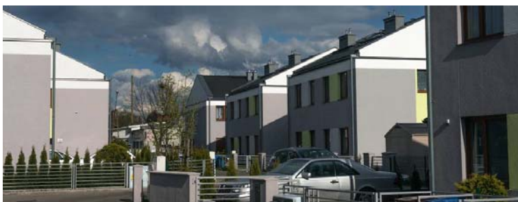
Fig. 20. View from Jerzyka street on the internal side of the development between Szeroka and Żyzna street.

Ryc. 19. Widok na fragment zespołu zabudowy jednorodzinnej na skrzyżowaniu ul. Jerzyka z ul. Szeroką.