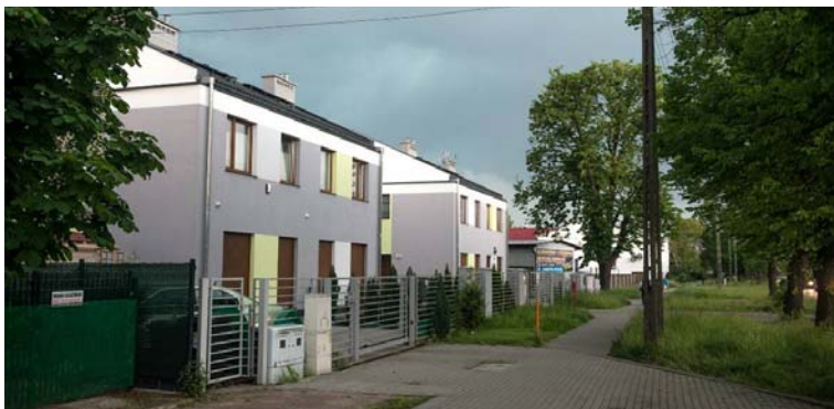
Fig. 19. Partial view of complex of detached houses at the crossing of Jerzyka and Szeroka street.

Another example of an extreme economical approach is the currently ongoing residential housing project along the Bukietowa street [3]. On a typical, narrow plot, there are 10 semi-detached houses. The visualization itself presented by the developer shows how compacted is the plot (Fig. 21).