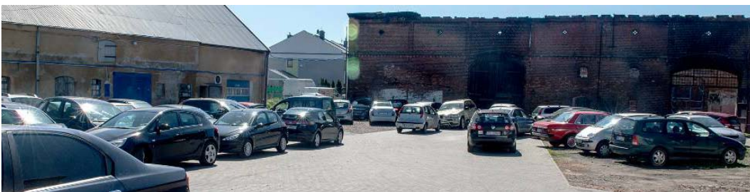
Fig. 1. Car workshop located in one of the old farmstead backyard.

The decreasing number of old barns significantly changes the spatial landscape of Krzekowo. The traditional utility buildings play an important part in shaping the inner backyards located behind the frontal residential developments. Few of the existing barns additionally create the frontage of Szeroka street. They are located frontally to the street (Fig. 3).