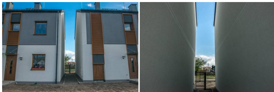
Fig. 23. View of the 1.5 m space between the semi-detached houses on Brzozowa street.

Ryc. 22. Widok na zabudowę bliźniaczą przy ul. Brzozowej łączącej ul. Szeroką z ul. Żyzną.