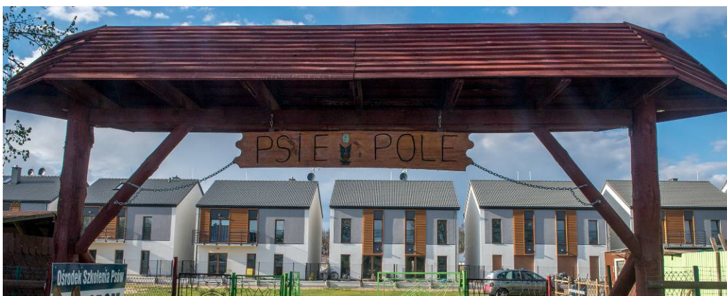
Fig. 24. View on the semi-detached housing development on Brzozowa street

Ryc. 24. Widok na zabudowę bliźniaczą przy ul. Brzozowej.