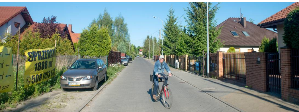
Fig. 10. Detached house developments on Inspektowa street located on the outskirts of Krzekowo.

More intense development of Krzekowo occurred when buildings were raised at the outskirts of former old village. Supreme location of Krzekowo in comparison with the rest of Szczecin made the neighborhood attractive for residential investments. Despite wetlands in the east, the majority of residential development was located there. Most of the buildings are villas located on a medium sized plots. This is especially visible in the area between the Żyzna and Bukowa street. Outlying location of the area makes the situated residential development without an impact on the urban space of the Krzekowo's center (Fig. 10).