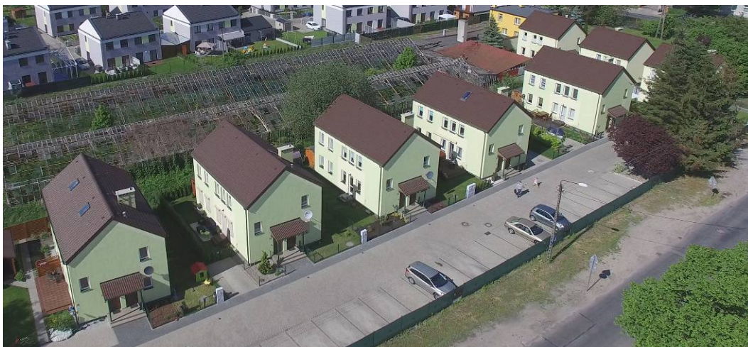
Fig. 13. Complex of housing developments built at the crossing of Żniwna and Żyzna street in Krzekowo.

Ryc. 13. Zespół zabudowy mieszkaniowej wzniesiony przy skrzyżowaniu ulicy Żniwnej z ulicą Żyzną w Krzekowie.