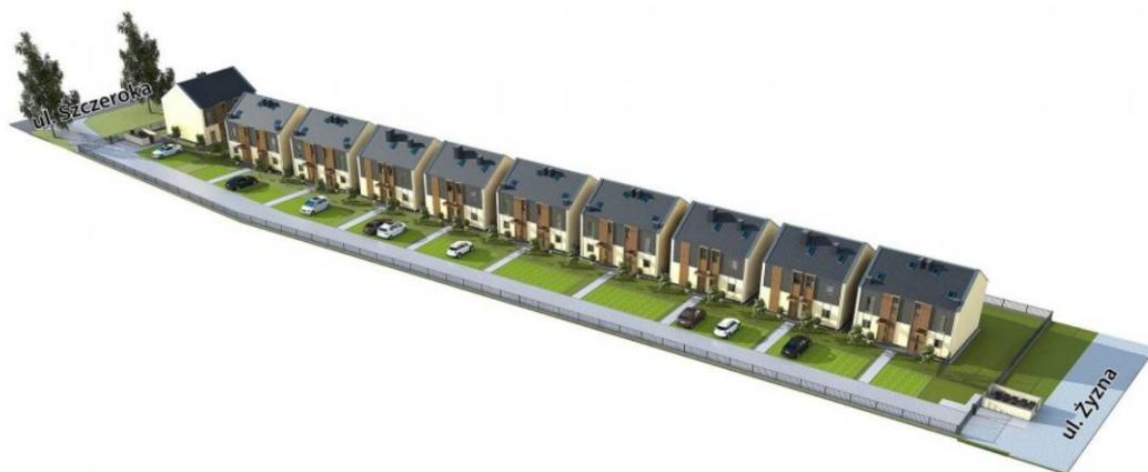
Fig. 21. Visualization of the semi-detached housing development on Brzozowa street that connects the Szeroka and Żyzna streets. Source: [2]

We must ask ourselves a question now, if we should build compacted residential complexes, similar to the ones in London's districts during the industrial revolution.