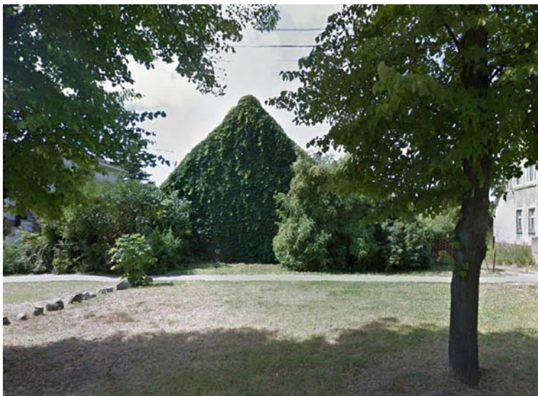
Fig. 15. Archive photos of now demolished barn located on the Szeroka street in Krzekowo.

Ryc. 14. Zespół zabudowy mieszkaniowej wzniesiony przy skrzyżowaniu ulicy Żniwnej z ulicą Żyzną w Krzekowie.