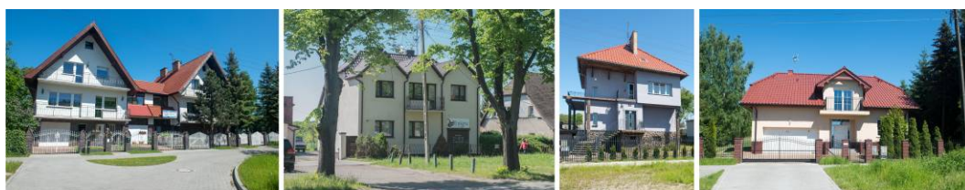
Fig. 5. Examples of detached houses built after the Second World War on Szeroka street in Krzekowo.

The process includes development of new detached houses. This solution of development compaction can be seen throughout the whole post-war period in Krzekowo.