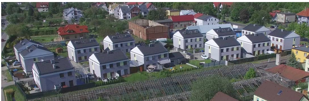
Fig. 18. Complex of residential buildings located between Szeroka and Żyzna street right by internal Jerzyka street.

Ryc. 18. Kompleks budynków ulokowanych pomiędzy ulicami Szeroką i Żyzną na wysokości drogi wewnętrznej Jerzyka.