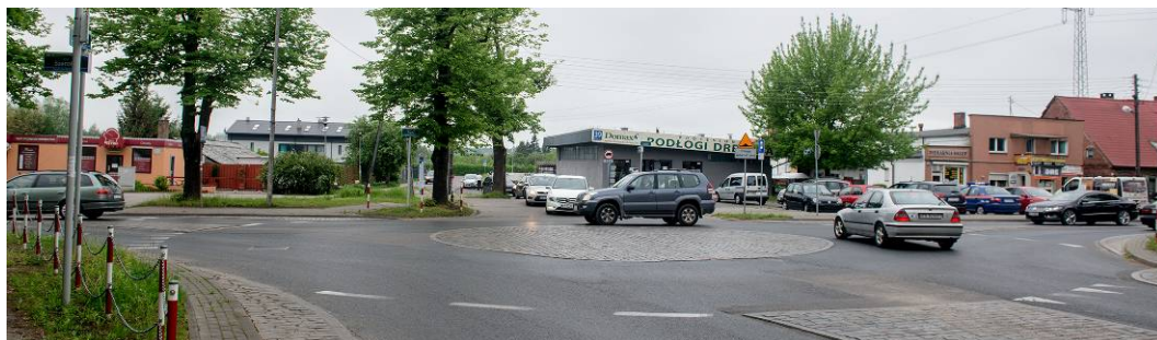
Fig. 7. Buildings with flat roofs located at the entrance to Krzekowo from Szczecin.

Ryc. 7. Obiekty z płaskimi dachami ulokowane na wjeździe do Krzekowa od strony Szczecina.