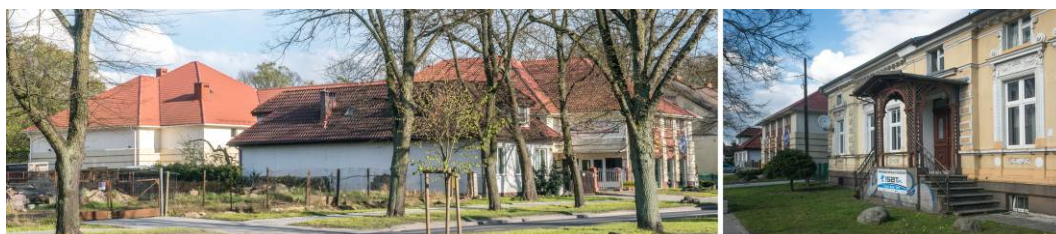
Fig. 8. Left: furniture warehouse with residential building back up the plot. Right: pre-war residential building.

This type of development occurs only once, hence could be treated as marginal. However, the quality of the implemented solution makes it worthy for discussion. The vacant parcel alongside the frontage of Szeroka street was filled with a furniture warehouse of considerable size (Fig. 8).