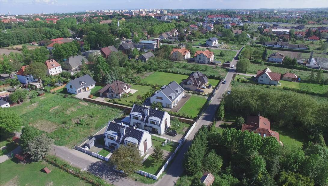
Fig. 9. Complex of residential developments located back up the plots on Szeroka street in Krzekowo.

Ryc. 9. Zespół zabudowy mieszkaniowej wzniesiony na tyłach działek przy ul. Szerokiej na Krzekowie.