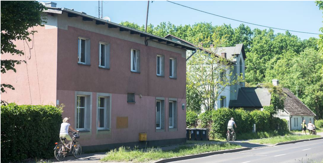
Fig. 5. Examples of detached houses built before the Second World War on Szeroka street in Krzekowo.

Despite the architectural differences between the buildings, their existence does not deform the historical shape of the urban space. This is a result of their compliance with former linear spatial arrangement of former village. Additionally pre-war developments is diversified in terms of their architectural style, height and roof shape (Fig. 5).