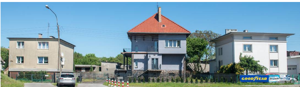
Fig. 6. Example of two detached houses with flat roof built after Second World War on Szeroka street in Krzekowo.

Because of the differences between the pre-war and post-war developments the focal point of urban concept of Krzekowo is located along the wide green belt with a street in between. Unfortunately, among the pre-war developments, buildings with flat roofs are considerably numerous (Fig. 6).