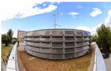
Ryc. 5. Centrum Demonstracyjne Odnawialnych Źródeł Energii, Bydgoszcz. Widok paneli PV i turbiny wiatrowej na dachu.

Fig. 4. RES Demonstration Centre, Bydgoszcz, arch. T. Mielczyński.