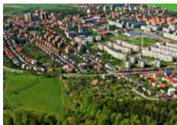
Ryc. 1. Bielawa. Tereny zielone oraz poprzemysłowe.

Bielawa ma również tradycje przemysłu lekkiego, który do 1989 r. rozwijał się intensywnie jednak na skutek zmian społeczno-gospodarczych nastąpiło jego załamanie. Dwa duże bielawskie zakłady włókiennicze, „Bielbaw” i „Bieltex”, uległy likwidacji, co w rezultacie spowodowało znaczną degradację ogromnych obszarów miasta [1]. W celu zagospodarowania poprzemysłowych terenów i ich rekultywacji władze miasta zdecydowały się na działania w ramach realizacji Lokalnego Program Rewitalizacji w latach 2007–2013 . Cele strategiczne LPR dla miasta Bielawa dotyczyły m.in.: aspiracji do miasta aktywnego ośrodka wypoczynku i rekreacji Dolnego Śląska, jak również wspomnianego modelowego ekomiasta. Bielawa jest też gminą partnerską podejmującą współpracę transgraniczną oraz międzynarodową [24]. Gmina ta uczestniczyła w tworzeniu podstrefy Wałbrzyskiej Specjalnej Strefy Ekonomicznej, realizując koncepcję Bielawskiego Parku Przemysłowego oraz Inkubatora Przedsiębiorczości. Jedną z szans na rozwój Bielawy jako modelowego ekomiasta stanowi budowa dużej infrastruktury do pozyskiwania energii odnawialnej wykorzystującej siłę wiatr i promieniowanie słoneczne [26].