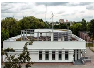
Ryc. 4. Centrum Demonstracyjne OZE przy ZSM nr 2, Bydgoszcz, arch. T. Mielczyński, fot. V. Kus. Źródło: [17]

Istotne miejsce wśród podejmowanych przez miasto inwestycji z pewnością zajmuje wspieranie działań z zakresu produkcji czystej energii z OZE. W czerwcu 2011 r. Bydgoszcz zdobyła trzecie miejsce w konkursie organizowanym przez Europejską Ligę Energii Odnawialnej (RES Champions Renewable Energy League) w kategorii miast wykorzystujących energię z OZE, w ramach europejskiego programu Intelligent Energy . Komisja konkursowa doceniła miasto m.in. za przyjętą przez Radę Miasta w 2010 r. politykę ochrony klimatu, mającą na celu znaczną redukcję emisji gazów cieplarnianych z perspektywą do 2020 r., za prężną współpracę władz miasta z wieloma lokalnymi środowiskami, również za współpracę na arenie międzynarodowej w ramach projektu 3×20 Network, za organizację Bydgoskich Międzynarodowych Targów Energii Odnawialnej. Doceniono także takie działania jak: instalacja paneli fotowoltaicznych w firmie Frosta (lider mrozonek, wytwarzający na powierzchni 600 m 2 80,5 kWp energii elektrycznej) oraz wysokosprawna, spalająca biomasę nowa kotłownia Sklejka-Multi S.A., jak również ogniw solarne w Kujawsko-Pomorskim Centrum Pulmonologii oraz w dziesiątkach prywatnych budynków, promując aktywnych konsumentów energii, a w przyszłości prosumentów.