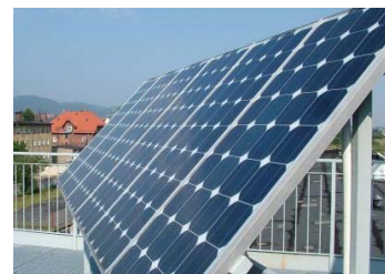
Ryc. 3. Bielawa – Szkoła Słoneczna (Centrum OZE). Widok dachu i instalacji PV.

Fig. 2. Logotype of Bielawa.