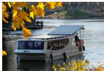
Ryc. 6. Bydgoski tramwaj wodny „Słonecznik”.

Fig. 5. RES Demonstration Centre, Bydgoszcz. View of PV installation and wind turbine on the roof.