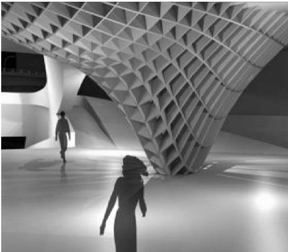
Il. 4. Model parametryczny opracowany w programie ParaCloud Gem. Autor Stephen Nieto