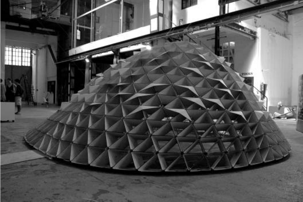
Il. 3. Parametric Dome' - projekt studia Digital Tectonics w Institute for Advanced Architecture in Catalonia (IAAC) pod kierownictwem Marty Male Alemany