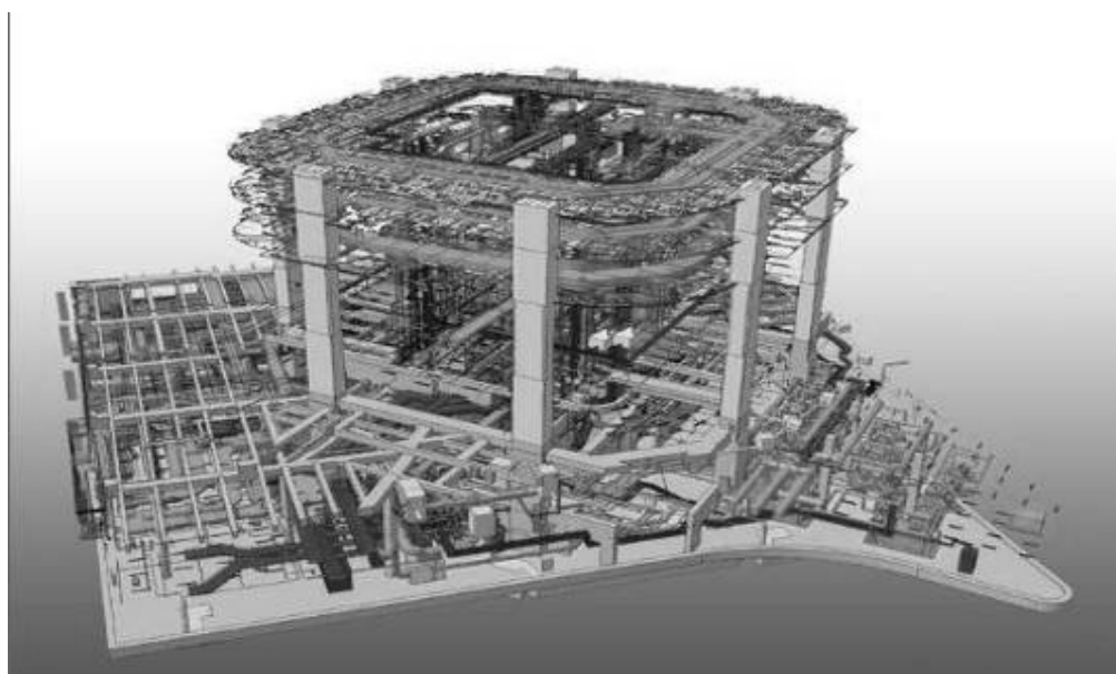
II. 2. Fragment modelu komputerowego BIM 70 piętrowej wieży biurowca Swire Properties Ltd w Hong Kongu