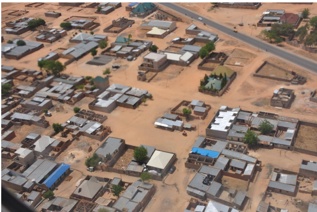
Fig. 2. Areal photography of the suburban emerging structure of informal housing representing the Chadian dwelling type

Ryc. 2 Zdjęcie lotnicze podmiejskiej powstającej struktury nieformalnej zabudowy mieszkaniowej reprezentującej tym domu czadyjskiego.