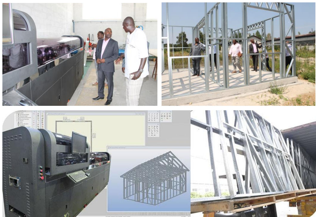
Fig.3. The Light Frame System production device with the outcomes in form of light steel structures for future fitting.

Prefabricated housing elements seems an interesting attempt to overcome the problem of lack of skilled working teams. If the major part of the building will be produced in the factory with a quality control system, the montage on site is rather simple and will not be a significant problem. Due to long transportation routes, the prefab elements should be as light as possible. The LFS assures these features.