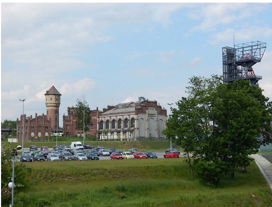
Fig. 4. Silesian Museum photo by: M. Wilkosz-Mamcarczyk, 2016

sent, as a result of the EU's policies for sustainable development as well as increased environmental protection measures, revitalization is becoming a response to the problems of the industrialization period in Poland. As defined in the Revitalization Act of 9 October 2015, revitalization is the process of bringing out degraded areas, brought about in a comprehensive way, through integrated action for the local community, space and economy, centered on revitalization based on the municipal revitalization program. The revitalization processes, with regard to the scope of activities, concern the historical centers of cities, specific urban districts, housing estates (especially platelets) but also, post-military and post-industrial areas.