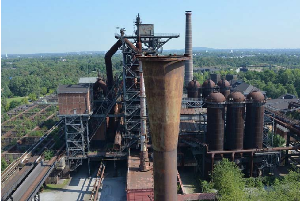
Fig. 1. Duisburg Nord Park, photo by D. Mamcarczyk, 2016

parks, functions as an integrative element (connects elements of the world of industry with the natural world), arranges gardens. Bridges and steel bridges dominate the leading feature that can overcome many of the height differences created by post-mining activities. Of particular interest there is the red bridge of unconventional construction on the Rhein-Herne canal, which is a symbol of the park [7].