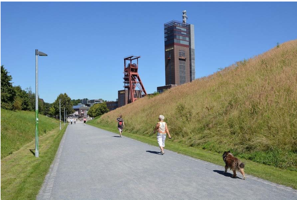
Fig. 2. Nordstern Park, photo by M. Wilkosz-Mamcarczyk, 2016

Ryc. 1. Park Duisburg Nord, fot. D. Mamcarczyk, 2016