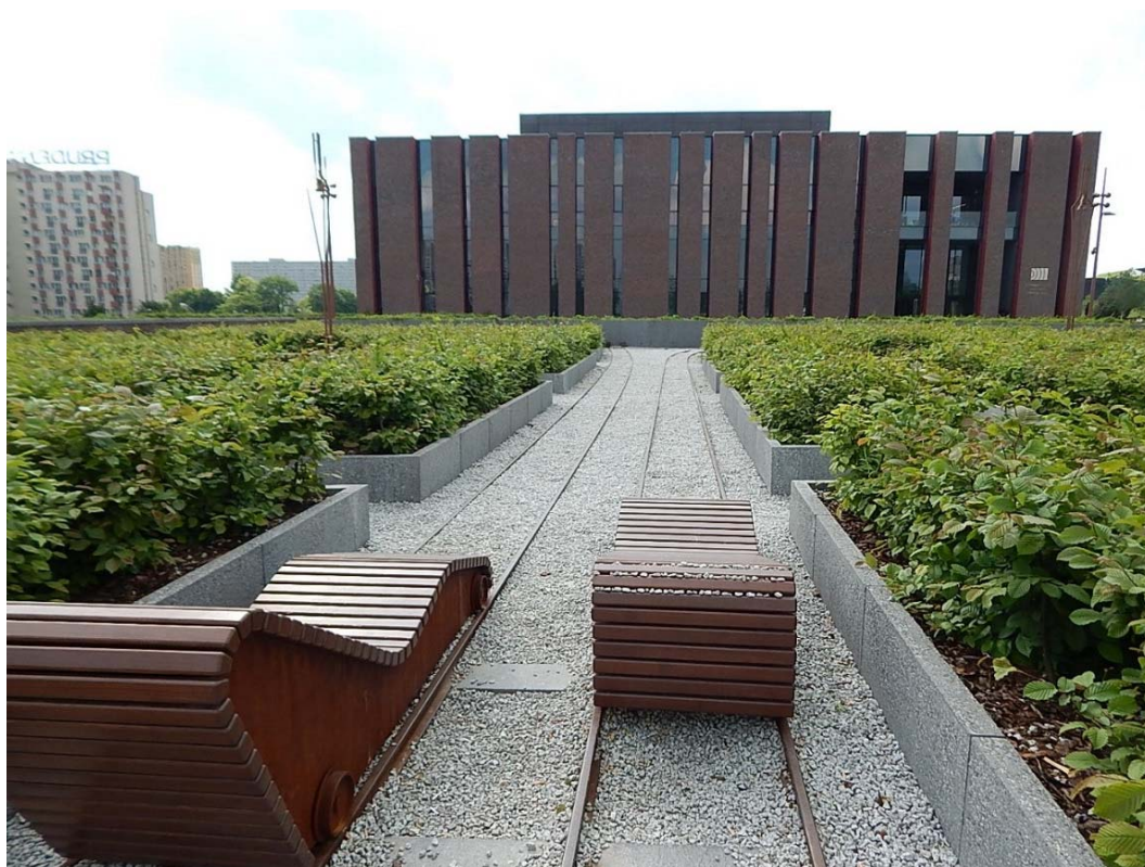
Fig. 6. NOSPR, photo by: M. Wilkosz-Mamcarczyk, 2016

Ryc. 6. NOSPR, fot. M. Wilkosz-Mamcarczyk, 2016