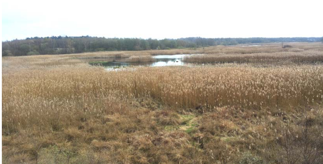
Fig. 2. Peatland around Świdwie Lake.

Peatlands unsuitable for development. In general, these are peatlands of cultural value. These are areas of high natural and landscape values, where human intervention would lead to degradation of the natural environment. An example of such peat bog is the peat complex that surrounds the largest lake of the Wkrzańska Forest –Świdwie Lake (Fig. 2), which is a reserve not only for its richness of flora but also for ornithological values. Due to the fact that the Świdwie peatland is located in the forests of the Wkrzańska Forest, the closest buildings are located at a considerable distance from this area, about 1 km. These are small villages characterized by low-density buildings, mainly composed of single-family houses and farm buildings.