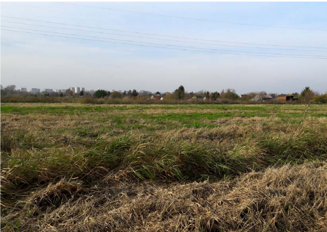
Fig. 5. Peatland on the Pucka Island.

Ryc. 4. Ostrów Grabowski, Szczecin.