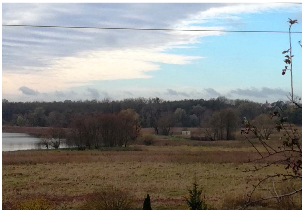
Fig. 3. Peatlands in the district Międzyodrze.

Peatlands suitable for development in the future. These are peatlands located in the vicinity of urbanized areas, with a high peat density, subjected to the consolidation process. An example of such peatland is the area of Ostrów Grabowski (Fig. 4), the river island of Międzyodrze, on which parts the refuse layers were located, in order to stabilize the settlement of the weak ground. Ostrów Grabowski area is destined for port development. Ostrów Grabowski is a port island and industrial (port) buildings are planned here. The existing construction facilities are located about 0.5 km from the peatland. These are, among others. transshipment sites, parking lots and sewage treatment plant.