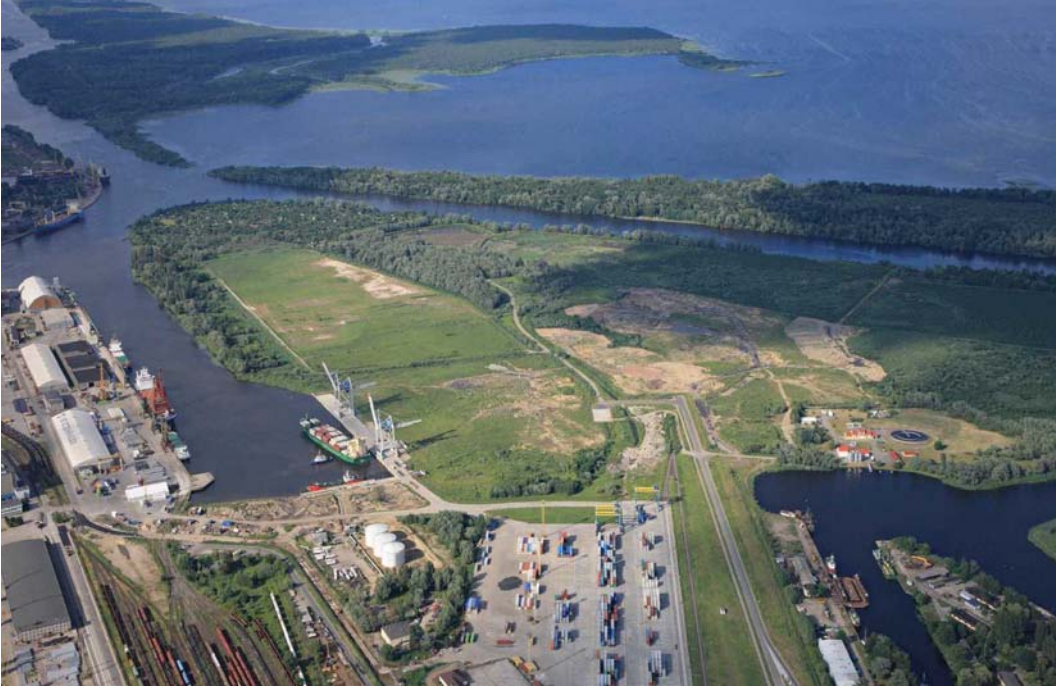
Fig. 4. Ostrów Grabowski island, Szczecin.

Ryc. 4. Ostrów Grabowski, Szczecin.