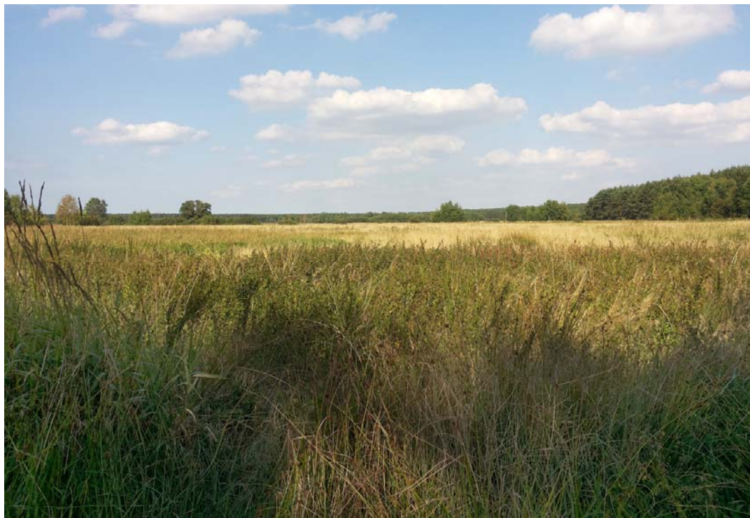
Fig. 6. Peatland in the vicinity of Wołczkowo.

Ryc. 6. Tofowisko w okolicy Wołczkowa.