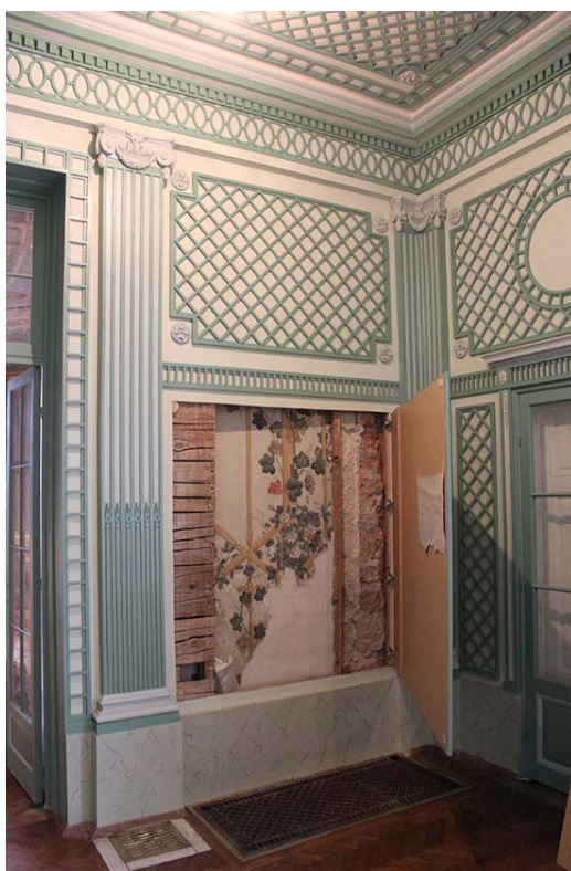
Fig. 8. Veranda Room, visible preserved polychrome with blend cover.

The present decor of the Verandah Room reflects its appearance when the last entailer left the Castle.