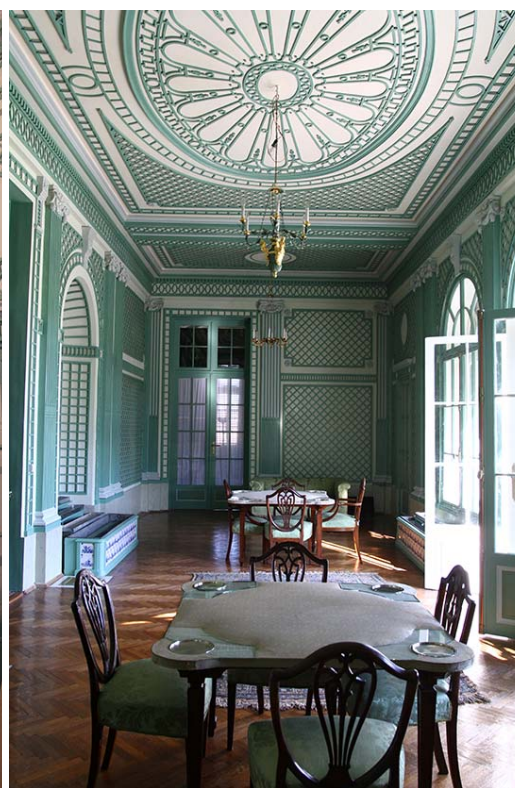
Fig. 9. Veranda Room after conservation work has been carried out.

Ryc.8. Pokój Werandowy, widoczna zachowana polichromia z blendą maskującą.