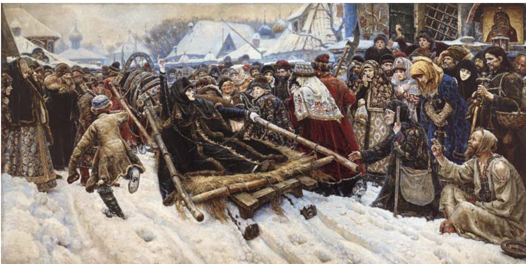
Fig. 1. Surikov Vasily. Noblewoman Morozov.

The laws of art are not as straightforward and unambiguous as the laws of science. And this "nonlinearity" of the laws of art creates difficulties in the way of an art researcher, but it is the source of new discoveries in the artist's work at the same time. Moreover, art is paradoxical, and this paradoxicality cannot be expressed by the strict logical thinking. What laws of mechanics can describe the movement of the sleigh by which the Surikov boyarynia Morozova is going? (Fig. 1.)