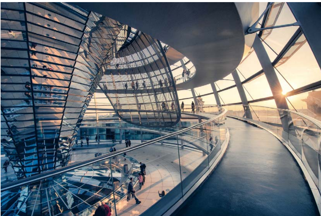
Fig. 3. Kopuła Reichstagu. Arch. Norman Foster. Ryc. 3. Mediateka w Sendai. Arch. Norman Foster.

working with curvilinear surfaces which are perceived as a property of natural forms. The following projects and buildings can serve as an example of this principle manifestation: The Penang Global City Centre (PGCC) in northern Malaysia (Asymptote). The “Penang Global City Center” complex will include two elegant towers resembling figurines of birds folded from paper. They are planned to be put on a huge platform inside of which there will be a congress center, theaters, concert halls, and various infrastructure facilities. Each of these towers consists of two vertical parts and a horizontal block connecting them. Their glass walls reflect and whimsically distort the views of the city, mountains and the seas surrounding the complex.