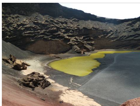
Ryc. 3 El Lago Verde - Zielone Jezioro.

The surface of the island is mostly shaped by volcanic eruptions. In the XVIII century the volcanic eruptions impacted ¼ of the island. The eruptions lasted between 1730 and 1736. The last volcano eruption took place in 1824. Thanks to volcanoes the Lanzarote Island owes its unique, peculiar, lunar landscape. It does not resemble any other known touristic islands. It is different, darker and mysterious. During the first visit the blackness stands out. The island looks like it is covered with rubble. The solidified lava streams are not yet smoothed by nature. The more you get to know the island, the more colour contrasts catches the eye. White buildings and black earth are in the background. The architecture on the island has its unique character; Bleached facades and green or blue door and window joinery (Fig. 2).