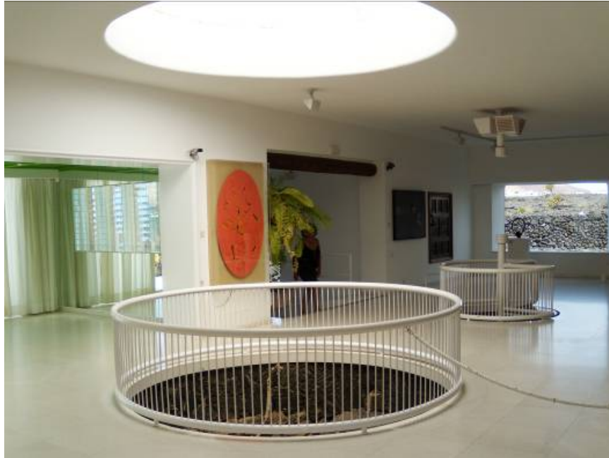
Ryc. 13 Pokój dzienny - dom własny Cesara Manrique.

Fig. 13. Living room - Cesar Manrique's residence.