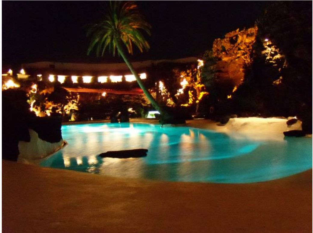
Ryc. 6 Jameos del Agua – zewnętrzny basen. Fig. 6. Jameos del Agua – exterior pool.