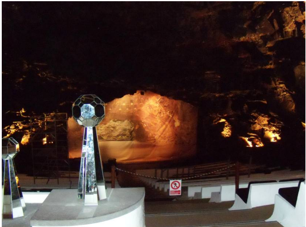
Ryc. 7 Jameos del Agua - audytorium w Jameo Grande.  Fig. 7. Jameos del Agua – auditorium in Jameo Grande.