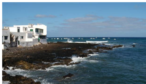
Ryc. 4 Tradycyjna, nadmorska architektura Lanzarote.

Fig. 3. El Lago Verde – the green lake.