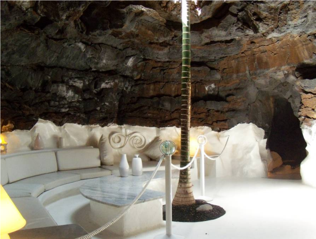
Ryc. 11 „Bańka biała” dom własny Cesara Manrique.

Fig. 11. „White bubble” Cesar Manrique's residence.