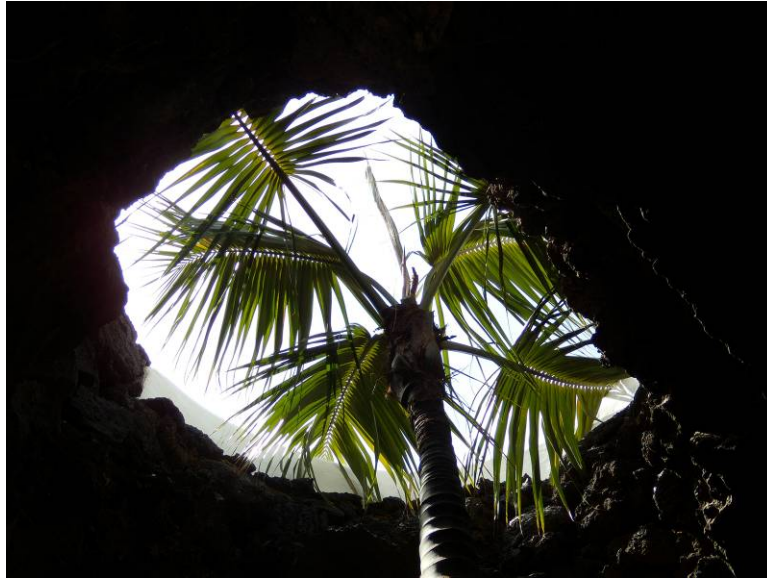
Ryc. 9 „Bańka biała” dom własny Cesara Manrique.

9. „White bubble”, Cesar Manrique's residence.