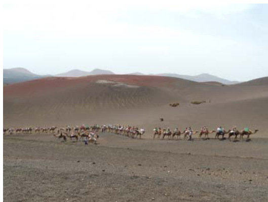
Ryc. 1 Krajobraz wyspy Lanzarote.

Fig. 1. The landscape of Lanzarote Island.