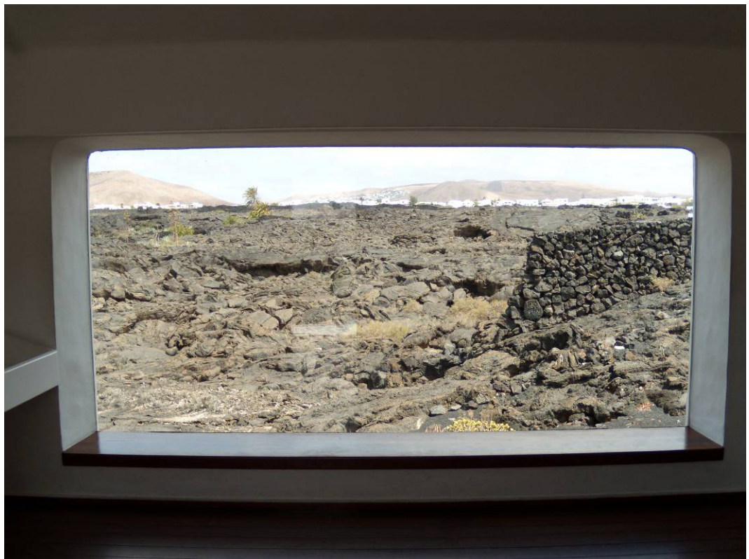
Ryc. 10 Widok z okna domu własnego Cesara Manrique.

9. „White bubble”, Cesar Manrique's residence.