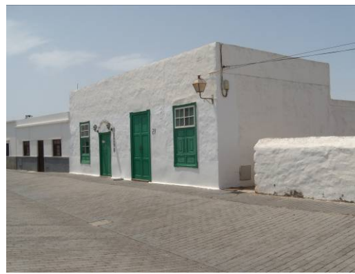
Ryc. 2 Tradycyjna architektura Lanzarote.

Fig. 1. The landscape of Lanzarote Island.