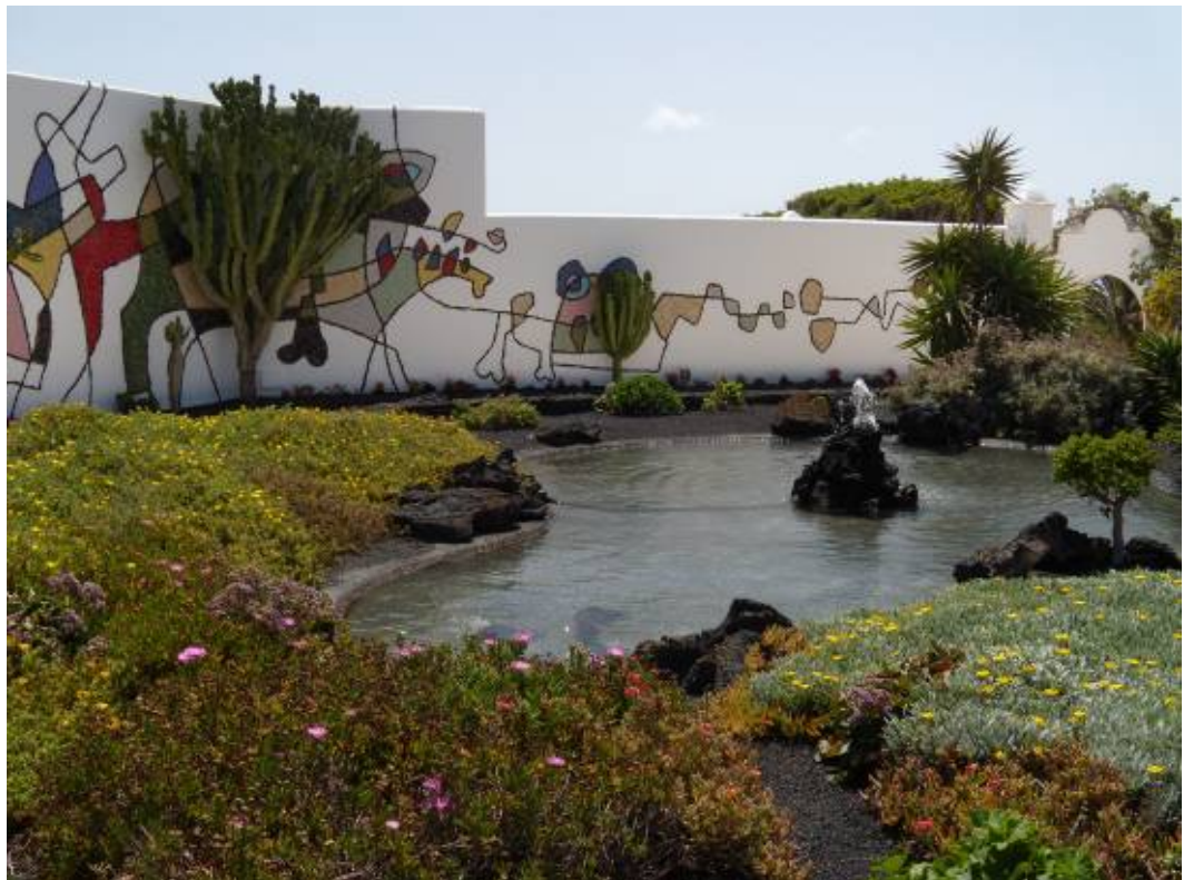
Ryc. 14 Widok na mural i zieleni. Domu własny Cesara Manrique.

The outer patio is decorated with one of the last pieces of art made by the artist - a mural on a white wall (Fig. 14). It was created with small tiles with different colours that are reflecting in the pond. The mural depicts an abstract vision made of continuous lines, filled with various colours that in a perfect way contrast with the white wall. It complements the water-greenery surrounding lightening it up and giving a positive and cheerful vibe.