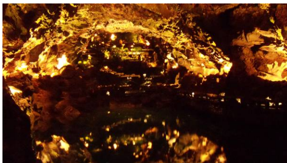
Ryc. 5 Naturalne jezioro w Jameos del Agua.