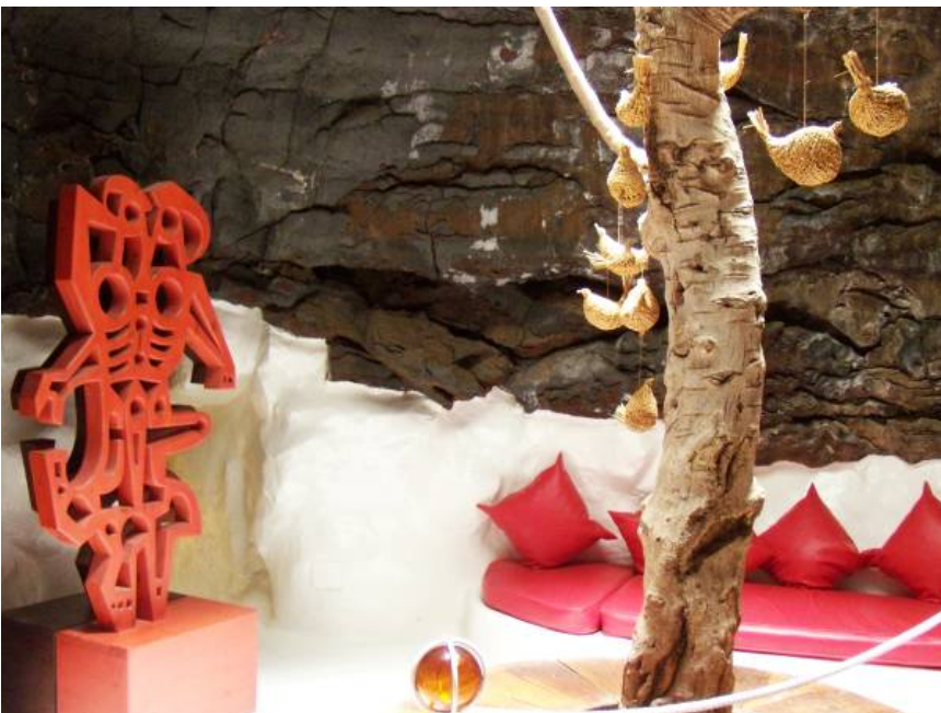
Ryc. 12 „Bańka czerwona” dom własny Cesara Manrique.

The upper floor is modern, spacious and inspired by traditional architecture of the Island (Fig. 2). The floor includes the following rooms: living room, kitchen, sitting room, guest room, bedroom and bathroom.