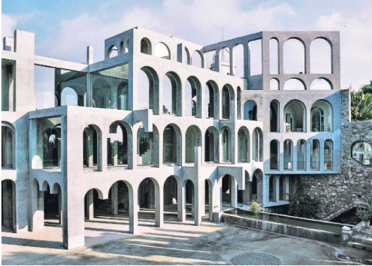
Fig. 1. Xavier Corbero's house. Ryc. 1. Dom Xaviera Corbero.

closed and dangerous; a sequence of spaces is unnecessary to feel lost in it. To perceive its labyrinthiness, a single interior is enough 5 .