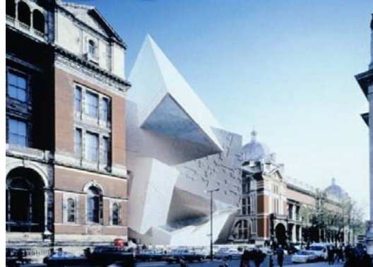
Fig. 2. Victoria & Albert Museum, proj. D. Libeskind.. Ryc. 2. Victoria & Albert Museum, proj. D. Libeskind.