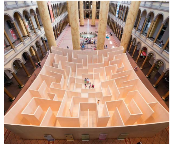
Fig. 8. BIG Maze, proj. BIG. Source: [8] Ryc. 8. BIG Maze, proj. BIG. Źródło: [8]