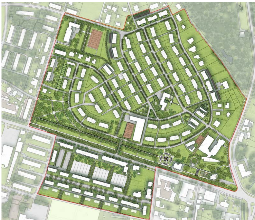
Ryc. 4. Koncepcja rewitalizacji.

Głównym celem przedstawionego w tej części relacji autorskiego projektu rewitalizacji zabytkowej kolonii robotniczej Stara Rokitnica w Zabrzu i terenów przyległych (ryc. 4-5) jest podkreślenie istniejących wartości oraz rozprzestrzenienie założeń idei miasta-ogrodu na obszary zdegradowane, sąsiadujące z zabytkowym zespołem zabudowy. Rozwiązania przedstawione w projekcie mają (w zamierzeniu autorki) charakter uniwersalny i mogą być stosowane w rewitalizacji wielu osiedli robotniczych oraz ośrodków typu miasto ogród. Podstawowym założeniem jest ogólna poprawa krajobrazu osiedla przez zagospodarowanie terenów zieleni towarzyszących zabudowie użyteczności publicznej oraz wprowadzenie zadrzewień wzdłuż ciągów komunikacyjnych. Zaproponowane rozwiązania pozwolą na przywrócenie ładu przestrzennego na najbardziej zaniedbanych fragmentach historycznego zespołu zabudowy oraz mają na celu podniesienie istniejących walorów krajobrazowych i odwołanie się do tradycji miejsca ( genius loci ).