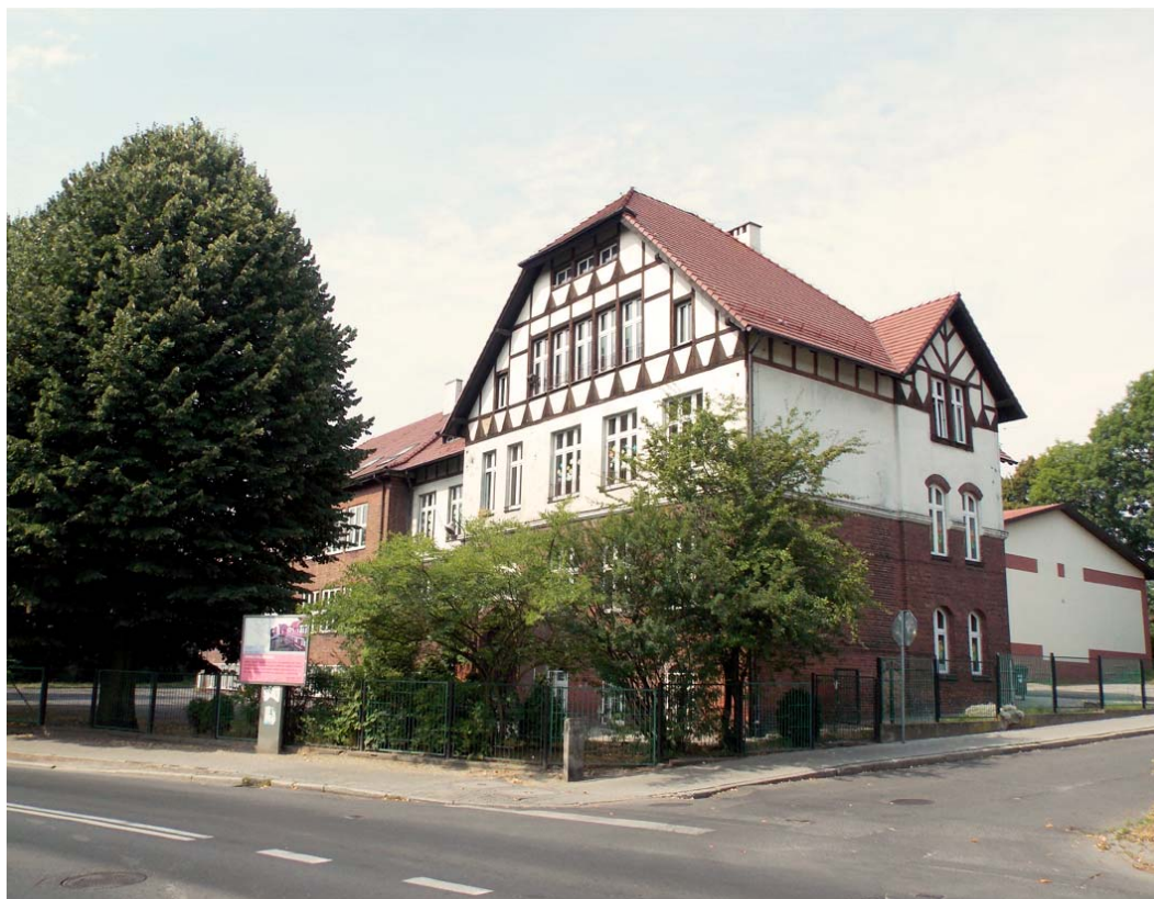
Ryc. 2. Kolonia robotnicza w Rokitnicy – budynek szkoły. Źródło: fot. autorka, 2013 r.

Na przykładzie Górnośląskiego Okręgu Przemysłowego można zauważyć, że kluczową rolę w procesie dalszego rozwoju ośrodków mieszkaniowych odgrywały lokalizacja oraz tereny zielone. Zgodnie z założeniami idei Howarda tworzenie powiązań pomiędzy miastem i wsią miało odbywać się nie tylko przez umiejscawianie w pobliżu zabudowy ogrodów przydomowych, ale przede wszystkim przez otaczanie ośrodków mieszkaniowych znaczenie większymi pierścieniami terenów rolniczych. Ze względu na stosunkowo niewielką powierzchnię działek istotną funkcję pełniły także przestrzenie zieleni publicznej zlokalizowane bezpośrednio wewnątrz miast [9, s. 26–27]. Analizując rozmieszczenie tego typu ośrodków mieszkaniowych na tle układu przestrzennego aglomeracji, można zauważyć, iż są one z reguły położone na obrzeżach miast, w otoczeniu terenów zieleni, z dala od stref przemysłu. Dzięki temu nadal stanowią chętnie zasiedlane miejsca zamieszkania. Przystosowanie tych obszarów do prowadzonej działalności człowieka odbywało się przez tworzenie powiązań komunikacyjnych pomiędzy miejscem zamieszkania a zakładem pracy [11, s. 52–58]. Dlatego współcześnie osiedla te, jako jedno z najbardziej malowniczych typów zabudowy robotniczej, stanowią niezwykle cenny przykład dziedzictwa kulturowego nawiązującego w krajobrazach miast przemysłowych do tradycji miejsca ( genius loci ).