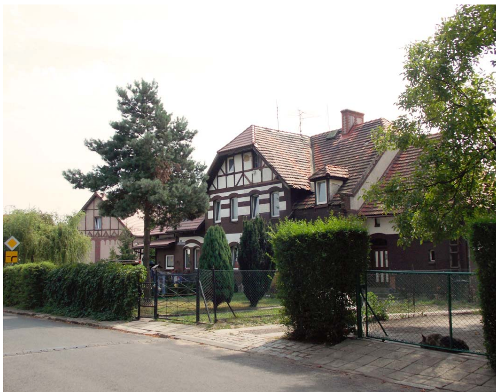
Ryc. 3. Kolonia robotnicza w Rokitnicy – zabudowa mieszkaniowa.

swój układ urbanistyczny wyraźnie wyodrębnia się z planu dzielnicy. Kompozycja założenia opiera się na koncentrycznym układzie ulic, zbliżonym do owalu. Podobnie jak w innych zespołach zabudowy opartych na założeniach idei miasta-ogrodu krzywizny ulic nawiązują do dróg w krajobrazach rustykalnych. Inspiracją dla obiektów architektonicznych były wiejskie domy śląskie oraz angielska zabudowa w stylu cottage (ryc. 2-3). Obiektem wyróżniającym się w przestrzeni osiedla jest budynek przedszkola, którego bryła została przesunięta w stosunku do linii zabudowy tak, aby tworzył on zakończenie osi kompozycyjnej [10, s. 110]. W południowej części wydzielono teren pod park publiczny. W momencie urządzania całość tworzyła harmonijną kompozycję urbanistyczną, wpisującą się w rustykalny charakter okolicy. Jednocześnie osiedle było jednym z najnowocześniejszych ośrodków mieszkaniowych typu miasto ogród w Europie. Przykładem poszukiwań nowych rozwiązań w architekturze oraz łączenia tradycji i nowoczesnych technologii było zastosowanie domów o konstrukcji stalowej, wzorowanych na realizacjach angielskich. W latach 20. XX w. ten typ budownictwa miał być metodą na szybkie i łatwe stawianie budynków. W Rokitnicy powstały cztery takie obiekty, które użytkowane są do dzisiaj i nadal stanowią ciekawy przykład architektury industrialnej [7, s. 232–233].