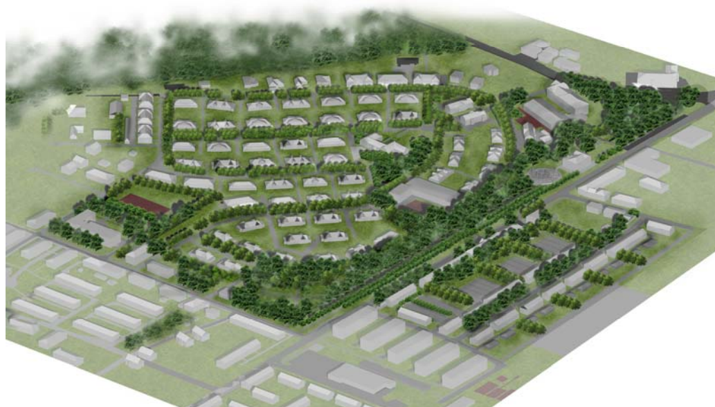
Ryc. 5. Koncepcja rewitalizacji – widok z lotu ptaka.

Jednak na przykładzie angielskich miast-ogrodów można zaobserwować, że zadrzewienia wzdłuż ciągów komunikacyjnych były bardzo popularną formą terenów zieleni. Pojawiała się ona także w innych osiedlach robotniczych na terenie aglomeracji górnośląskiej. Obecnie stosowanie zadrzewień wzdłuż ciągów komunikacyjnych pozwala na podkreślenie dobrze zachowanego układu urbanistycznego. Dodatkowo wraz ze zmianą stylu życia mieszkańców i zwiększeniem natężenia ruchu samochodowego wzrosło znaczenie funkcji izolującej. Zadrzewienia liniowe w korzystny sposób wpływają także na kształtowanie klimatu i mikroklimatu otoczenia [8, s. 7–12]. W przypadku kolonii robotniczej w Rokitnicy nasadzenia wzdłuż ciągów komunikacyjnych pozwolą na zrehabilitowanie strat, które zaszły w środowisku naturalnym na skutek ekspansji zabudowy mieszkaniowej na terenie cennej pod względem przyrodniczym doliny potoku rokitnickiego.