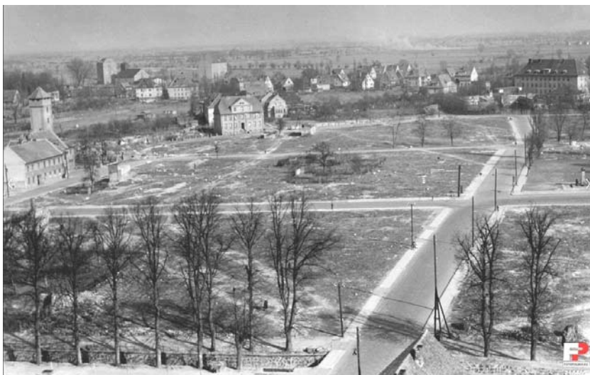
Ryc. 3. Krajobraz śródmieścia po wojnie.

Fig. 3. Landscape of town after WW2.