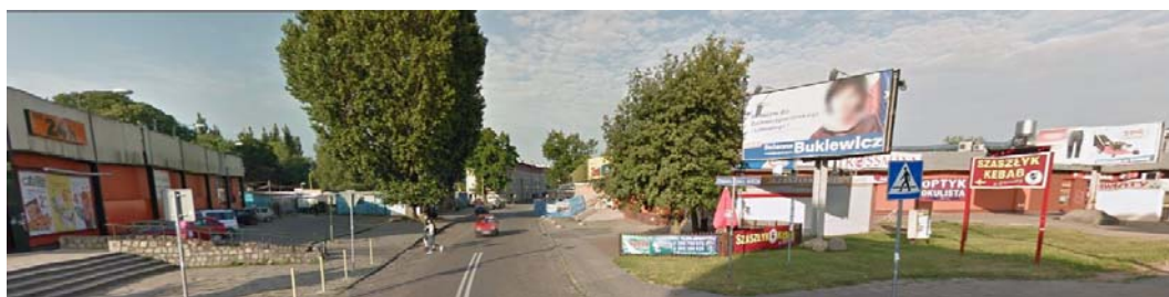
Ryc. 5. Centrum Szczecina-Dąbia.

Natomiast podejmowane w Polsce decyzje o warunkach zabudowy, przez działanie miejscowe i przy braku dostosowania inwestycji do planu rozwoju przestrzenno-krajobrazowego, generują chaos przestrzenny i degradację krajobrazu tego osiedla. Przykładem jest tu samo centrum Dąbia. Waloryzacja krajobrazu [4] wykazała tu największe wartości kulturowe zachowanego układu urbanistycznego centrum i zlokalizowanych tu budynków, z których najważniejszą dominantą jest pochodzący z XIV w. kościół Niepokalanego Poczęcia NMP. Obecnie na tym obszarze dominuje dysharmonijny zespół budynków handlowych w formie modernistycznej niskiej zabudowy. Przestrzeń publiczną zaśmiecają reklamy rozpraszające uwagę obserwatora (ryc. 5).