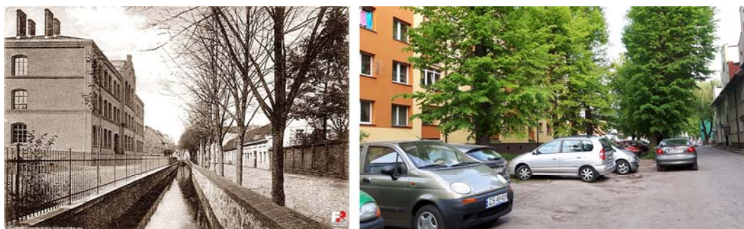
Ryc. 2. Widok ulicy Miernicznej w latach 1900-1910 (po lewej) i stan obecny r. 2016

Proces degradacji zasobów krajobrazowych możemy zaobserwować na przykładzie osiedla Szczecin Dąbie. Altdamm – dawne Dąbie – początki swojego istnienia datuje na w 1249 r., kiedy to niemieccy osadnicy wybudowali nad rzeką Płonią pierwszy gród i miasto. Na skutek intensywnego rozwoju Szczecina w 1948 r. Dąbie zostało włączone w jego granice administracyjne. Krajobraz, teraz już osiedla Dąbie, rozwija się w sposób niekontrolowany, zacierając ślady po dawnej miejscowości (ryc. 1, 2). Mieszkańcy osiedla podejmują liczne próby działania na rzecz rewitalizacji Starego Dąbia, organizując konkursy projektowe dotyczące rewitalizacji dawnego centrum miasta, murów miejskich, czy licznych wartościowych miejsc świadczących o tożsamości tej dzielnicy. Pomimo tej aktywności jednak efektywność tych wysiłków jest znikoma, a proces niszczenia wartości krajobrazowych postępuje coraz szybciej.