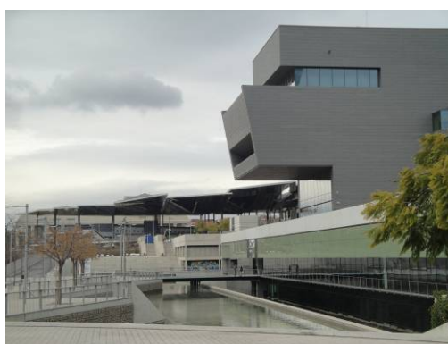
Ryc. 1, 2. Charakterystyczna bryła Museu del Disseny de Barcelona stanowiąca architektoniczne uzupełnienie placu.