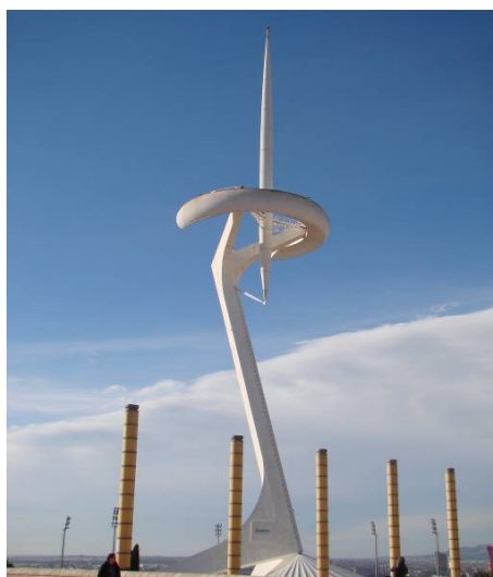
Ryc. 4. Montjuïc Tower – ekspresyjna forma stanowiąca lokalną dominantę wzgórza Montjuïc.

Fig. 3. The Collserola Tower – the height dominant characteristic for Barcelona.