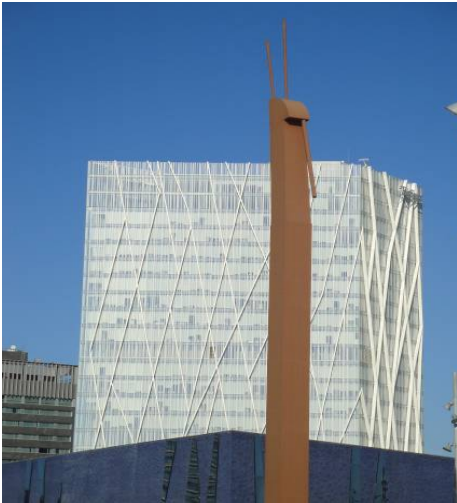
Ryc. 8. Torre ZeroZero de Telefonica – nowa architektura rewitalizowanego fragmentu miasta. Na pierwszym planie pomnik ofiar okresu dyktatury Francisco Franco.

– Pomniki, punkty widokowe, mała architektura – w przestrzeń Forum wprowadzono interesujące elementy przestrzenne współtworzące kompozycję urbanistyczną i architektoniczną miejsca. Lokalną dominantę stanowi lapidarny w formie Monumento a la Fraternidad – pomnik ofiar okresu dyktatury, straconych w okolicy dzisiejszej Plaza Forum (ryc. 8). W interesujący sposób potraktowano nową, otwartą przestrzeń dzielnicy, nadając jej charakter powiązanych, wielokierunkowych punktów ekspozycji krajobrazowej czynnej – ciekawe, zróżnicowane widoki przedstawia zarówno „industrialna” strona wschodnia wybrzeża (czytelne ślady dawnej, upośledzonej rozwojowo Barcelony), jak i uporządkowana, „promenadowa” strona zachodnia. Szczególne punkty ekspozycyjne podkreślono oryginalną formą architektoniczną (ryc. 9). Wysoki poziom rozwiązań projektowych osiągnięto w skali detalu architektonicznego – dopracowaną, indywidualną formę małej architektury wprowadzono m.in. w obszar Basenów Forum [6, s. 156–161]. Architektura falochronów, infrastruktury sportowej, czy płaszczyzn rekreacyjnych i punktów dostępu do tafli wody tworzą spójną całość czytelnie odwołującą się do surowej, odhumanizowanej przeszłości miejsca (ryc. 10, ryc. 11).