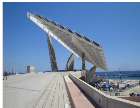
Ryc. 6, 7. Infrastruktura techniczna miasta zaprojektowana jako forma architektoniczna współtworząca sylwetkę nadmorskiej strefy miasta.