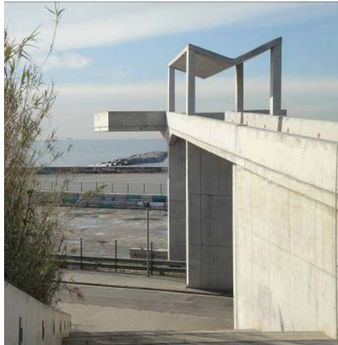
Ryc. 9. Punkt widokowy zapewniający odbiór atrakcyjnej linii styku miasta i morza.

Fig. 8. The Torre ZeroZero de Telefonica – new architecture of the revitalised fragment of the city. In the first plan, the monument of the victims of Francisco Franco's dictatorship.