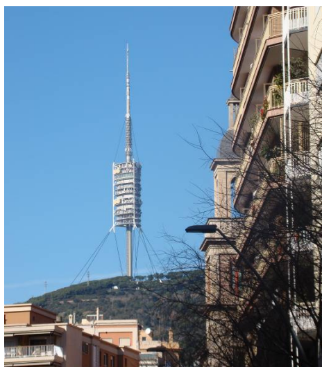
Ryc. 3. Collserola Tower – charakterystyczna dla Barcelony dominanta wysokościowa.

miast zachowano jego pierwotną architektoniczną formę [10, s. 192]. Oparto się pokusie stworzenia spektakularnego, drogiego obiektu służącego głównie jednorazowym ceremoniom otwarcia i zamknięcia igrzysk. Pozostałe obiekty kubaturowe umiejętnie wpisano w krajobrazowy kontekst miejsca, minimalizując ich ingerencję w eksponowaną przestrzeń wzgórz [10, s. 193–195]. Swobodna, niemalże parkowa kompozycja olimpijskiej zabudowy stworzyła jednocześnie wielokierunkowo otwartą przestrzeń ekspozycji krajobrazowej, pozwalającej na percepcję sekwencji rozległego miasta zróżnicowanych w charakterze przestrzennym.