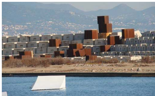
Fig. 10, 11. Individual architectonic detail set in the characteristic spatial context of the city.