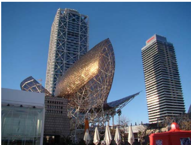
Ryc. 5. MAPFRE Tower i Hotel Arts – bliźniacze wysokościowce usytuowane w pasie nadmorskim, na pierwszym planie forma przestrzenna Franka Gehry'ego.

w funkcjonalną strukturę miasta, wywołując konieczność głębokiej modernizacji komunalnej infrastruktury.