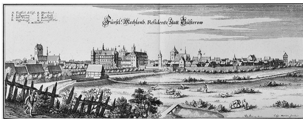
Ryc. 4. Zamek w Güstrow, sztych Matthausa Meriana z 1653 r.