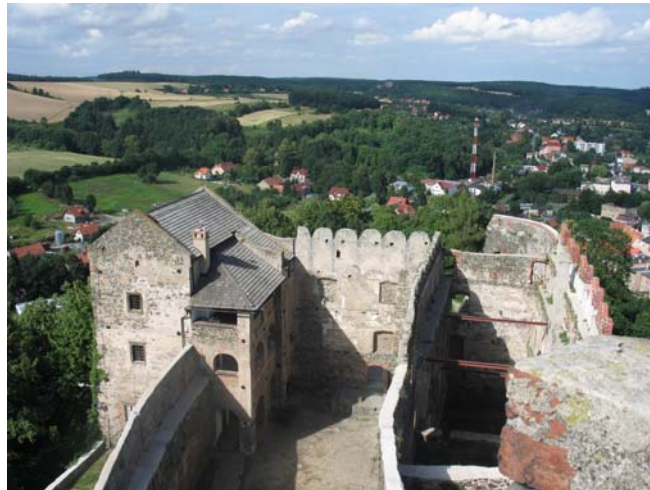
Ryc. 1. Zamek w Bolkowie, przebudowa (1533–1540) Jakub Parr.

Gdy cesarz Ferdynand przekazał zamek w Bolkowie 6 biskupowi wrocławskiemu Jakubowi Salzie 7 , humaniście wykształconemu w Lipsku, Bolonii i Ferrarze, biskup zatrudnił do renesansowej przebudowy zamku Jakuba Parra. Murator wznosił w latach 1539–1540 nowe fortyfikacje, rozbudował część mieszkalną zamku i wykonał wczesnorenansową attykę o motywach jaskółczego ogona (Ryc. 1 i 2).