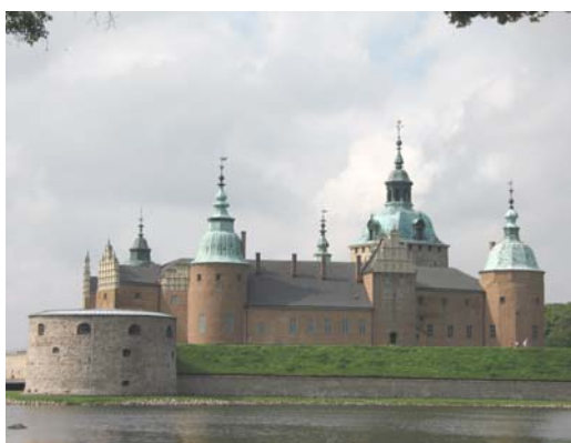
Ryc. 6. Zamek w Kalmarze przebudowywany od 1545 r. przez Franciszka Parra i jego braci. Źródło: fot. Joanna Arlet

Fig. 5. Castle in Güstrow, architect Francis Parr. Source: [12]