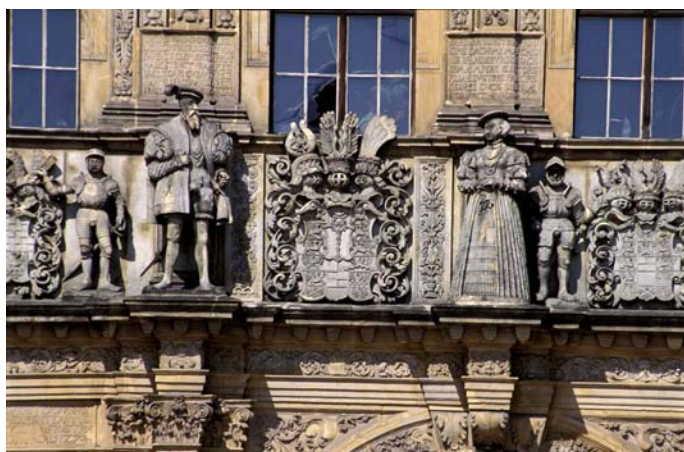
Ryc. 3. Zamek w Brzegu projektowany przez Franciszka Parra, główny budowniczy Jakub Parr.

dowy ścianą kurtynową, pierwotnie zwieńczoną attyką. Przejazd bramny zaprojektowany został na schemacie łuku triumfalnego, funkcjonalnie, lecz asymetrycznie, z jednym wjazdem i jednym przejściem pieszym. Nad nimi umieszczono pełnfigurowe rzeźby księcia Jerzego i jego żony. Pomiędzy figurami ustawiono staranne rzeźbione kartusze z herbami 10 , podtrzymywany przez postacie giermków, od strony lewej kartusz: Piastów legnicko-brzeskich (czarne, śląskie orły i po przekątnej białoczerwona szachownica), elektorów brandenburskich (złote berło w niebieskim polu) i rodu Hohenzollernów (biało-czarna szachownica i czerwony orzeł). By podkreślić pozycję pary książęcej, ich postacie wykonano znacznie wyższe od towarzyszących im giermków. Za figurami książąt umieszczono napisy inskrypcyjne, informujące o ich wspaniałych koligacjach, a powyżej wykonano dwa rzeźbione fryzy przedstawiające 24 popiersia przodków i krewnych Jerzego II Wspaniałego: Piastów – władców Polski, rozpoczynając od legendarnego Piasta, niżej Piastów – książąt śląskich. Program ideowy jest więc precyzyjny i czytelny. Tę bogato zdobioną bramę wieńczy kartusz z orłem jagiellońskim, podkreślając bliskie związki z Polską.