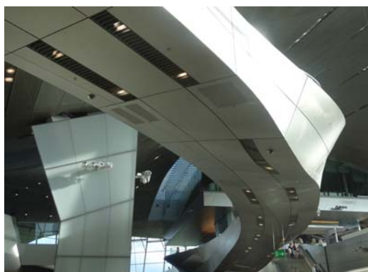
Ryc. 5. Coop Himmelb(l)au, Świat BMW, Monachium, konkurs 2001, realizacja 2007. Fig. 5. Coop Himmelb(l)au, BMW Welt, Munich, competition 2001, built 2007.