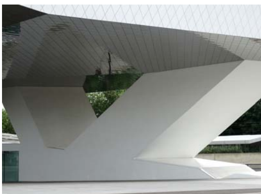
Ryc. 8. Delugan Meissl Associated Architects, Wenzel + Wenzel, Muzeum Porsche, Stuttgart, konkurs 2004, realizacja 2009.

Także w tym obiekcie czytelne są motywy dekonstrukcyjne. Układ budynku opiera się na motywie spirali, która podlega przekształceniu, dekompozycji i rozpadowi [6, s. 125]. Realizacja założeń projektowych wiązała się z wyjątkowo wysokimi nakładami i zaangażowanymi środkami. Projektując budynek mający mieścić 80 eksponatów, dużo uwagi poświęcono też ciągłej koordynacji projektowanych instalacji technicznych, tak żeby ich przebieg był ściśle zintegrowany z dynamiczną geometrią konstrukcji [1, s. 89]. Tak więc w tym przypadku predefiniowanej estetyce podporządkowano zagadnienia infrastrukturalne, co można uznać za działanie odwrotne w stosunku do przywołanej wcześniej „koncepcji diagramu”, którą promują architekci z grupy UNStudio.