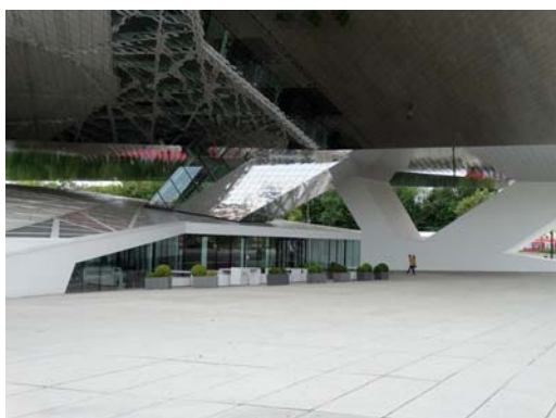
Ryc. 9. Delugan Meissl Associated Architects, Wenzel + Wenzel, Muzeum Porsche, Stuttgart, konkurs 2004, realizacja 2009.

Fig. 8. Delugan Meissl Associated Architects, Wenzel + Wenzel, Porsche Museum, Stuttgart, competition 2004, built 2009.