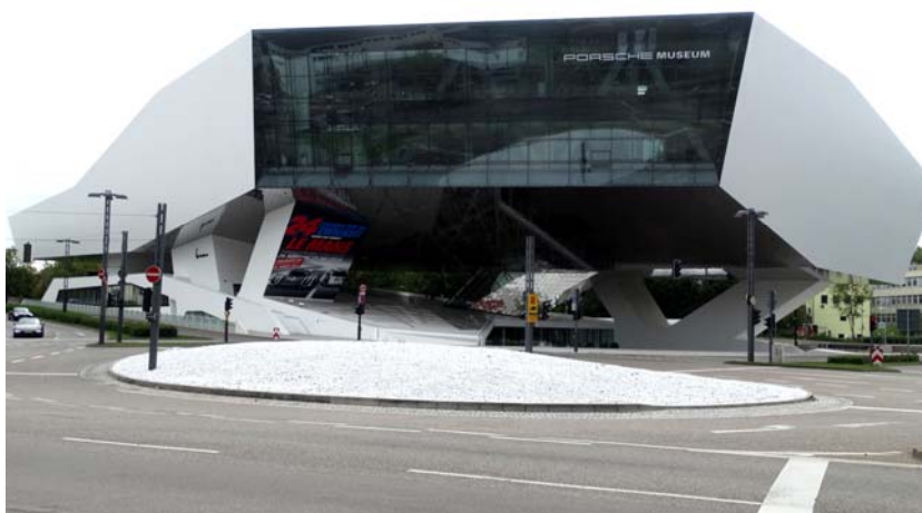
Fig. 7. Delugan Meissl Associated Architects, Wenzel + Wenzel, Porsche Museum, Stuttgart, competition 2004, built 2009.

Ryc. 7. Delugan Meissl Associated Architects, Wenzel + Wenzel, Muzeum Porsche, Stuttgart, konkurs 2004, realizacja 2009.