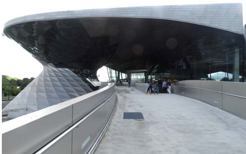
Ryc. 4. Coop Himmelb(l)au, Świat BMW, Monachium, konkurs 2001, realizacja 2007. Fig. 4. Coop Himmelb(l)au, BMW Welt, Munich, competition 2001, built 2007.