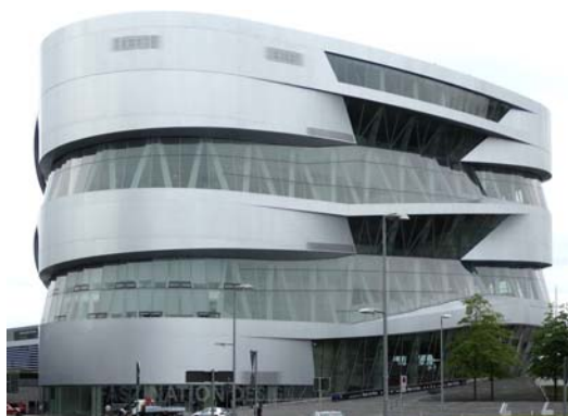
Ryc. 1. UNStudio, Wenzel + Wenzel, Muzeum Mercedes-Benz, Stuttgart, realizacja 2006.

Podstawą projektu Muzeum Mercedes-Benz w Stuttgarcie (ryc. 1–3) jest idea „diagramu”. Jest to budynek zaprojektowany przez holenderską grupę UN Studio dla koncernu, który od początku swojego istnienia jest związany ze stolicą landu Badenia-Wirtembergia. Budynek, położony w peryferyjnej dzielnicy Bad Cannstatt, sąsiaduje z obiektami o zróżnicowanym przeznaczeniu i formie. Krajobraz miejski w tej lokalizacji jest niespójny i nie daje się jednoznacznie zdefiniować pod względem funkcjonalno-przestrzennym.