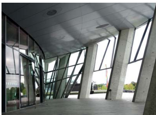
Ryc. 2. UNStudio, Wenzel + Wenzel, Muzeum Mercedes-Benz, Stuttgart, realizacja 2006.

Fig. 1. UNStudio, Wenzel + Wenzel, Mercedes-Benz Museum, Stuttgart, built 2006.