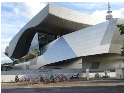
Ryc. 6. Coop Himmelb(l)au, Świat BMW, Monachium, konkurs 2001, realizacja 2007. Fig. 6. Coop Himmelb(l)au, BMW Welt, Munich, competition 2001, built 2007.

Prix opisuje projekt jako zróżnicowaną nadwieszoną strukturę, która jednak nie jest prostopadłościenną salą wystawową, a mimo wszystko nadal spełnia tę funkcję zapewniając zróżnicowane odczucie przestrzeni [9, s. 330–331]. Należy zatem wnioskować, że moty-