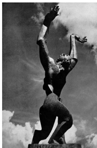
Ryc. 3. Ossip Zadkine, Rozdarte miasto Rotterdam , 1953. Źródło: [13]

Fig. 3. Ossip Zadkine, The Destroyed City , 1953. Source: [13]