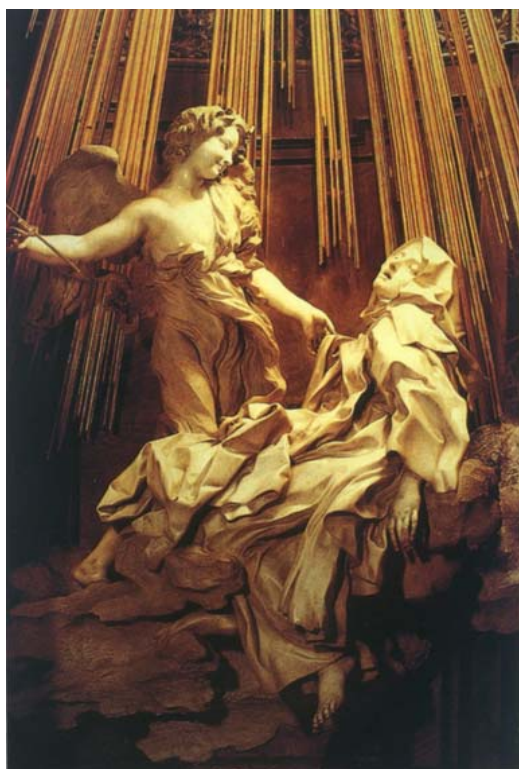
Ryc. 1. Gian Lorenzo Bernini, Ekstaza świętej Teresy , 1647-52.