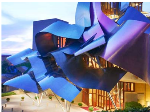
Ryc. 6. Frank Gehry, Marqués de Riscal Hotel , 2006. Źródło: [18]

Fig. 5. Eero Saarinen, Knoll 70 , working model, 1945. Source: [15]