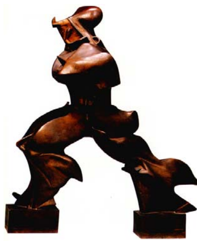
Ryc. 4. Umberto Boccioni, Jedynie formy ciągłości w przestrzeni , 1913 Źródło: [16]

Fig. 3. Ossip Zadkine, The Destroyed City , 1953. Source: [13]