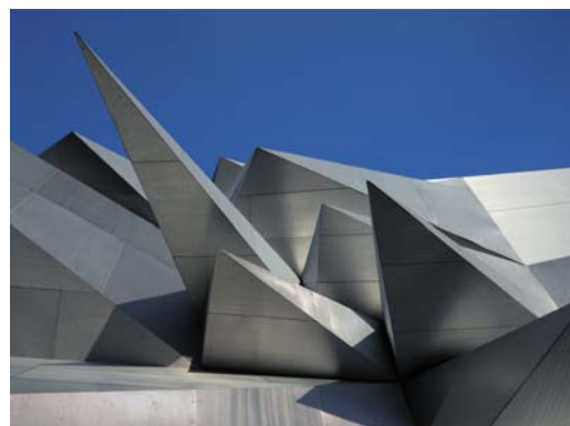
Ryc. 8. Coop Himmelb(l)au, Pavilion 21 MINI Opera Space , 2010.

Fig. 7. Walter Gropius, Monument to the March Dead , 1921.