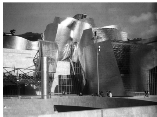
Ryc. 10. Frank O. Gehry, Muzeum Guggenheima , Bilbao, 1997.

Fig. 9. Vladimir Tatlin, Counter-Relief , 1915 (Rekonstrukcja 1989).