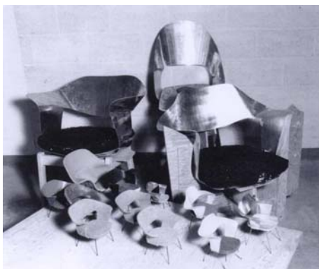
Ryc. 5. Eero Saarinen, Knoll 70 , model roboczy, 1945.

Wydaje się, że borghesowski świat miasta nieśmiertelnych , gdzie wyczerpano wszystkie formy architektury, by trwać w bezruchu, jest przedwczesną alegorią pełnego obrazu ekspresjonizmu architektury najnowszej.