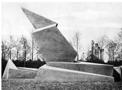
Ryc. 7. Walter Gropius, Pomnik ofiar puczu Kappa , 1921.

Panował pogląd, że wyrazista architektura ekspresjonizmu XXI wieku jest do zaakceptowania, jako wolnostojący obiekt bez sąsiedztwa, lub w otoczeniu neutralnym. Na naszych oczach pogląd ten ewoluje: architektura Decon dobrze się czuje w kontekście historycznym, a zabytkowa architektura rozkwita nowym życiem w takiej sytuacji.