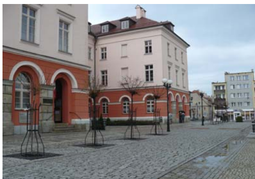
Ryc. 9 . Grodków. Efekty zakończonej w 2010 r. rewitalizacji rynku.

Fig. 8. Grodków. The market square in 1960ties.