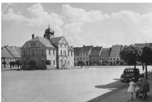
Ryc. 10. Lewin Brzeski. Rynek w latach 60. XX w.

Fig. 9. Grodków. Effects of the market square's revitalization completed in 2010.