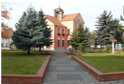
Ryc. 11. Lewin Brzeski. Współczesny obraz rynku o charakterze zielonego skweru z centralnie usytuowanym ratuszem.

Fig. 10. Lewin Brzeski. Market square in 1960ties.