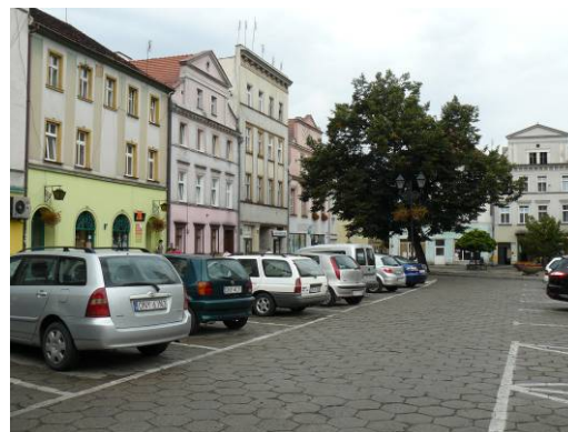
Ryc. 7. Paczków. Układ komunikacyjny rynku wymagający uporządkowania.

Fig. 6. Paczków. Meetings of the inhabitants in the market square.