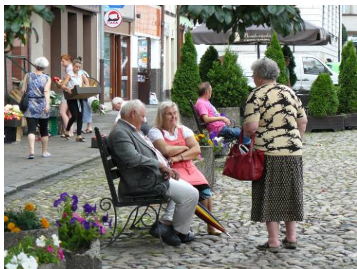
Ryc. 6. Paczków. Spotkania mieszkańców na rynku.

strzeń tych rynków (ryc. 7). Usunięcie ruchu kołowego z placów rynkowych, choć zrazu szokujące, z czasem zyskuje akceptację i docenienie zalet zarówno przez mieszkańców jak i użytkowników lokali [3, s.16].