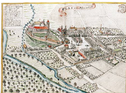
Ryc. 3. Otmuchów. Plan widokowy miasta F.B. Wenera z drugiej połowy XVIII w.

Fig. 2. Paczków. View plan of the town by F. B. Werner from the second half of 18 th century.