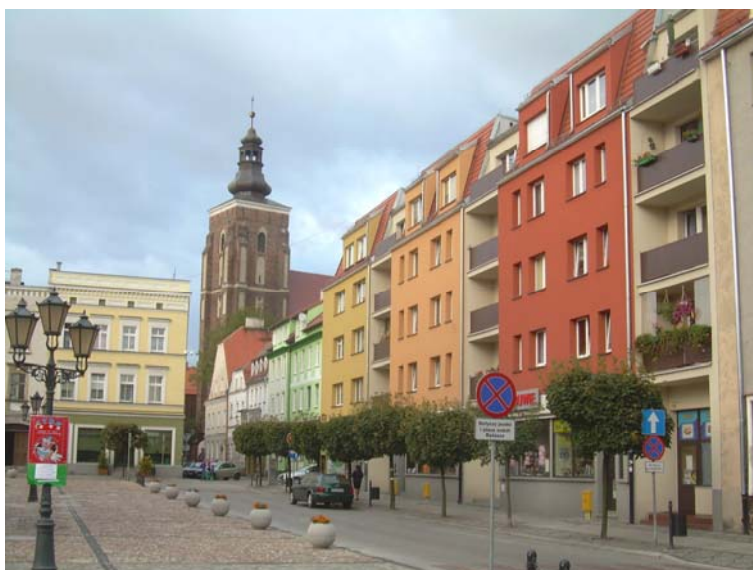
Ryc. 12. Namysłów. Wschodnia pierzeja rynku w 2012 r. Fig. 12. Namysłów. Eastern frontage of the market square in 2012.

Efektom rewitalizacji rynków małych miast województwa opolskiego o średniowiecznym rodowodzie jest atrakcyjna przestrzeń publiczna spełniająca europejskie standardy estetyczne. Poddane remontom historyczne ratusze i zabudowa pierzei rynkowych, nowe, kamienne posadzki rynków, starannie projektowana zieleń, stylizowane elementy małej architektury przywracają dawną rangę „sercu miasta” (ryc. 12). Działania te ponadto sprzyjają ożywieniu funkcji handlowej i turystycznej, mogą stwarzać nowe miejsca pracy. Miejska przestrzeń publiczna o wysokich walorach estetycznych i artystycznych generuje pozytywne doznania oraz przeżycia i przyczynia się do rozwijania kontaktów i budowania więzi społecznych. Na uwagę również zasługują cykliczne imprezy kulturalne i wydarzenia sportowe realizowane z powodzeniem w zrewitalizowanej przestrzeni rynków stanowiąc kontynuację ich dawnej funkcji społecznej.