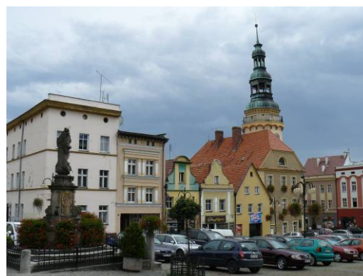
Ryc. 5. Otmuchów. Blok śródrzynekowy, po lewej stronie kolumna maryjna.

Fig. 4. Otmuchów. Modern buildings of the northern frontage of the market square.