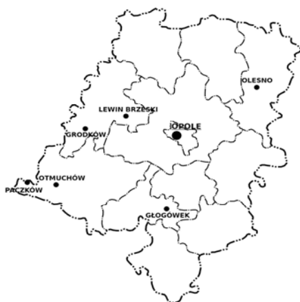
Ryc. 1. Schemat województwa opolskiego ze wskazaniem lokalizacji analizowanych miast.

Do analizy wybrano rynki sześciu małych miast województwa opolskiego o zbliżonej liczbie ludności zawartej w przedziale 5–10 tys. Grupę tworzą w kolejności alfabetycznej: Głogówek, Grodków, Lewin Brzeski, Olesno, Otmuchów i Paczków (ryc. 1). Miasta te należą do czterech z jedenastu powiatów województwa opolskiego: brzeskiego (Grodków, Lewin Brzeski), nyskiego (Otmuchów, Paczków), oleskiego (Olesno) i prudnickiego (Głogówek). Olesno to siedziba powiatu, pozostałe miasta są siedzibami miejsko-wiejskich gmin.