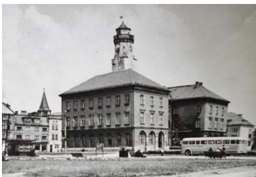
Ryc. 8. Grodków. Rynek w latach 60. XX w.

Indywidualny charakter wnętrzem rynkowym nadają zachowane historyczne elementy zagospodarowania: rzeźby, pomniki i fontanny. Na rynkach w Głogówku, Oleśnie i Otmuchowie znajdują się XVII- i XVIII-wieczne kolumny maryjne. Pomnik św. Jana Nepomucena usytuowany jest na rynku w Oleśnie, w sąsiedztwie kolumny maryjnej. Obok historycznych pomników realizuje się nieliczne nowe w latach 70. XX w. przed ratuszem w Grodkowie odsłonięto popiersie urodzonego w tym mieście Józefa Elsnera. Dwie fontanny na rynku w Otmuchowie, choć obecnie w części przebudowane, utrwalone zostały przez F.B. Wernera na XVIII-wiecznej rycinie.