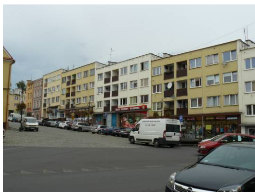
Ryc. 4. Otmuchów. Współczesna zabudowa północnej pierzei rynku.

W strukturze przestrzennej większości historycznych placów rynkowych wyróżniają się ratusze, budowle o indywidualnym i reprezentacyjnym charakterze, historyczne siedziby władz miejskich. Zabudowę śródrzynekową tworzą obok ratuszy w części miast również zespoły kamienic (Paczków, Otmuchów, Kluczbork) (ryc. 5). Jedyne nieliczne rynki woj. opolskiego (Głuchołazy, Olesno, Krapkowice) pozostają bez takiej zabudowy. Ratusze, wielokrotnie przebudowywane i odbudowywane, reprezentują obecnie najczęściej architekturę renesansu, baroku i klasycyzmu 8 (ryc. 5).