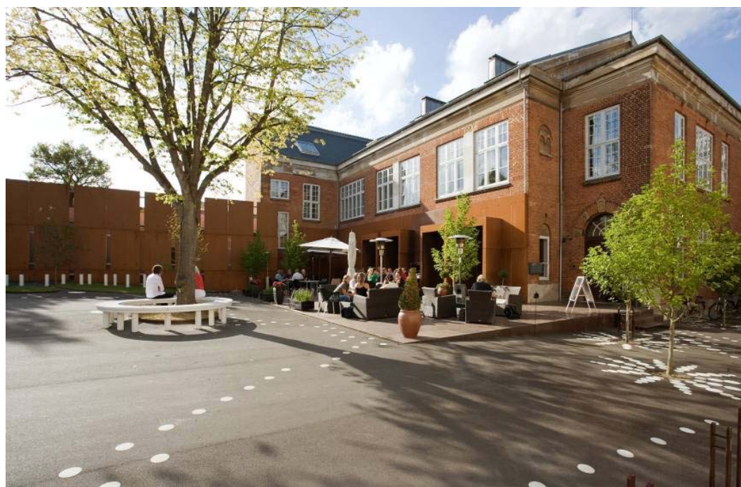
Ryc. 2. Przestrzeń publiczna stworzona wokół kulturalnego centrum Nicolai, Kolding, Dania.

granice placu i wcinia się w sąsiadujące z nim ulice, co ułatwia zbliżającym się do placu orientację, w pewien sposób zapowiada, że już za moment znajdą się w strefie reprezentacyjnej i wyjątkowej.