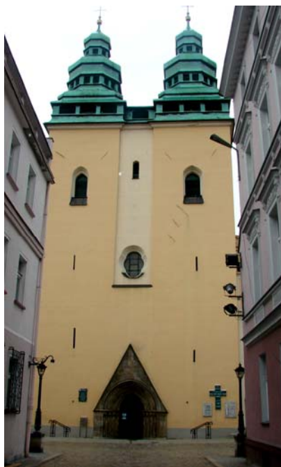
Ryc. 2. Westwerk kościoła św. Wawrzyńca Źródło: fot. H. Rutyna

Fig. 1. Area map with the revitalization of the Old Town area the former suburbs of the lower Głucholazy, according to the Local Revitalization Program in the years 2009-2015; Source: [2].