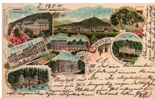
Ryc. 2. Przedwojenna widokówka z budynkami kurortu Bad Ziegenhals.

Fig. 1. Panorama of Glucholazy, print of F.G. Werner of 1729.