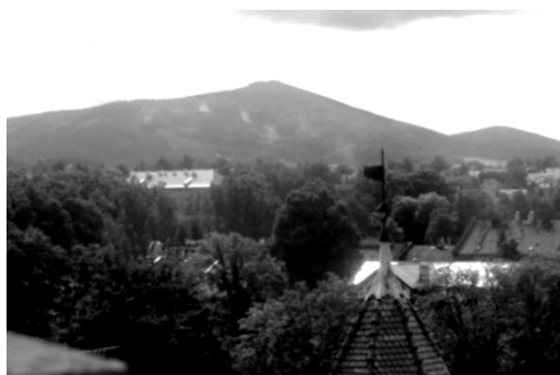
Ryc. 3. Widok na Biskupią Kopę z wieży Bramy Górnej.

W ostatnich latach władze samorządowe Glucholaz energicznie podjęły kilka rewitalizacyjnych przedsięwzięć i wraz z przyjaznymi środowiskami społeczności lokalnej poczęły czynić starania o przywrócenie miastu statusu uzdrowiska. Celem strategicznym, jaki sobie miasto Glucholazy wyznaczyło i uznało za niezbędny do przyjęcia, jest wzrost jego potencjału rozwojowego.