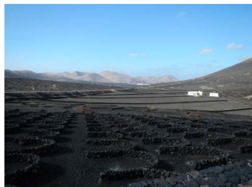
Ryc. 9. Tradycyjny sposób uprawy winorośli. Krzewy są osłonięte od wiatru półokrągłymi murami z kamienia wulkanicznego. Źródło: fot. autorki

Fig. 8. Entrance to the Mirador del Rio, legible reference to cultural rural landscape. Source: Albornoz P., in: Galante F. Mirador del Rio , Madrid, Fundacion César Manrique 2000, p. 91