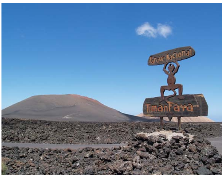
Fig. 5. The devil – the symbol and the logo of The Timanfaya National Park

Punktem kulminacyjnym jest Wysepka Hilarego, jedyne miejsce w granicach parku gdzie turyści mogą się swobodnie poruszać (ryc. 6). Większość terenu jest niedostępna dla odwiedzających. Centralną część można zwiedzać tylko ze specjalnie do tego celu przygotowanych autokarów, które obwożą turystów nieprawdopodobnie wąską drogą, kluczącą między polami lawy. Ograniczenie dostępności i wyeliminowanie turystyki indywidualnej pozwala na efektywną ochronę walorów naturalnych. Jednakże wspomniana Wysepka Hilarego i trasa autobusowa oraz oprawa artystyczna parku są wystarczające dla przeżycia poznawczego i duchowego.