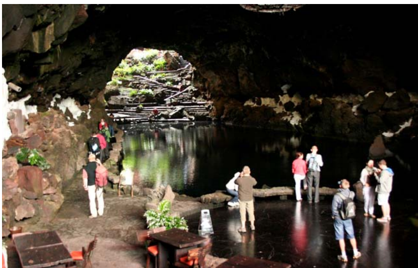
Ryc. 3. Jameos del Agua, harmonia istnienia człowieka i natury, widok na jeziorko zamieszkałe przez endemiczny gatunek kraba.

Jameos del Agua to jedno z pierwszych dzieł artysty na wyspie. Doskonałe zrozumienie zastanych form sprawiło, że jaskinie stały się modelem, który wyznaczał kierunek dalszego rozwoju turystycznego Lanzarote 6 . Model ten zdołał przekonać lokalną społeczność do dalszych działań mających na celu ochronę unikalnego krajobrazu wyspy.