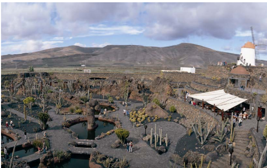
Ryc. 10. Widok z góry na dawne wyrobisko, obecnie Ogród Kaktusów.