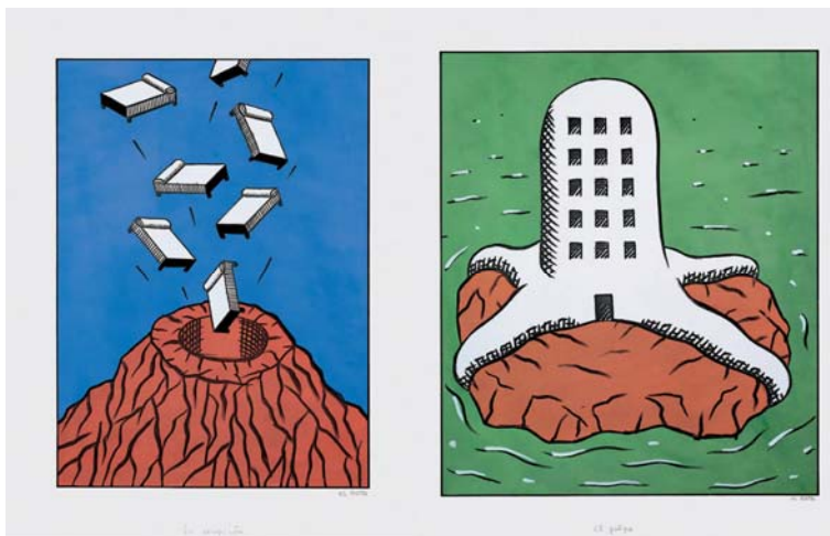
Ryc. 12. „Eruption” i „Ośmiornica” autorstwa El Roto obrazujące kryzys związany z ekspansją turystyczną na wyspie. Źródło: Lanzarote: el papel de la crisis. Fundacion César Manrique 2001, s. 152-153

Fig. 11. A village with the traditional architecture in the centre of the island. Source: author