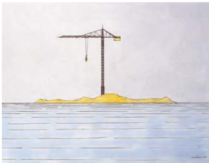
Ryc. 1. „Wieża Babel” satyryczny rysunek autorstwa Maximo. Wizerunek uwidacznia skalę presji inwestycyjnej w stosunku do pojemności wyspy.

Manrique urodził się na wyspie, jednak jego edukacja i wczesny etap twórczości miały miejsce w Europie i w Stanach Zjednoczonych. Powrót w rodzinne strony przypada na pierwszy moment zainteresowania turystycznego białą wyspą. Dzięki jego świadomej i szybkiej interwencji udało się zapobiec nadmiernej ingerencji w krajobraz. Dzieje się to wszystko przy współpracy z lokalną społecznością, którą udaje się przekonać, iż długofalowa strategia ochrony krajobrazu jest bardziej korzystna niż chwilowy wzrost przychodów związany z ożywieniem nowego sektora gospodarki 1 . W 1993 roku Lanzarote zostało włączone do sieci Rezerwatów Biosfery, stając się poligonem eksperymentalnym rozwoju zrównoważonej turystyki przy realizacji programu MAB („Człowiek i biosfera”) 2 . Jest to jedyna z Wysp Kanaryjskich, która wprowadziła narzędzia łączące zarządzanie turystyką z ograniczeniem zmian w użytkowaniu terenu 3 .