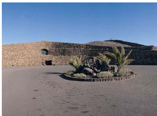
Ryc. 8. Wejście do Mirador del Rio, widoczne nawiązanie do rolniczego krajobrazu kulturowego.

ułożonych kamieni. Podobne formy można oglądać w krajobrazie rolniczym, gdzie każdy pojedynczy krzew winorośli, w celu zabezpieczenia przed wiatrem otoczony jest kamieniem murem (ryc. 9). Punkt widokowy zlokalizowano na stromym, 400 m klifie, ale widok na ocean i sąsiednią wyspę nie jest jedynym, spoglądać można także w kierunku północnym, na wulkan La Corona. Dzięki temu połączeniu udało się w jednym punkcie zawrzeć wszystko, co definiuje Lanzarote 11 .