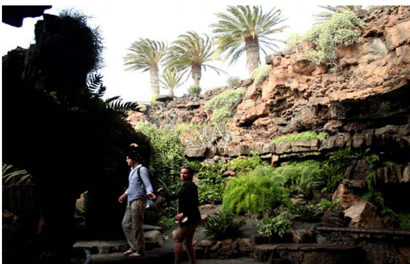
Ryc. 4. Jameos del Agua, surowa skała kontrastuje z bujną kompozycją roślinną.

Fig. 3. The Jameos del Agua, harmony between human and nature, view of the lake settled by endemic crab species.