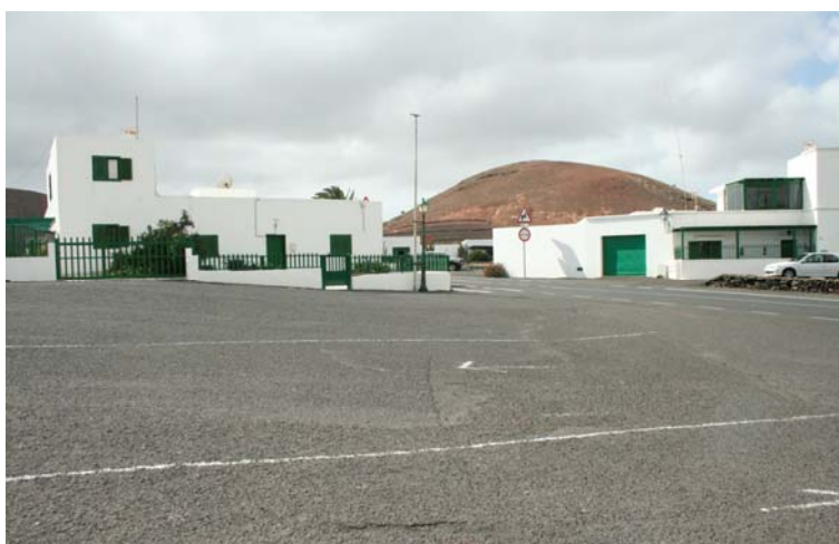
Ryc. 11. Wieś o tradycyjnej zabudowie w centrum wyspy.

krajobraz jest zasobem nieodnawialnym. Swoisty fenomen wyspy, która wbrew powszechnym tendencjom wypracowała model turystyki zrównoważonej ulega poważnym zniekształceniom. Trudno znaleźć odpowiedź na pytanie jak chronić to co najcenniejsze. Być może narzędzia i charyzma Césara Manrique są już nieskuteczne, uległy dewaluacji i trzeba wypracować nowe skuteczniejsze strategie, które będą wystarczające dla przeciwstawienia się nowej fali pustego wizerunku rajów.