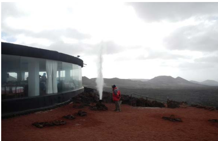
Ryc. 6. Punkt widokowy w parku Timanfaya.

Fig. 6. View point in the Park of Timanfaya.