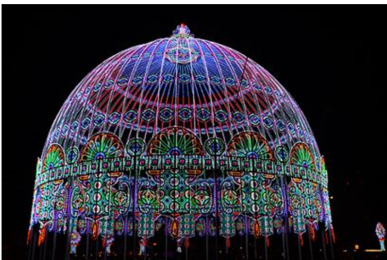
Fot.6. Festiwal Światta w Ghent (Belgia).