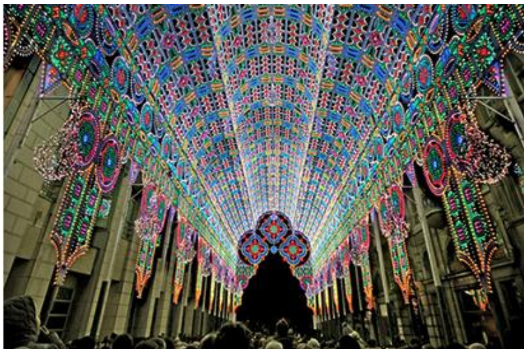
Fot.5. Festiwal Światta w Ghent ( Belgia)

Powyższe stwierdzenie wydaje się dość banalne, ale może przekonujące dla władz miejskich i mieszkańców. Warto zauważyć, że w ostatnich latach rozwój miast w Polsce, podporządkowany jest głównie celom inwestycyjnym. Kształtowanie przestrzeni i krajobrazu ma głównie charakter regulacyjny a nie motywacyjny. Dlatego też organizacja imprez takich jak wspomniane festiwale światła, może przyczynić się do planowania nowych inwestycji, korzystnych nie tylko dla jednostki, ale również dla miasta.