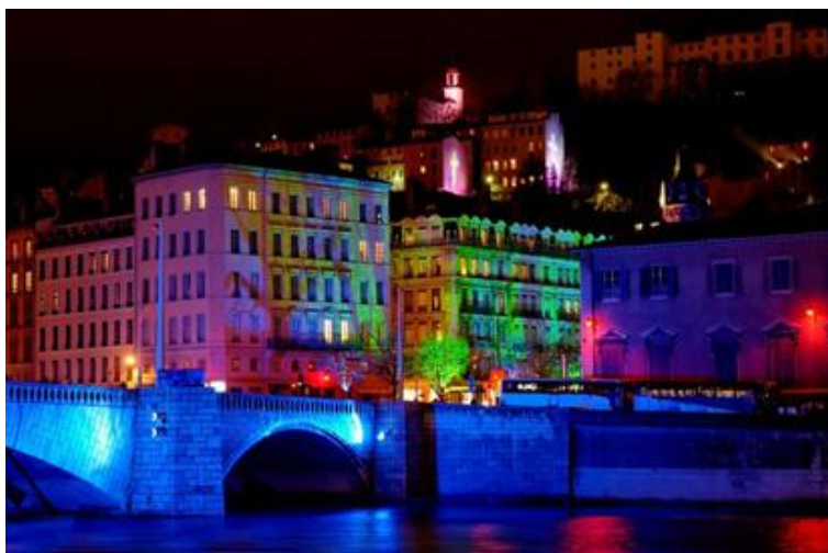
Fig.1. Festival of Lights in Lyon- Fête des Lumières.

Fot.2. Festiwal Światła w Łodzi- Light Move Festival.