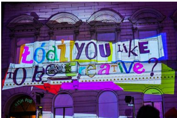
Fig.2. Festival of Lights in Łódź- Light Move Festival

Zyski generowane przez ruch turystyczny podczas imprez są włączane bezpośrednio do lokalnego obiegu gospodarczego. Pierwszą grupę beneficjentów stanowią osoby i podmioty gospodarcze sprzedające swoje usługi turystom tj. właściciele obiektów noclegowych, gastronomicznych, środków transportu, urządzeń rekreacyjnych, rozrywkowych, handlowych. Drugą grupą czerpiącą korzyści z festiwalu to artyści, bowiem jednym z głównych założeń festiwalu jest wspieranie i promowanie artystów lokalnych. Bezpłatne koncerty, przedstawienia czy wernisaże są dostępne dla każdego, dzięki czemu młodzi artyści mają szansę na promocję. Warto również wspomnieć, że duży udział w organizacji tego typu wydarzeń w mieście mają sponsorzy- głównie firmy oświetleniowe. Sponsoring, bowiem, jest jednym z najbardziej wyrafinowanych narzędzi wspierających wizerunek miasta. Sponsoring jest relacją partnerską, w wyniku, której obie strony- miasto jak