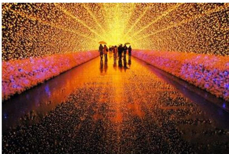
Fot. 4. Zimowy Festiwal Światła w Kuwanie w Japonii Fête

Fig. 3. Winter Festival of Lights in Kuwana (Japan).