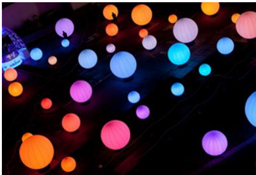
Fot.10. Instalacja świetlna na Festiwalu Światła w Durham.

Fig. 9. Light sculptures in the city center in Peru.