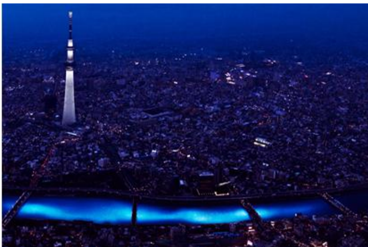
Fot.7. Hotaru Festiwal w Tokio.

Fig.7.Hotaru Festival in Tokyo.