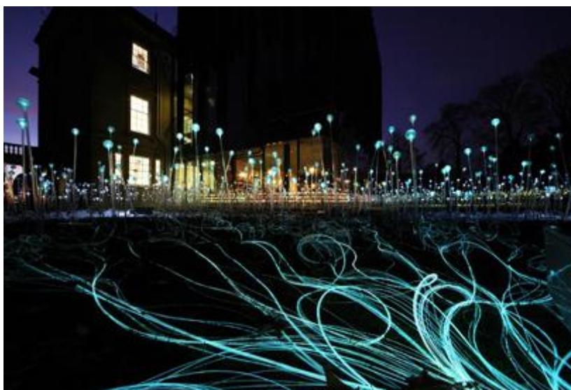
Fig.10. Light sculptures on the Durham Light Festival.