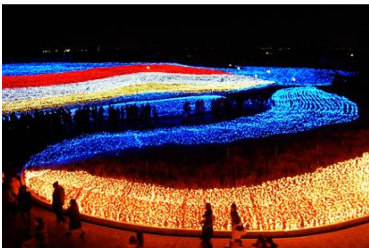
Fot. 3. Zimowy Festiwal Światła w Kuwanie w Japonii Fête

również formy oświetleniowe czerpią określone korzyści. Sponsorzy, przekazując na rzecz miasta środki finansowe, oczekują w zamian możliwości wykorzystania i reklamy swoich produktów w przedsięwzięciu. Do zobrazowania tego zjawiska może posłużyć przykład z Łodzi, gdzie jednym z inicjatorów festiwalu światła o nazwie „Light Move Festival” była jedna z czołowych firm oświetleniowych na polskim rynku. Oprócz prezentacji swoich najnowszych produktów, celem sponsora było uświadomienie mieszkańcom Łodzi możliwości wykorzystania najnowszych technologii oświetleniowych do wizualnej poprawy wyglądu miasta. Podczas trzech dni trwania łódzkiego festiwalu zostało podświetlonych trzydzieści kamienic. Koszty zużycia energii elektrycznej w tym czasie wzrosły o ok. 100 zł. Co oznacza że dzienny koszt iluminacji jednej kamienicy wynosi poniżej dwóch złotych. Całoroczna iluminacja trzydziestu kamienic w centrum miasta kosztowałaby Łodzian ok. 12 tys. złotych.