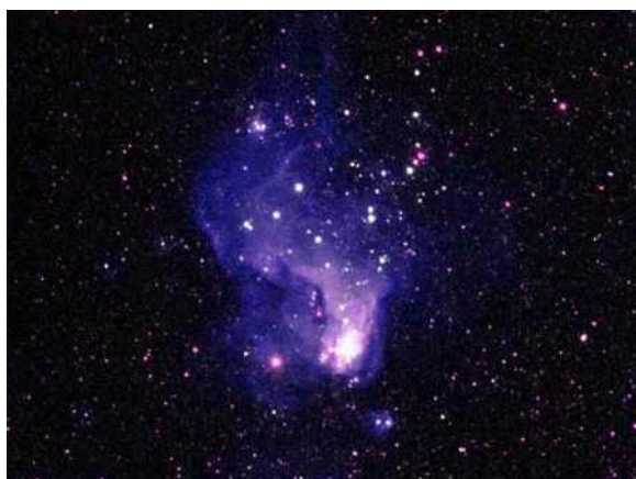
Ryc. 1. Kosmos Fig. 1. Cosmos

Wychodząc z powyższej idei, należy stwierdzić, że w materialnie otaczającej rzeczywistości nie istnieje pojęcie braku przestrzeni . Nawet idealne zetknięcie dwóch doskonale gładkich ciał fizycznych zawiera w sobie oddzielające pojedyncze atomy z orbitami elektronów.