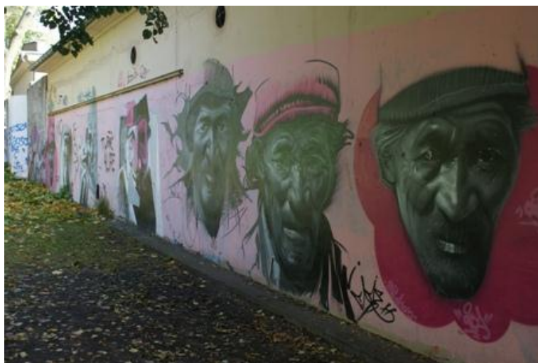
Ryc. 9. Próba zdefiniowania miejsca, Źródło: il. R. Łucka Fig. 9. Attempt to define of the place, Source: R.Łucka

W codziennej percepcji rzeczywistości kody DNA i odciski palców są niezauważalne. Dostrzegane są odciski stóp na śniegu, na piasku i na wilgotnej ziemi oraz ślady narzędzi pozostawione na tworach natury i artefaktach. Poprzez takie zdarzenia przestrzeń świadomie lub też przypadkowo zostaje oznaczona. Zawarty w niej jest komunikat, który zawiera w sobie jednoznaczne, ugruntowane społecznie informacje techniczne ( odcisk stopy), oraz hipotetyczne, poetyckie kody zabarwione często nurtem irracjonalnym ( odcisk stopy kobiety lub dziecka, a może karła, wiedźmy, wampira itp.) Świadome piętno w przestrzeni pozostawili już ludzie pierwotni na ścianach jaskiń. Mechanizm ten kontynuują Aborygeni sygnując kamienne ściany śladami swych dłoni.