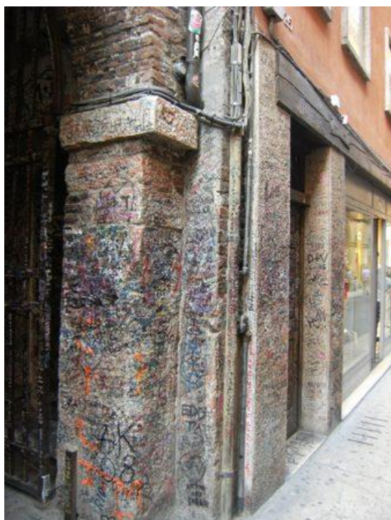
Ryc. 10. Graffiti – dom Capelettich Fig. 10. Graffiti - Capulettich's house

Wszelkiego rodzaju nazwy ( np. ulic, placów, mostów, obiektów architektonicznych), reklamy i napisy są także mechanizmami osadzonymi w zjawisku sygnowania przestrzeni. Inaczej jednak podchodzi się do odczytu form tekstowych i graficznych, inaczej do percepcji przestrzeni wypełnionej formą kubaturową. Architekturę najczęściej „wchłania” się bezwiednie, chyba, że mamy do czynienia z wyjątkowym dziełem podlegającym wnikliwej analizie dokonywanej przez podmiot, który znalazł się w obszarze jej oddziaływania.