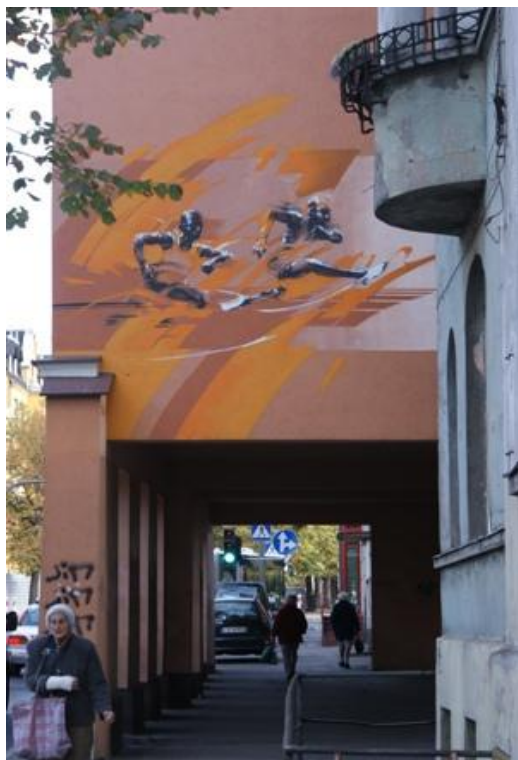
Ryc. 7. Przestrzeń zdynamizowana. Fig. 7. Boosted space

Jedna z definicji mówi, że „Kultura stanowi organizację przedmiotów ( narzędzi, różnego rodzaju sprzętów, przedmiotów rytualnych, dzieł sztuki itd.), czynności ( wzorów zachowania, zwyczajów, ceremoniałów, instytucji), idei ( przekonañ, wiedzy, ludowej mądrości) i sentymentów ( uczuć i postaw) uzależniona od swoistego posługiwania się symbolami. Symbol zaś to tyle, co jakaś rzecz – przedmiot, czynność, barwa itd. – której znaczenie nadają ci, którzy się nią posługują.” 5 Osadzony w obszarze danej kultury przekaz zawiera w sobie jednostkowe, techniczne informacje, które potrafią być wzbogacane o wielowarstwowy odczyt bazowych - pojedynczych znaków, a dalej, symboli i bardzo złożonych kodów, które zrodziły się z percepcji obrazów graficzne i form przestrzennych.