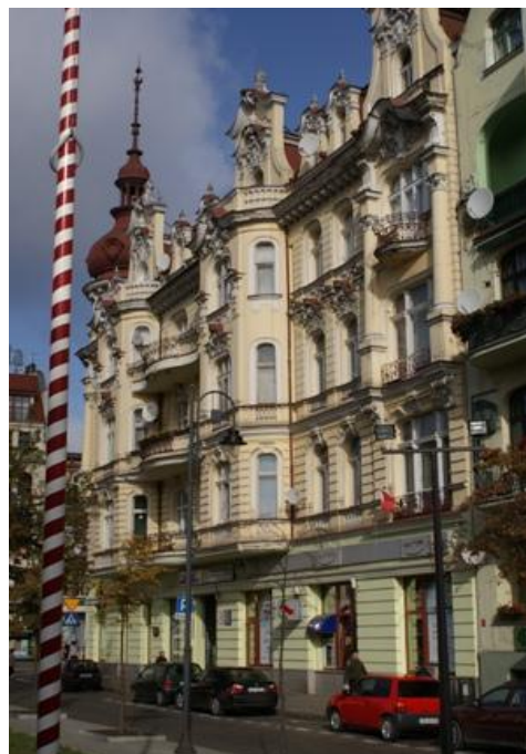
Ryc. 4. Znaki w mieście Fig. 4. Signs in the town

W przypadku treści graficznych i przestrzennych nieodzowna jest świadomość podmiotu, który znalazł się w wizualnym obszarze oddziaływania przedmiotu poddanego procesowi