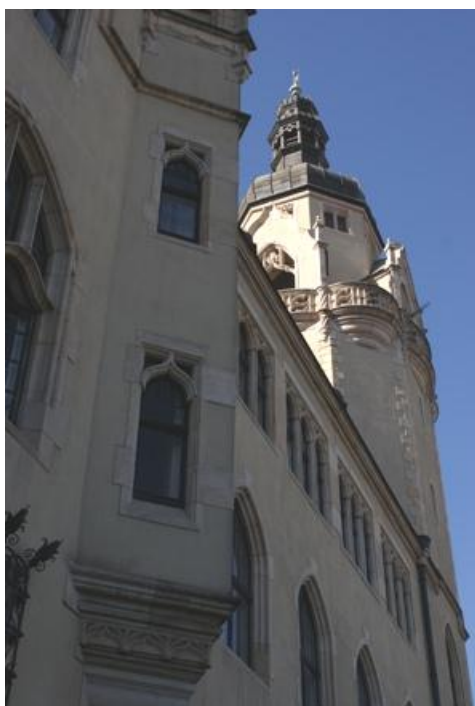
Ryc. 6. Symbol władzy Fig. 6. Symbol of power

Kody odczytywane są w jednoznacznie uwarunkowany czynnikami społecznymi sposób, który często jest wzbogacony elementami poetycko- hermeneutycznymi, których zasięg każdy podmiot nosi w sobie. „ Istnieją zatem kody techniczne, których funkcją jest odsyłanie do racjonalnego doświadczenia, oraz kody poetyckie, których funkcja jest stwarza-