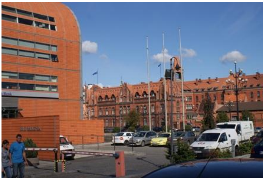
Ryc. 12. Krajobraz miejski