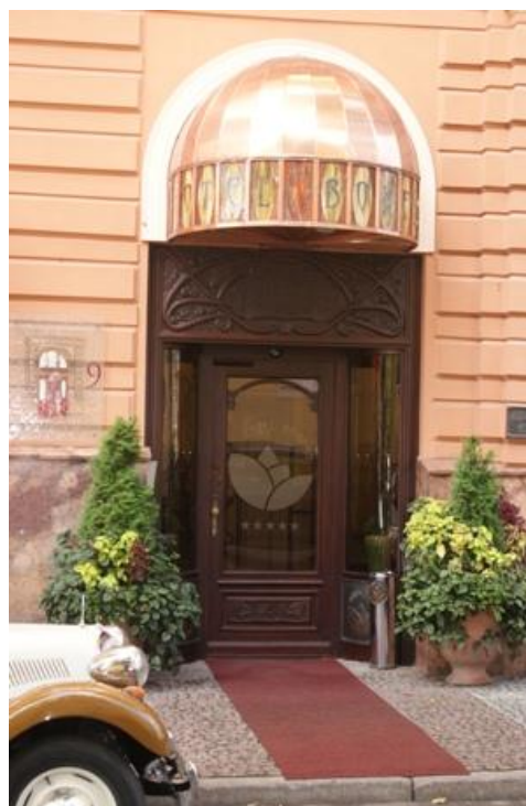
Ryc. 11. Wchłonięcie podmiotu, Źródło: il. R. Łucka Fig. 11. Absorption of the subject, Source: R.Łucka

Architektura także „zawłaszcza” odbiorcę wielowarstwowością swego przekazu ulegającego, w miarę upływu czasu, kolejnym odsłonom.