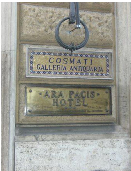
Ryc. 5. Szyldy, Źródło: il. R. Łucka Fig. 5. Signs, Source: R.Łucka