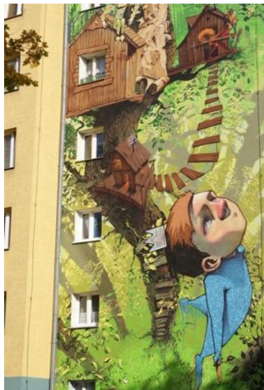
Ryc. 8. Substytut tożsamości, Źródło: il. R. Łucka Fig. 8. Substitute of identity, Source: R.Łucka

Wszystkie te komunikaty złożone z odczytanych treści, zawiera się w jednym słowie – semiologia, czyli nauka, która bada zjawiska kulturowe traktując je, jako systemy znakowe. Taka rzeczywistość pojmowana jest, jako obszar permanentnej komunikacji, która odbywa się za pomocą znaków i ich złożonych konfiguracji zrodzonych na styku przedmiot – podmiot. Wszelkie przejawy działalności człowieka posiadają w zawarte w sobie komunikaty, które podlegają zindywidualizowanemu odczytowi.