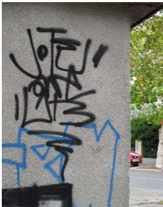
Ryc. 3. Sygnowana ściana Fig. 3. Signed wall

W omawianym powyżej mentalnym, sztucznie stworzonym, immanentnym obrazie przestrzeni, znakiem jest posiadający swoją jednostkową nazwę, nadaną przez podmiot, przedmiot poddany percepcji. Tradycyjna nazwa znaku reprezentuje jakieś znaczenie, implikuje określoną ontologię znaczenia. Znakiem jest to, co istotne dla doświadczenia rzeczywistości przez określony podmiot lub grupę społeczną. ”Kiedy pytamy o znaczenie jakiegoś znaku, rozumiemy coś, jako znak, a przez to również coś z niego, ale nie całe jego znaczenie. Pytamy wówczas o znaczenie. /.../ Można zatem również powiedzieć: Znak, który rozumiemy bez pytania o jego znaczenie, jest znaczeniem. Różnica między znakiem a znaczeniem wypływa z braku rozumienia.” 2 Podstawowym elementem każdej kultury jest umiejętność posługiwania się znakami, w szczególności znakami słownymi. Nieodzowne jest wówczas, aby twórca i odbiorca znaku posiadali tę samą świadomość jego znaczenia. Prawidłowość ta dotyczy każdego kulturowego przekazu.