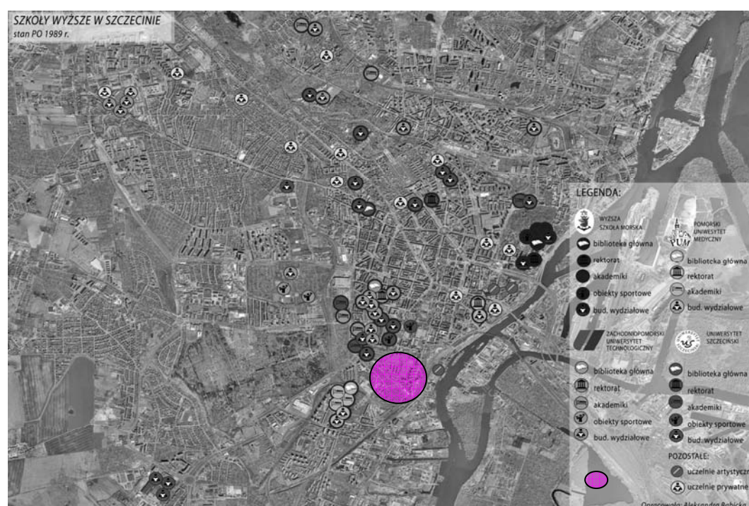
Ryc. 1. Rozlokowanie obiektów wyższych uczelni w Szczecinie

rynarza przy ul. Malczewskiego i t.p. Już tylko te dwie lokalizacje są dowodem na wcześniejszą postawioną tezę, że brak jest w mieście i w środowisku akademickim Szczecina wizji na zintegrowanie przestrzenne uczelni w mieście. Jeśli nadal będziemy tak postępować, że władze miasta będą oddawały obiekty, na które brak będzie innych pomysłów, a uczelnie będą je przyjmowały bez względu na to, gdzie one są zlokalizowane, to z pewnością nie zostanie zbudowany silny ośrodek akademicki o ciekawym i bogatym życiu akademickim. W średniej wielkości ośrodku akademickim niezbędne jest skupianie i integracja funkcji akademickich w przestrzeni miasta.