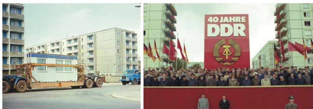
Ryc. 3. Transport prefabrykatów wielkopłytowych w osiedlu mieszkaniowym w Karl-Marx-Stadt (początek lat 70.) – po lewej oraz uroczystości z okazji czterdziestolecia utworzenia Niemieckiej Republiki Demokratycznej; w tle wielkopłytkowa zabudowa mieszkaniowa przy Karl-Marx-Alle (WBS70/80) – po prawej.

Fig. 3. Transportation of building panels to settlement in Karl-Marx-Stadt (beginning of 70s) – on the left side, and celebrations of 40 Anniversary of raising the German Democratic Republic; in the background panel housing at Karl-Marx-Alle (WBS70/80) – on the right side.