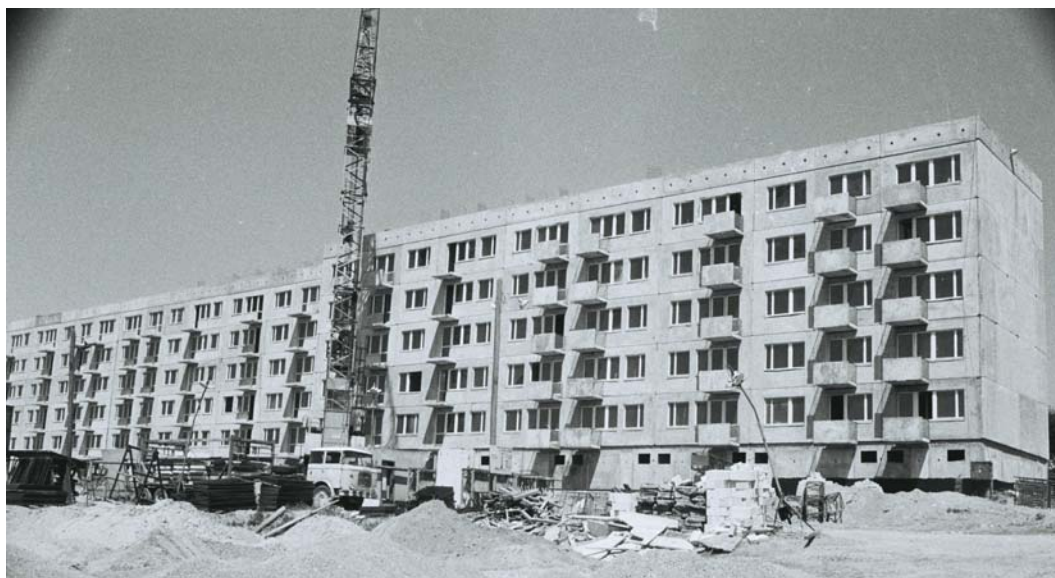
Ryc. 2. Budowa pięciokondygnacyjnego budynku mieszkalnego w technologii Wk-70 w Osiedlu Arkońskim w Szczecinie (1974).

Jednak wyniki Konkursu na otwarty system budownictwa mieszkaniowego , między innymi wskutek braku mocy wiążącej, w nieznacznym stopniu wywarły wpływ na ograniczenie ich ogólnej ilości. W dalszym ciągu stosowano poddane licznym modyfikacjom systemy: WWP, OWT-67/75 i WUF-T. Niewątpliwie umożliwiło to zróżnicowanie rozwiązań architektonicznych i nadanie im cech lokalnych, ale podobnie jak w połowie lat 60. stało na przeszkodzie zracjonalizowania kosztów inwestycyjnych. Wydaje się, że kluczową rolę odegrał w tym wypadku wzmożony napływ kapitału zza granicy 11 .