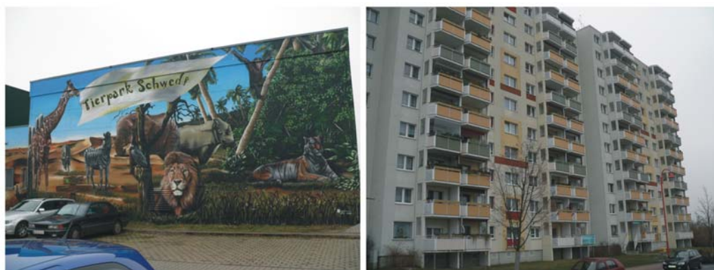
Ryc. 5. Kein Ort zum sterben – żadne miejsce nie jest nudne. „Bezładne miasto” – Schwedt nad Odrą (2010). Zabudowa przy ulicy Róży Luksemburg.

Wielka płyta przetrwała prawie cztery dziesięciolecia mimo iż niewiele racjonalnych argumentów przemawiało za jej zastosowaniem. Jakby tego było mało w niektórych krajach stała się wręcz ikoną nowoczesnego mieszkalnictwa. Obecnie w wielu krajach Europy i Stanach Zjednoczonych z wielkopłytowych elementów drewnianych wznoszone są jednorodzinne budynki, a w zjednoczonych Niemczech niezwykle prężnie rozwija się budownictwo z wielkoblokowych elementów ceramicznych.