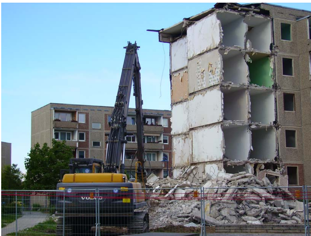
Ryc. 4. Wyburzanie budynków wielopłytowych w Bergen-Rotensee na Rugii (2006).

Wielka płyta doprowadziła do całkowitego przekształcenia krajobrazu miast w Europie. Związane z nią przemiany kulturowe i obyczajowe trudno dziś jednoznacznie ocenić, a w szczególności zanegować. Dlatego w Polsce kres wielkiej płyty nastąpił dopiero w chwili całkowitej dekapitalizacji bazy wytwórczej i wyczerpania zapasów prefabrykatów (1995). Z kolei w obu państwach niemieckich decyzję o zaniechaniu jej stosowania podjęto po ujawnieniu nieprawdopodobnej skali degradacji środowiska naturalnego i zbudowanego na wschód od Łaby (1991). W ślad za tym porzucono ciężką prefabrykację we Francji (1993).