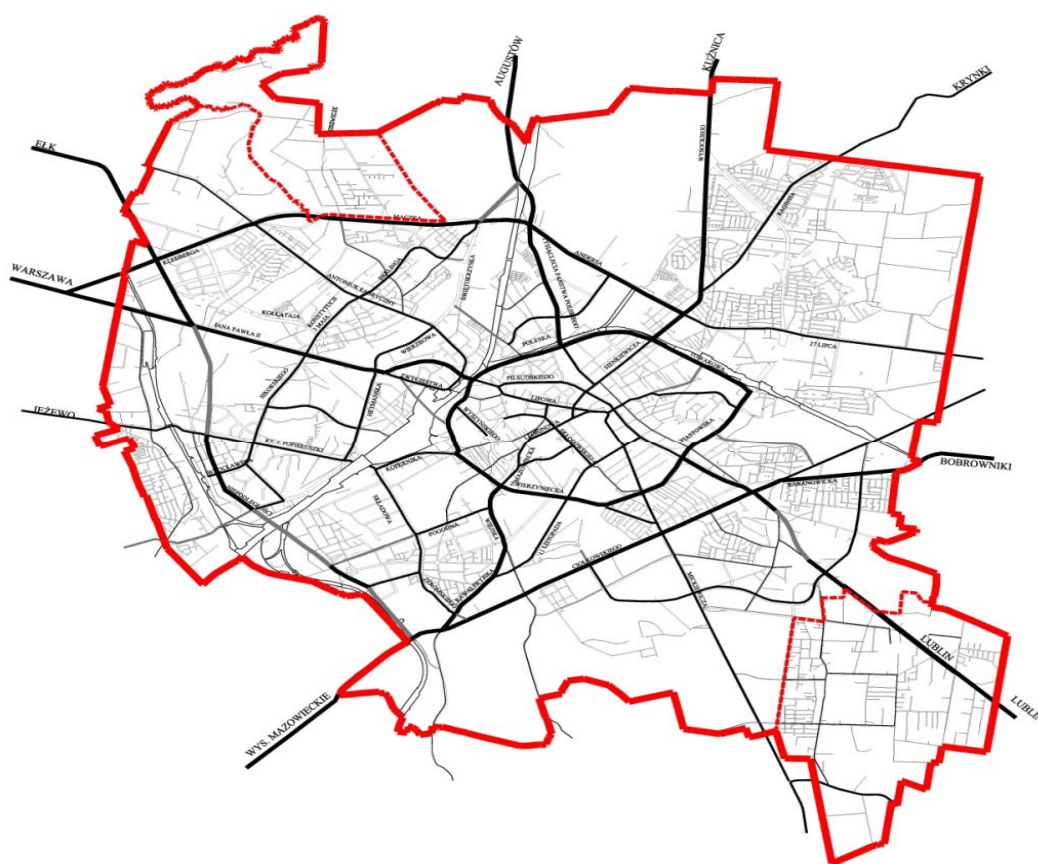
Ryc. 2. Białystok – obecne granice administracyjne z obszarami przyłączonymi (Zawady, Dojlidy). J. Tokajuk 2011

Również, ze względu na zmianę granic administracyjnych, utraciły moc plany miejscowe sporządzone po 1995 roku, jak i studia uwarunkowań i kierunków zagospodarowania przestrzennego. Wynikało to z interpretacji prawnej opartej na doktrynie wskazującej, że derogacja aktów prawa lokalnego jest następstwem konkretnie określonych zdarzeń, takich jak m.in. okoliczność prowadząca do zmiany terytorium, na którym obowiązuje dany akt prawny. Uznano więc, że plany miejscowe obowiązujące wcześniej na obszarze włączonym do granic miasta tracą moc, gdyż są prawem obowiązującym jedynie na obszarze danej gminy w ramach kompetencji i woli jej organów, co także wynika z art. 87 ust. 2 Konstytucji Rzeczypospolitej Polskiej.