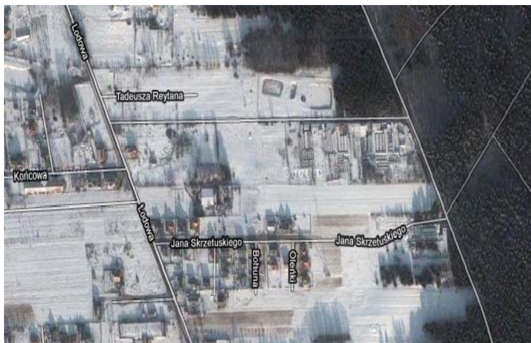
Ryc. 3. Obszar dawnej wsi Zawady - stan obecny. Google maps 2011

terenów, ani innych możliwości prawnych pogodzenia sprzecznych interesów, wynikających z przepisów szczególnych – np. ustawy o ochronie gruntów rolnych i leśnych, kodeksu cywilnego, ustawy o ochronie środowiska czy z prawa miejscowego np. regulaminu utrzymania czystości i porządku na terenie miasta, podjęto próbę rozwiązania konfliktu w oparciu o prawo miejscowe tj. poprzez miejscowy plan zagospodarowania przestrzennego.