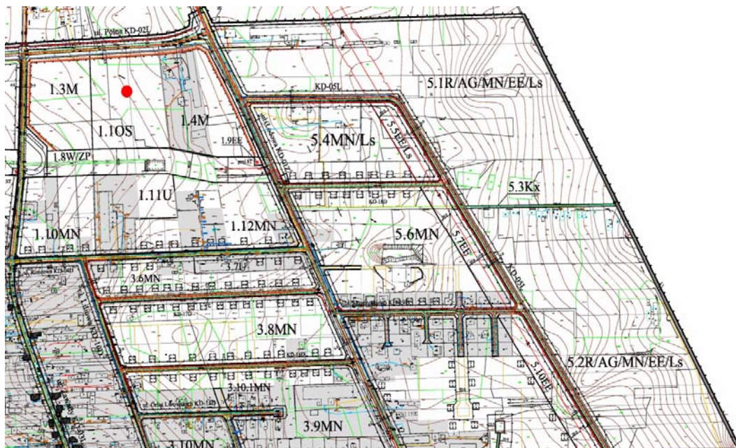
Ryc. 4. Rysunek planu miejscowego (uchwała LVII/675/06 Rady Miejskiej Białegostoku 2006)