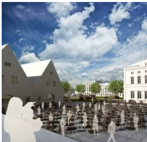
Ryc. 11. Pracownia rzeźby pod gołym niebem Fig11. Laboratory of sculptures under the open sky.