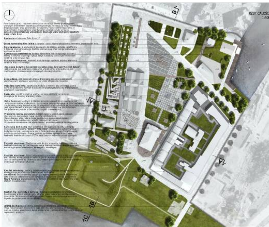
Ryc. 13. Rzut całości założenia. Fig. 13. Masterplan.