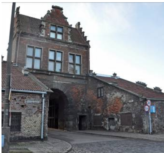
Ryc. 3. Brama Nizinna widziana od strony północnej.

Ilustracją dla takiego myślenia jest nagrodzona 11 konkursowa koncepcja dla Placu Wałowego w Gdańsku 12 . Projekt ten zakłada uczytelnienie manierystycznego charakteru wnętrza urbanistycznego, regenerację jakości przestrzeni publicznej i jej krajobrazową adaptację na scenę dla dziania się życia, wprowadzenie aktywatorów kulturalnych i pobudzenia społecznego, a wszystko to wyrastające z kontekstu przestrzennego, lokalnych tradycji i specyficznego genius loci .