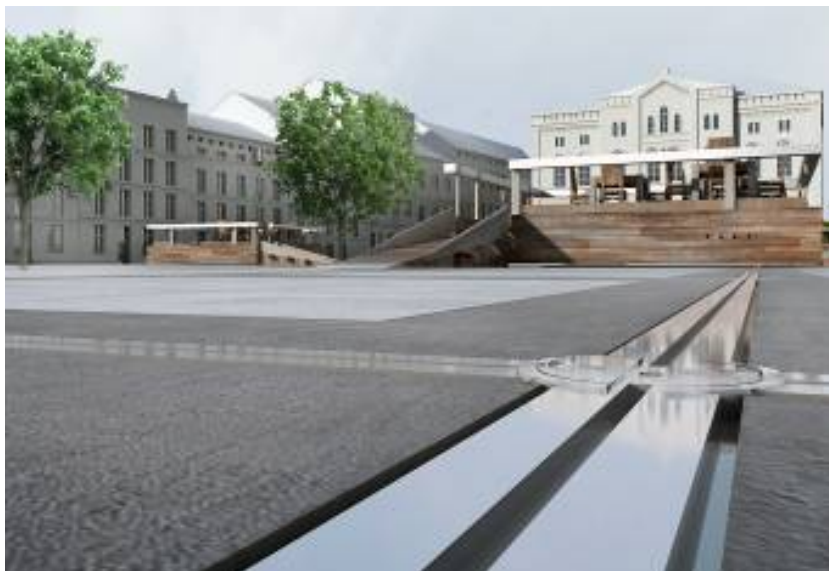
Ryc. 6. Rysunek nawierzchni tworzony przez siatkę szyn będących osnową dla mobilnych platform.

Fig. 6. Figure surfaces created by the network of rails which are matrix for mobile platforms.