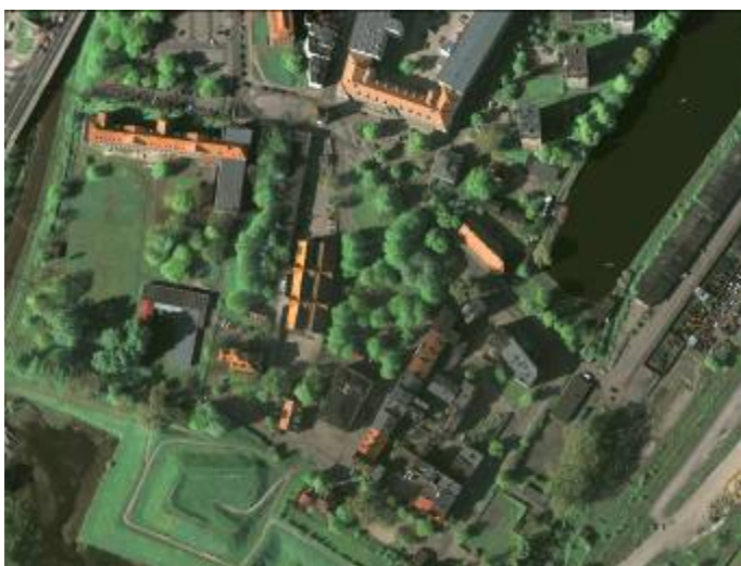
Ryc. 1. Rejon Placu Wałowego na zdjęciu lotniczym.