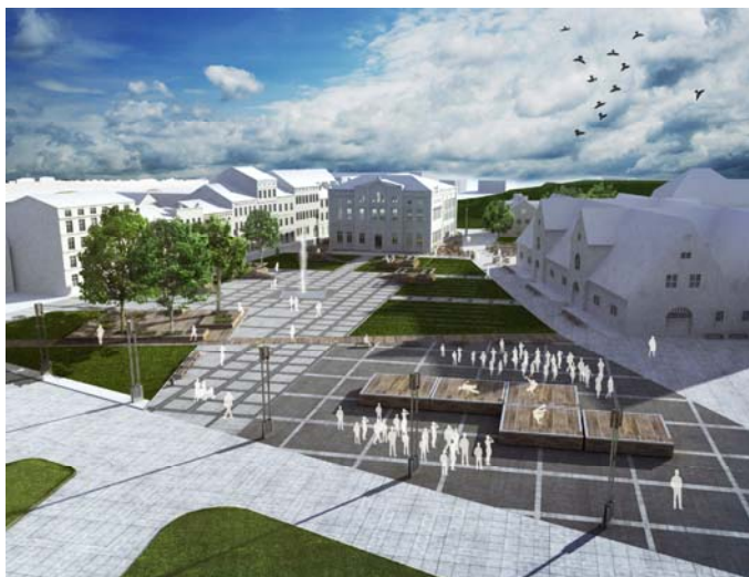
Ryc. 7. Widok Placu Wałowego z lotu ptaka.