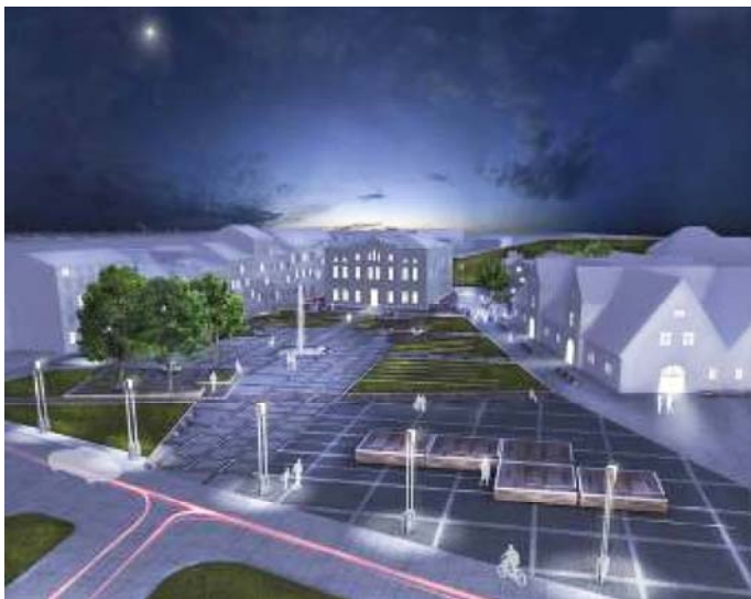
Ryc. 8. Nocny widok Placu Wałowego z lotu ptaka

Płaszczyzna podstawy placu została pokryta delikatną siatką szyn tworząc tym samym subtelny rysunek nawierzchni ale przede wszystkim osnowę dla mobilnych platform (il.6). Pomysł na system szyn i zestawialnych platform wywodzi się ze skojarzeń z krajobrazem portowym i fortecznym. Platformy jak drewniane skrzynie przesuwane niegdyś na terenie portu po rozładunku, czy też skrzynie ze sprzętem wojskowym przenoszone na placu przed zbrojownią, są teraz elementem modyfikowalnej aranżacji placu. Użytkownicy mogą przemieszczać platformy i zestawiać je zależnie od potrzeby. Raz platformy zsunięte na środek placu są sceną widowiskową lub parkietem tanecznym, innym razem stają się wybiegiem mody, kiedy indziej swobodnie rozsunięte są intymnymi gabinetami ze stolikami gdzie pijąc herbatę przyglądamy się pracy siedzącego opodal malarza, albo są przestrzenią czasowej wystawy artystycznej.(il. 7 i il. 8) Atrakcyjne, mobilne i w pełni adaptowalne wyposażenie placu daje szansę na podniesienie jego rozpoznawalności, czyniąc go atrakcyjnym celem (il.9). Platformy na stalowych kołach mimo swojego ciężaru można śmiało pchnąć w przód po szynach, tak ja proces rewitalizacji ma szansę pchnąć Plac Wałowy w czas jego ponownej świetności. Pojedyncza platforma jest drewnianym kwadratowym podestem o boku 6m i wysokości 1m. Aby udostępnić platformę możemy korzystając z ukrytych wewnątrz mechanizmów w łatwy sposób przystosować ją jak na ilustracji nr 10.