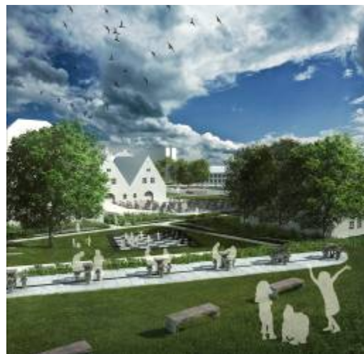
Ryc. 12. Kąpielisko szachowe; miejsce aktywizacji. Fig12. Chess area; activation place.