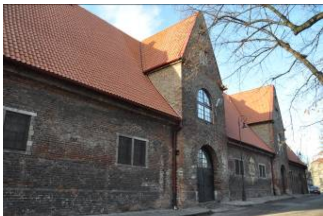
Ryc. 4. Gmach Małej Zbrojowni, powstały w latach 1643-1645 pierwotnie pełnił funkcje militarne, obecnie jest siedzibą gdańskiej Akademii Sztuk Pięknych. Stanowi istotny element w kompozycji urbanistycznej Placu Wałowego.

Fig. 3. Nizinna Gate seen from the North.