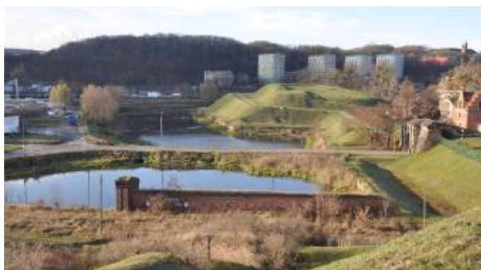
Ryc. 2. Bastion św. Gertrudy widziany od strony bastionu Żbik Źródło: il. : K. Jakubowski

Piękno i atrakcyjność przestrzeni miejskich może wynikać nie tylko z układu i jakości form je tworzących, ale także z ludzi czyli mieszkańców i potencjału jaki mogą wnieść do miasta. Dzieje się tak ponieważ człowiek będąc twórcą krajobrazu jest w istocie także jego elementem. Kreacja odbywa się na zasadzie łączenia czynnika przyrodniczego i kulturowego, w których wizualizuje się aktualny stan umysłu i kondycja ducha społeczeństwa. Bycie człowieka elementem krajobrazu jest tym ważniejsze, że człowiek będący w polu widzenia, oddziałuje na zmysły silniej niż inne nieożywione elementy 6 . Podkreślanie roli ludzi w przestrzeni publicznej zajmuje się Jan Gehl. Przywołuje on skandynawskie powiedzenie, że „ludzie przychodzą tam gdzie są ludzie” i sama obecność innych daje szansę zaistnienia relacji lub zdarzeń 7 . Miarą witalności przestrzeni miejskich jest więc człowiek. Jego obecność nadaje przestrzeni miasta sens oraz wymiar estetyczny. Dobrze jest, kiedy próby odnowy krajobrazu miejskiego nie ograniczają się jedynie do zabiegów konserwatorskich czy też estetyzacji przestrzeni ale prowadzą do wytworzenia się warunków dla indywidualnego i społecznego rozwoju oraz rzeczywistego ożywienia przestrzeni miasta tak, aby uroda miasta idąc w parze z użytecznością przestrzeni przyczyniała się uzyskania stałego efektu ożywienia 8 .