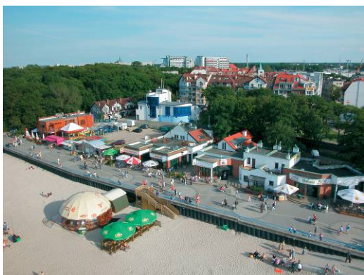
Il. 3. Kołobrzeg – widok z lotu ptaka na chaotycznie i przypadkowo rozbudowującą się część promenady. Stan z 2006 r.

rycznego porządku przestrzennego założeń kuracyjnych nie jest bowiem jedynie konsekwencją zniszczeń wojennych, które na tym obszarze nie były znaczne. W dużo większym stopniu jest wynikiem powojennej zmiany uwarunkowań społecznych, braku chęci, umiejętności oraz potrzeby podmiotowego potraktowania zastanej zabudowy wybrzeża i tak zwanych ziem odzyskanych. Spowodowało to ogromną dekapitalizację zabudowy kurortów, a degradacja wartości krajobrazowych tych założeń jest zjawiskiem stale postępującym. Jedną z przyczyn może być to, iż po ostatniej zmianie ustrojowej nie skonfrontowano stanu przestrzennego uzdrowisk z zawartym w nich potencjałem kulturowym. Stan krajobrazu kulturowego odzwierciedla również aktualny i powszechny poziom kultury architektonicznej i przestrzennej w Polsce (il. 3, il. 4). Istnieje zatem pilna potrzeba nakreślenia w tej tematyce wspólnych obszarów zainteresowań środowisk architektonicznych i kulturoznawczych oraz dokonania ich przełożenia na zastosowanie w praktyce.