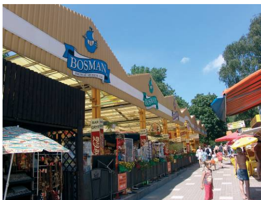
Il. 4. Świnoujście – zespół pawilonów gastronomicznych z początku lat 70. XX w., zlokalizowanych na wydmach przy promenadzie. Stan z 2006 r.

Pic. 3. Kołobrzeg – aerial view to chaotic and random development of the promenade, picture from 2006.