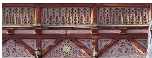
Il. 5. Międzyzdroje – fragment ryzalitu drewnianej willi przy ul. 1000-lecia 21 z zachowaną laubzegową snyderką (stan 2006 r.)

Przyglądając się współczesnym miastom polskim, komentując programy odnowy przestrzeni urbanistycznych, stajemy się (bardziej lub mniej świadomie), uczestnikami współczesnej dyskusji dotyczącej tożsamości 9 . Wprowadzona w Polsce zmiana systemu bardzo mocno naruszyła kulturową sferę życia, a w jej obrębie tożsamości społecznej człowieka i przestrzeni, w której żyje. Gwałtownie wprowadzone reformy gospodarcze i polityczne wymusiły zmianę dotychczasowych zachowań społecznych. W Polsce w zauważalny sposób na pierwszy plan wysunęły się agresywne zachowania oparte na prawach rynku 10 . Dla zrównoważenia zaistniałej sytuacji niezbędne wydaje się wykształcenie nowych postaw społecznych opartych na współpracy i prowadzących do poprawy jakości przestrzeni. Chodzi tutaj przede wszystkim o konieczność zrozumienia zasad funkcjonowania otaczającego nas środowiska poprzez podjęcie trudu zrozumienia siebie samego 11 . Choć umiemy krytycznie oceniać stan przestrzeni nie zawsze potrafimy jasno definiować wartości jakie zawiera. Aby zbudować system reguł jej rewitalizacji i rozwoju jest to konieczne. Oznacza to zrozumienie, iż przestrzeń jako podmiotowa autoidentyfikacja jest wyrazem życia społecznego 12 . Może zawierać pewną myśl – ideę. Podmiotowe traktowanie przestrzeni oznacza branie pod uwagę tego, że może ona mieć i wyrażać własną osobowość. Tożsamość miejsca jest jego osobowością (il. 5, il. 6).