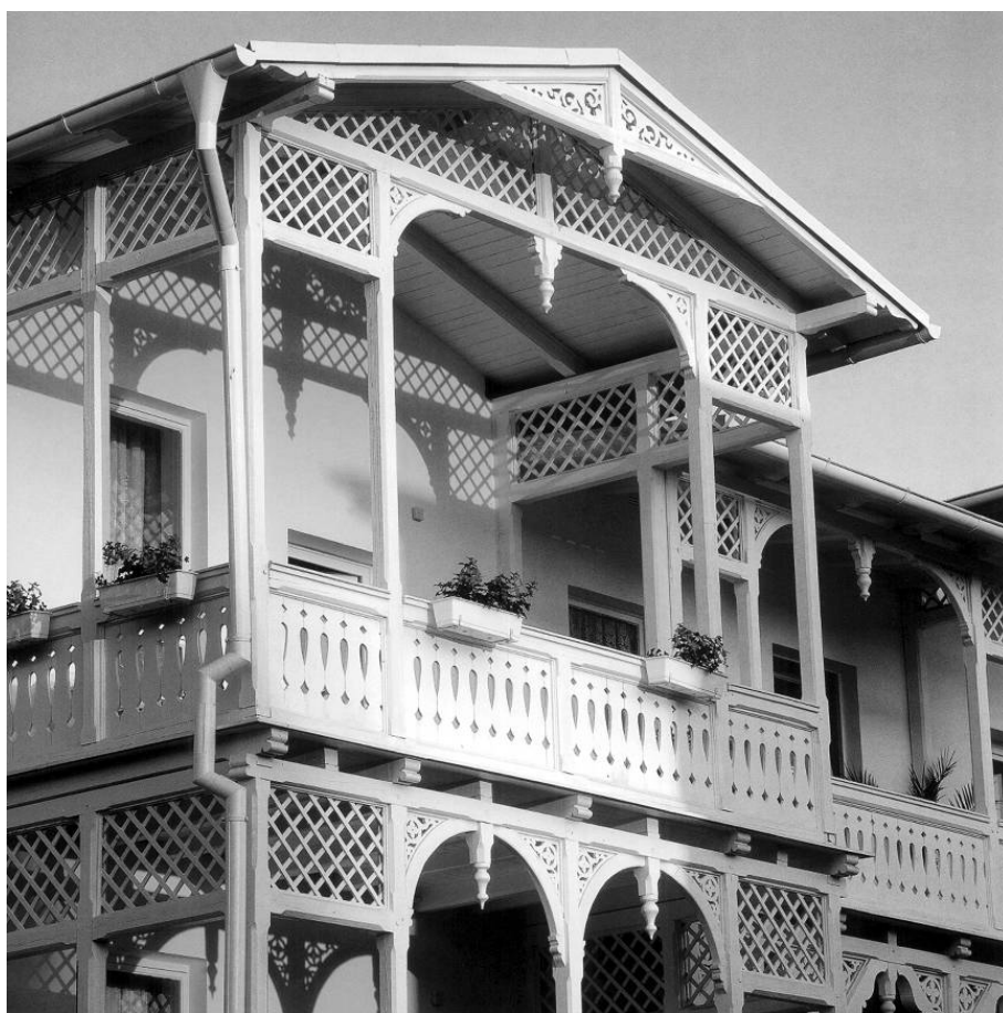
Il. 11. Odrestaurowany pensjonat „Minerwa” w Göhren na wyspie Rugia z charakterystyczną konstrukcją drewnianą zadaszonych loggii.

Historyczna zabudowa kurortów i reguły kreowania omawianych przestrzeni stanowią podstawę do oceny naszych dzisiejszych poczynań. Mogą stanowić odniesienie, jeśli zostaną poznane przez szerokie środowiska. Wówczas dopiero można będzie ocenić, w jaki sposób i jak mocno owe formy historyczne są obecne w naszej społecznej pamięci. W jaki sposób rezonują ze współczesnym pomysłem na uzdrowisko i wypoczynek.