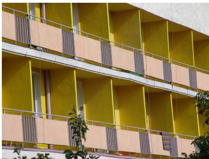
Il. 9. Sianorzęty k. Ustronia Morskiego – rytmiczny układ betonowych balkonów w obiekcie z przełomu lat 60. i 70. – bardzo rozpowszechnionych i chętnie powielanych projektów typowych ośrodków wypoczynkowych. Stan 2005 r. Źródło: fot. autora

Pic. 9. Sianorzęty (close to Ustronie Morskie) – repeatable concrete balconies of building from the turn of 60's and 70's of the 20 th century – as in common standardized projects of resorts. Source: photo by author, 2005