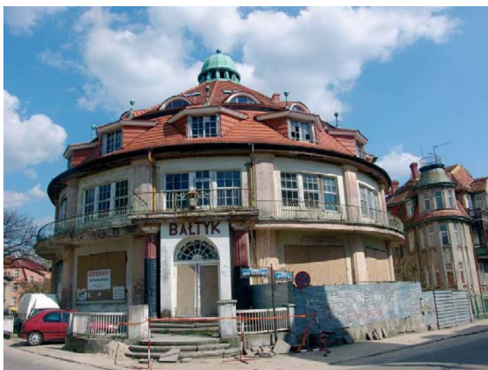
Il. 2. Międzyzdroje – historyczne obiekty zlokalizowane przy promenadzie u zbiegu ul. Bohaterów Warszawy ul. Rybackiej. Na pierwszym planie Ośrodek Wczasowy „Bałtyk”, po wojnie w użytkowaniu FWP, dziś w prywatnych rękach wciąż czeka na renowację (stan z 2006 r.).

Ważnym zadaniem jest podjęcie próby zdefiniowania cech krajobrazu kulturowego kurortów zachodniopomorskich oraz postawienia diagnozy przestrzennej tego krajobrazu. W tym kontekście pojawia się potrzeba określenia znaczenia dziedzictwa kulturowego dla budowania regionalnej tożsamości kulturowej oraz spójności przestrzennej i społecznej na danym obszarze. Wymaga to częstego odwoływania się do historii regionu. Warto jednak podkreślić, iż dotyczy przede wszystkim współczesnych problemów związanych z waloryzacją, rewitalizacją i kształtowaniem zdegradowanej przestrzeni polskich kurortów. Przestrzeń historyczna może być bowiem interesująca tylko o tyle, o ile ma związek z wyobrażeniem i odbiorem przestrzeni przez współczesnego człowieka 3 (il. 2).