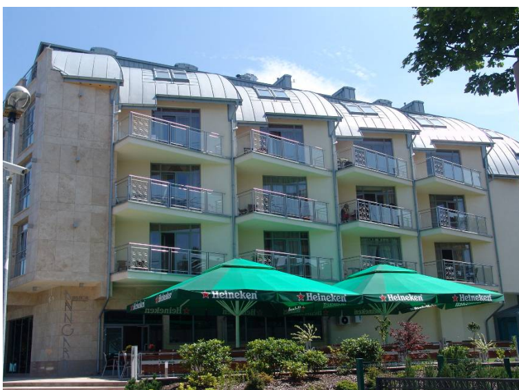
Il. 8. Świnoujście – hotel "Awangard" usytuowany w nowej części promenady przy ul. Uzdrowskiej, utrzymany w nowoczesnej stylistyce. Stan z 2007 r.

wartości jak: kompozycja; logika; harmonia, porządek i spokój wizualny; vitalność; spokojne i świadome stosowanie materiałów budowlanych; dbałość o detal architektoniczny i urbanistyczny. W projektowaniu przestrzeni wypoczynkowej nadrzędnymi wytycznymi powinny być bowiem komfort i wygoda - jako dużo ważniejsze niż efekciarstwo formalne. Uporządkowanie przestrzeni pozwoli podkreślić jej rangę i hierarchię, panować nad zestawieniem w jednym środowisku obiektów eleganckich i popularnych, obszarów tworzonych ze starannością i tanich. Nie bójmy się oceniać przestrzeni, świadomie wrócić do kategorii piękna i brzydoty.