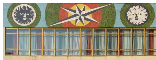
Il. 6. Międzyzdroje – mozaika nad wejściem do hotelu „Rybak” przy ul. Promenada Gwiazd – nowa jakość zdobnicza z lat 70-tych (stan 2007 r.)

Pic. 5. Międzyzdroje – part of projection of wooden villa at 1000-lecia street no. 21 with original fretwork sculpturing, as in year 2006.