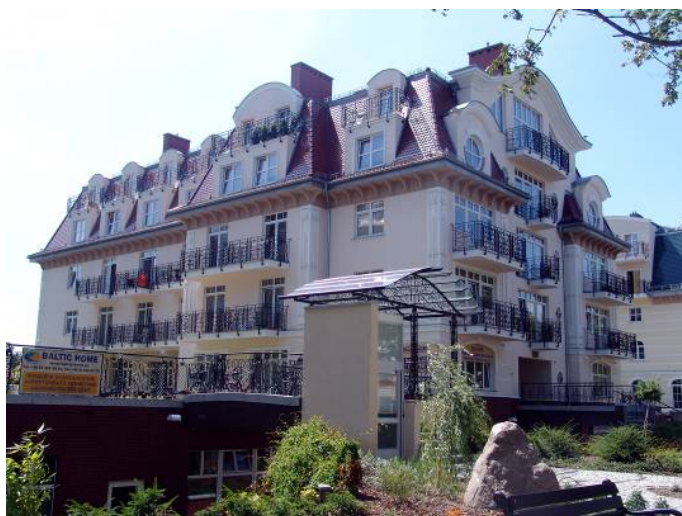
Il. 10. Świnoujście – rezydencja „Trzy Korony” - kompleks trzech budynków wkomponowanych w architekturę nowej dzielnicy nadmorskiej przy ul. Uzdrowskiej – przykład przerysowanej i karykaturalnej formy nawiązania do minionej epoki. Stan z 2007 r. Źródło: fot. autora

Pic. 9. Sianorzęty (close to Ustronie Morskie) – repeatable concrete balconies of building from the turn of 60's and 70's of the 20 th century – as in common standardized projects of resorts. Source: photo by author, 2005