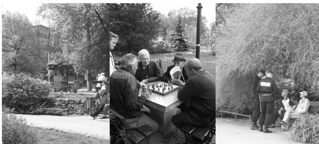
Ryc. 3. Życie codzienne na pl. Grunwaldzkim w Szczecinie.

Wykonanie wszystkich wymienionych analiz miało na celu nie tylko pokazanie przyszłym projektantom i użytkownikom przestrzeni publicznej w mieście, jak ważnym elementem w procesie projektowym jest często żmudna i długotrwała praca analityczna poprzedzająca samo wykonanie projektu, ale przede wszystkim umożliwienie właściwej i obiektywnej waloryzacji przestrzeni. Szczegółowe badania terenu prowadzone o różnych porach dnia pozwoliły na wybranie spośród sześciu części (placów i odcinków alei), tworzących oś kompozycyjną miasta – dwu wewnątrz architektoniczno – krajobrazowych o przeciwstawnych cechach. Plac Grunwaldzki został oceniony jako miejsce o wysokiej wartości estetycznej, intensywnie użytkowane w odpowiedni sposób, a dodatkowo bardzo atrakcyjne dla osób przybywających z zewnątrz, nie tylko ze względu na jego wyjątkową kompozycję przestrzenną i kluczową rolę, jaką odgrywa w kształtowaniu całej osi Złotego Szlaku, ale również ze względu na aspekty „socjologiczne”. Okazało się, bowiem, iż jest to miejsce, w którym osoby spoza Szczecina mogą najłatwiej obserwować wielu stałych mieszkańców miasta i różne przejawy ich aktywności (m.in. ze względu na obecność przystanków tramwajowych, miejsc do gry w szachy, często odbywające się w tym miejscu manifestacje i inne akcje społeczne, czy też kulturalne), a z drugiej strony jest to jeden z najlepszych punktów orientacyjnych w mieście, stanowiący oczywiste miejsce spotkań zarówno turystów, jak i mieszkańców.