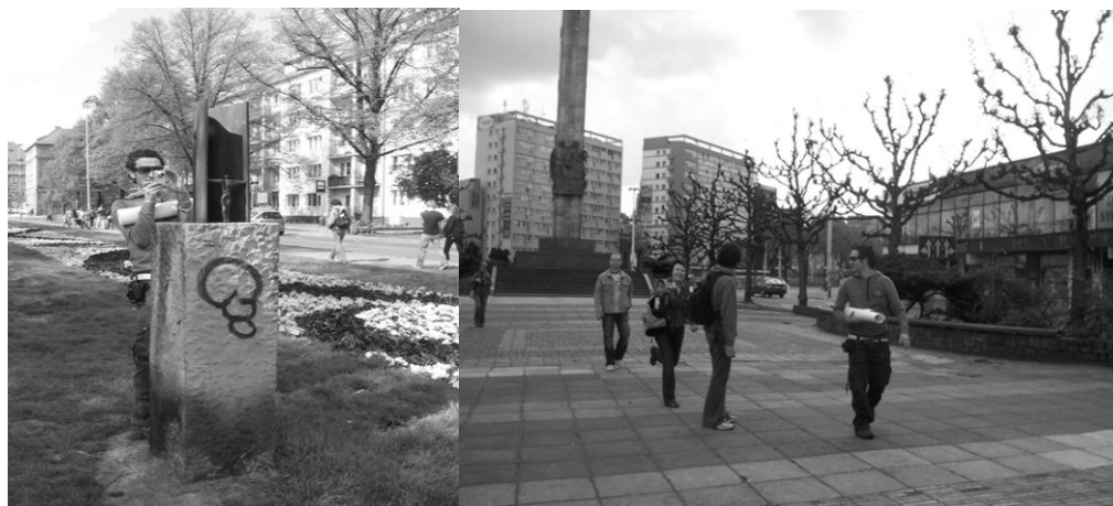
Ryc. 2. Uczestnicy warsztatów w trakcie analiz terenu opracowania (al. Papieża Jana Pawła II).