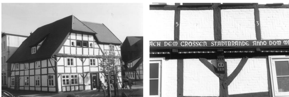
Fot. 9., 10. Drewniany, miejski dom am Markt w Bergen i szczegół jego ryglowej konstrukcji.

W pierwszej kolejności należy wymienić tu dwa zwarte zespoły zachowanych wsi rybackich. Pierwszy to osada Witt , pięknie zlokalizowana przy kredowym klifie, zaledwie dwa kilometry od Arkony (fot. 6). Druga, o nazwie Neuendorf , leży na wydłużonej, piaszczystej wyspie Hiddensee przy zachodnim wybrzeżu Rugii. Można się tu dostać wyłącznie promem. Oba zespoły, bardziej zwarte, bezkształtne w planie Witt i ekstensywnie zabudowane, regularny Neuendorf wypełniają domy rybackie o podobnym kształcie. Są one szerokofrontowe, na ogół symetryczne z naczółkowymi dachami, krytymi strzechą (fot. 8.). Analogiczne domy spotykamy w miejscowościach na wyspie w miejsc. Karnow i Groß Zicker .