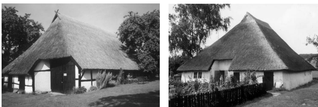
Fot. 2., 3. Przykłady architektury w tradycji domów halowych: obiekt z Zirkow z 1720 r. i dom wzniesiony dla wdowy po pastorze w Groß Zicker w latach 1720-23. Gładkie, trzcinowe strzechy schodzą nisko do ziemi, dymniki artykułują śparogi w formie końskich główek.

Ogólnie charakteryzując tradycyjną architekturę drewnianą wyspy Rugii, nie sposób nie zauważyć jej specyficznego charakteru. Na podstawie zachowanych zabytków wydaje się, że na terenie wyspy istniała w przeszłości równowaga pomiędzy dwoma rodzajami budynków mieszkalnych. Domy halowe, wraz z przynależnymi im formami budynków gospodarczych, współistniały zgodnie z domami szerokofrontowymi, symetrycznymi, z czarną kuchnią i o niewielkich zasadniczo rozmiarach. Być może sytuacja ta częściowo była skutkiem stosunkowo długiego trwania na tym terenie ludności i kultury pochodzenia słowiańskiego. To z kolei było konsekwencją naturalnej dla wyspy izolacji geograficznej 4 , a także politycznej, o czym była mowa w poprzednim punkcie.