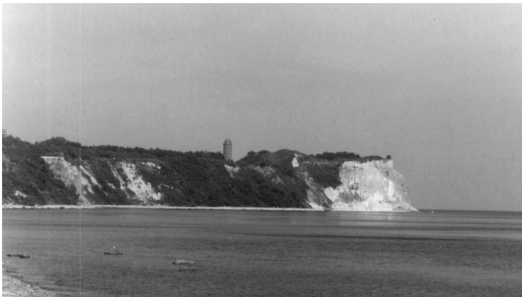
Fot. 1. Kredowo-białe klify przylądka Arkona. Za widocznym wałem znajdowała się świątynia Światowida, obecnie to miejsce pogrążyło się w falach Bałtyku.

Jasmund . Powierzchnia wyspy jest lekko falista z kumulacją na wzgórzu Plekberg (161 m n.p.m.) na wspomnianym półwyspie.