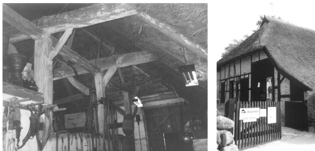
Fot. 4. 5. Budynek gospodarczy w Göhren . Wnętrze i front obiektu od strony drogi.