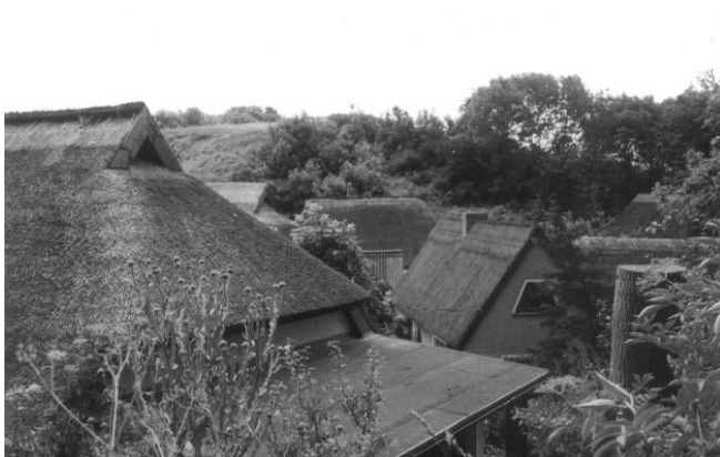
Fot. 6. Położona przy klifie wioska rybacka Witt ze względu szczupłość miejsca ma b. zwartą zabudowę i nieregularny plan.

Mi-ddehagen ma podobny kształt przestrzenny. W obu wymienionych przypadkach obiekty są już mocno przebudowane, ze stopniową wymianą drewnianej konstrukcji ryglowej na murowaną z czerwonej cegły.