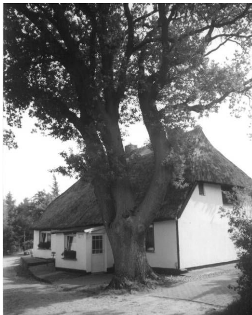
Fot. 7., 8. Drewniana wieża – dzwonnica na cmentarzu przy kościele w Altenkirchen oraz dom o kształcie i wielkości typowej dla rugijskich chat szerokofrontowych w miejsc. Lobbe .

W miejscowości Göhren , obecnie już wyłącznie wypoczynkowej, zachowało się bogate gospodarstwo rolne, zamienione na muzeum. W obrębie obejścia znajduje się duży budynek gospodarczy, pochodzący z 1680 roku, który kiedyś zawierał w sobie m. in. stodołę i stajnię (fot. fot. 4., 5.). Jest to typowy obiekt o drewnianej konstrukcji tzw. typu trzysłupowego (nm. Dreiständerbau ). Obiekty tego typu można spotkać w wielu chłopskich wsiach Meklemburgii 5 . Podobny charakter ma obiekt