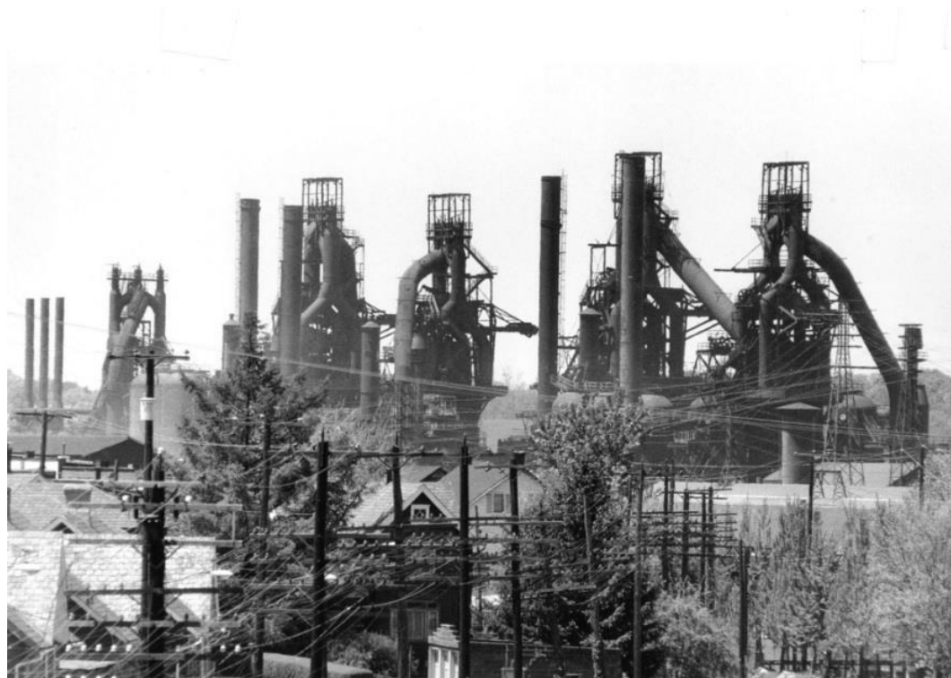
Fig. 1. A view of the former steel mill in Bethlehem. Source: [7]

The former steelworks operated in Bethlehem, Pennsylvania. The town was built on the left bank of the Lehigh River, which constituted its southern limit at the same time. The town was developing in symbiosis with the neighbouring Allentown, which was the main administrative and trade centre. The burden of the industrial development rested on Bethlehem in 1863, when Bethlehem Steel Plant started to operate there [9].