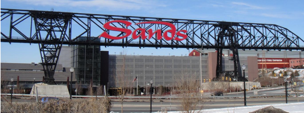
Fig. 5. The entrance to the Las Vegas Sands casino, which runs under the stindustrial construction . Ryc. 5. Wjazd na teren kasyna Las Vegas Sands wiodący pod poprzemysłową konstrukcją

A separate issue was the need to eliminate social concerns connected with the new purchase of the former steelworks premises. A vision of a great casino operating in the centre of Bethlehem faced massive social resistance. The Save Our Steel association was openly reluctant to approve of the plans of the casino, which resulted from the open resistance towards gambling as such. However, the operation and profitability of the brownfield constituted an important challenge for the city. Efforts undertaken to change the attitude of the town residents were an extremely difficult process. The local government tried to focus the voters' attention on the strengths of this difficult neighbourhood, which offered a chance to save the industrial legacy of the place.