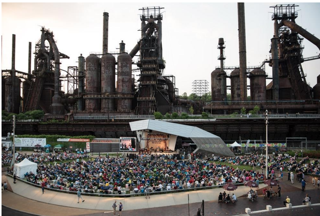
Fig. 4. Levitt Pavilion among post-industrial relics

ArtsQuest Center, the Festival Center, and a summer stage, dynamic in the architectural form, operating with a steel structure – Levitt Pavilion (fig. 4), as well as the Visitor Center, making use of the existing buildings, and the Hoover Mason Trestle, offering an opportunity to take a walk along an educational path amongst the most technical part of the former infrastructure. In the hot season, one can encounter crowds of music lovers here, spending their free time on the meadow spreading between the buildings [13].