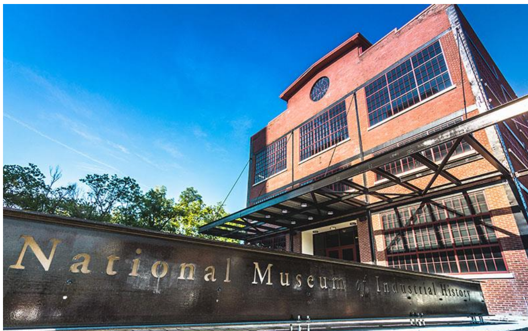
Fig. 3. National Museum of Industrial History in the former plant's hall. Source: [5] Ryc.3.Państwowe Muzeum Historii Przemysłu w dawnej hali hutniczej. Źródło: [5]

The most numerous postindustrial structures were preserved in the area purchased by BethWorks. The new owner planned to create a town district focused on culture, entertainment, and education amongst postindustrial artefacts, emphasising the respect for the metallurgical heritage of the place and highlighting it properly. The company invested USD 879m in this redevelopment [9]. The main element of the project was the National Museum of Industrial History (fig. 3), affiliated with the Smithsonian Institute [12]. Located in a renovated structure of the former steelworks, it is planned to constitute a platform for a dialogue between the history of American industry and contemporary technological innovations.