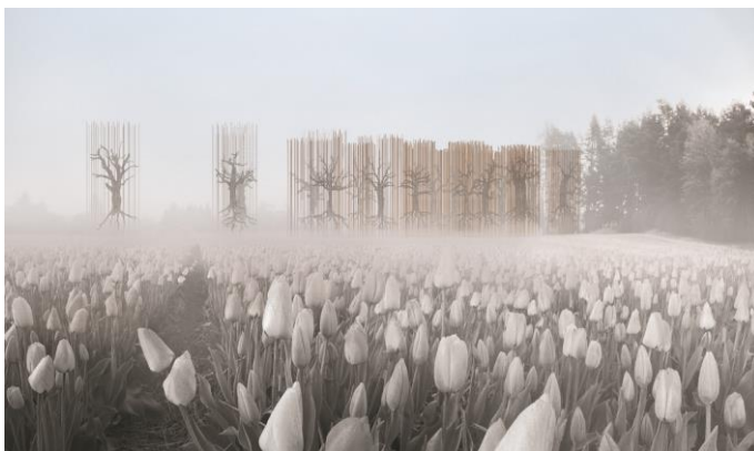
Fig. 6. Memorial Site of polish insurgents massacre from the January Uprising 1863 in the village of Choroszcz. Author diploma project: H. Wojdakowska. Promoter: S. Wojtkiewicz

Fig. 5. Memorial of the former German Nazi death camp at Sobibor. Author diploma project: D. Konopka. Promoter: S.Wojtkiewicz