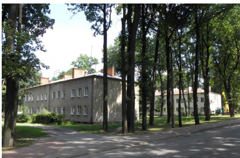
Fig. 1. Old city – Modrzewiowa street, modern condition.

railway in Nałęczów) [4, p. 168] and was created the warehouse of building material [5, p. 6]. The settlement was situated on north side of factory, on forest lands, along the road led from Rozalin to Poniatowa cottage. The natural watercourse (Poniatówka river) between them was preserved. The 22 buildings were built perpendicularly to Modrzewiowa street and 11th of November street until the September in 1939. The buildings were intended for families of technical staff and clerks [4, p. 316]. It may be assumed that between the buildings, and as along the road, the stand of trees was left, which created the private sphere for whole district and the citizens of individual blocks. It has survived until nowadays and is commonly known as “Old District” (fig.1).