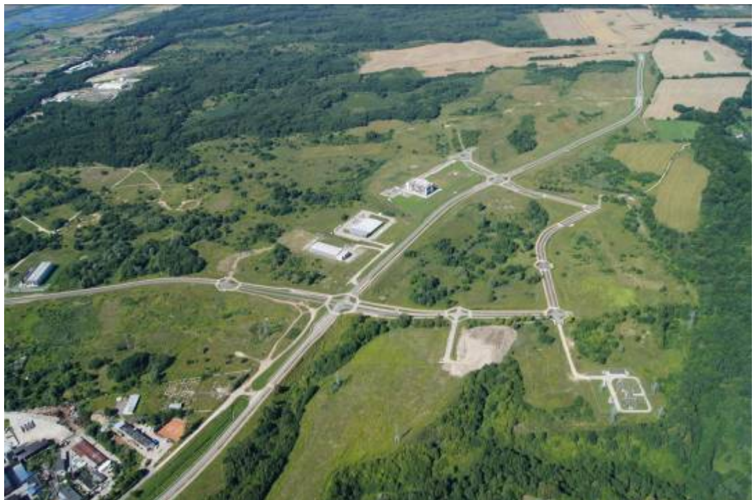
Fig.2. Development of road infrastructure (Elbląg) Ryc.2. Rozwój infrastruktury drogowej (Elbląg)