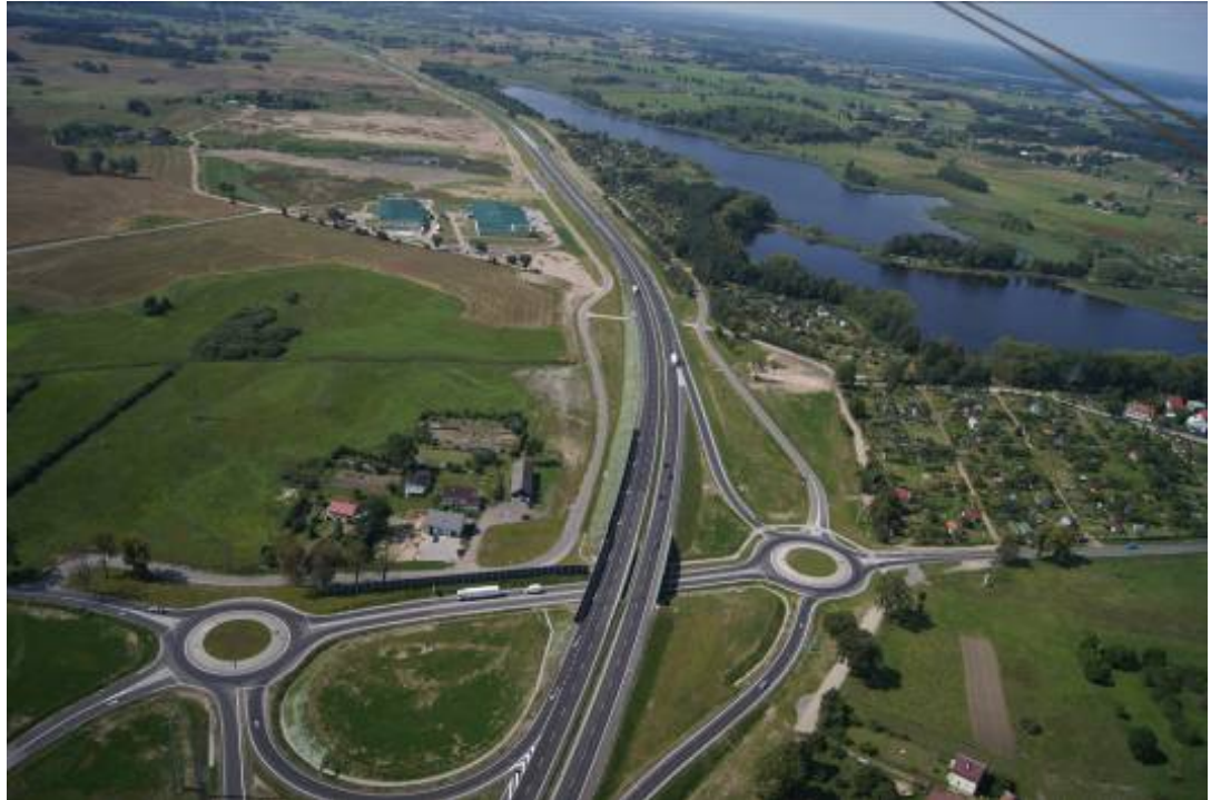
Fig.1. Development of road infrastructure (Biskupiec). Ryc.1. Rozwój infrastruktury drogowej (Biskupiec).