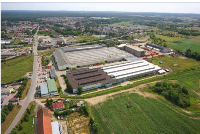
Fig.3. Development of technical infrastructure (Dobre Miasto), Source: WMSSE Ryc.3. Rozwój infrastruktury technicznej (Dobre Miasto), Źródło: WMSSE