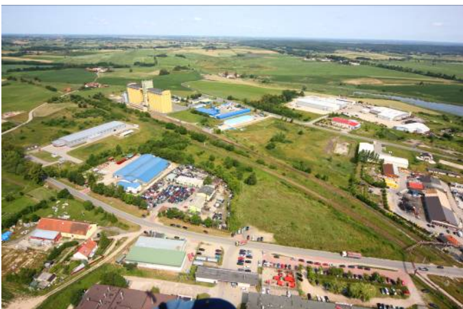
Fig.4. Development of technical infrastructure (Dobre Miasto), Source: WMSSE Ryc.4. Rozwój infrastruktury technicznej (Dobre Miasto), Źródło: WMSSE

Urban systems are very complex. The resilience of one subsystem affects other subsystems, and even the entire urban system. Lorenzo Chelleri [4,p.68] analysed the individual components of the urban system and described them in spatial terms. In addition to the ecological, social and economic drivers, Chelleri also identified technical, technological and individual aspects of resilience. He observed that urban resilience is a multidisciplinary concept which defines a region's ability to regenerate and adapt to new conditions. Chelleri proposed a model of urban resilience that consists of three stages: regeneration, adaptation and transformation (Fig.5).