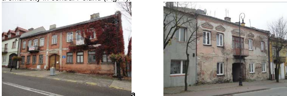
Fig. 1 a) Serock, b) Tarczyn. Preserved market square buildings with classicistic appearance from the turn of the 19 th and 20 th century.

Ryc. 2 a) Serock, b) Tarczyn. Zachowana zabudowa przyrynkowa o klasycyzującym wyglądzie z przełomu XIX i XX w.