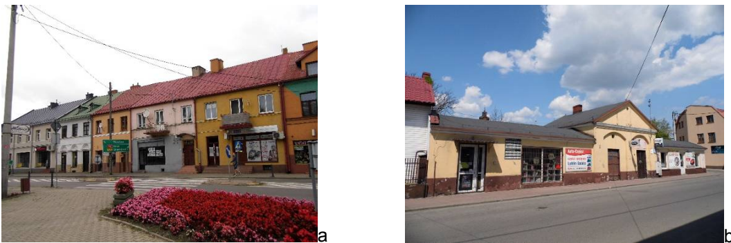
Fig. 2 a) Fragment of the northern frontage of the market square b) town butcheries. Source: phot. Sandra Perska, 2016

The spatial structure of the city is characterised by the compact area of the centre with diversified building development (old townhouses, new multi-family and single-family housing). Multi-family housing is located in the centre and in the northern part, and single-family housing in the central part of the city, as well as on its boundaries. The Rawka River constitutes the green spine of the city. In the peripheral part, arable land is predominant. The city had a distinctive landscape silhouette, panorama with the dungeon of the Castle, the most visible from the northern side. The medieval urban layout was covered with strict conservation protection. In spite of war-related damage, many historical objects were preserved (particularly in the centre – 24 historical objects) 11 . The most important ones are the remains of the former Kazimierzowski Castle, Baroque church of the Immaculate Conception of the BVM with a Jesuit College, Late Baroque church of Passionist Fathers, and an Augsburg-Lutheran church of the Holy Spirit. Remains of the 19 th century development period include the townhall, townhouses (Fig. 2), and the city park (subject to revalorisation in the years 2005-2008). The Narrow Gauge Railway from 1915 with the station building and steel bridge on the Rawka River from 1928 is an important element of the cultural landscape of the city (Fig. 3).