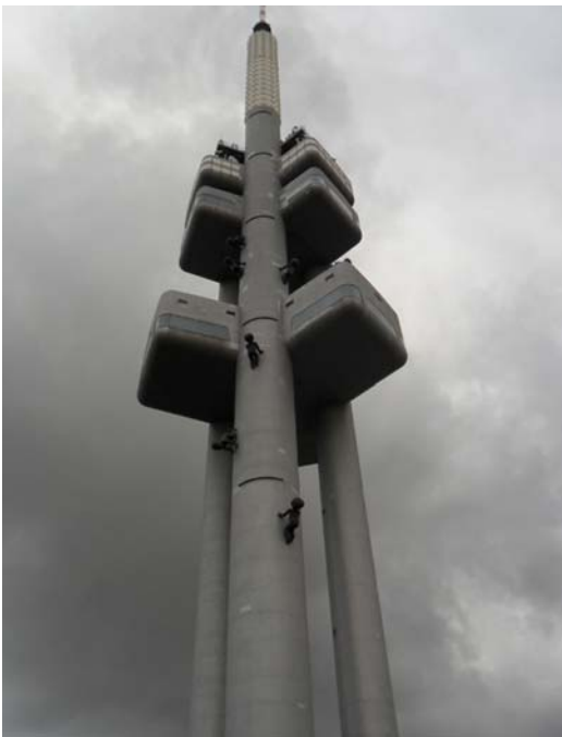
Fig. 8. Mimininka by David Čern - TV Tower Žižkov in Prague.

There are monuments that are strongly linked to the emerging social problems – often provocative, met with really low social reception, sometimes emotional and sometimes trying to encourage to hold a specific stand on a given issue.