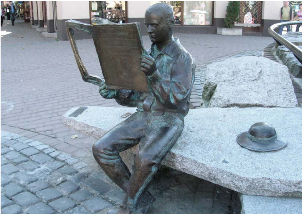
Fig. 11. Reader from Zakopane, by Karol Gąsienica Szostak.

Passing through the river by Jerzy Kędzior (Fig. 11) is a sculpture commemorating Poland's accession to the European Union. It was suspended on a line stretched between the banks of the Brda river on May 1, 2004. The sculpture depicts a young man holding an arrow in one hand and a perch in second. Over his shoulder, he is overlaid with sandals - the same as those worn by the Bydgoszcz Archers . Because of the same footwear and man-made arrows - this figure connects well with the symbol of the city of Bydgoszcz - the Archer . The statue has another hidden information - a swallow sitting on a perch - from German language: 'schwalbe' - the name of the founder of the Pomeranian Philharmonic [12]. The sculpture stands in beautiful scenery - you can see it from the bank of the river or from the bridge. It presents itself equally well during the day as well as during the night. This is mainly possible thanks to the well chosen location and all the care that was taken by the city authorities to install good lightings for the monument. Since the Passing through the river appeared, it is increasingly noticeable to see visitors and locals stopping for a moment at this place. The sculpture gained a general sympathy of the inhabitants of Bydgoszcz and it was incorporated into the urban tissue in a really smooth manner.