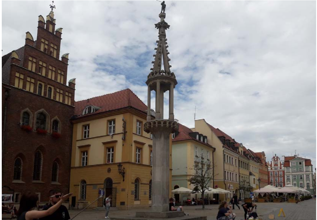
Fig. 5. Replica of a pillory on the Old Market Square in Wrocław. Ryc. 5. Replika Pręgiarza na Starym Rynku we Wrocławiu.

There are sculptures, whose main purpose is to teach all kinds of people about the city itself. Such objects are, for example, touch models of important buildings (Fig. 6, 7), made on a scale and cast of bronze. They allow passersby to easily understand how the whole object looks. In addition, they are a spatial element that especially attracts the attention of visitors who want to get acquainted with the history of a given place.