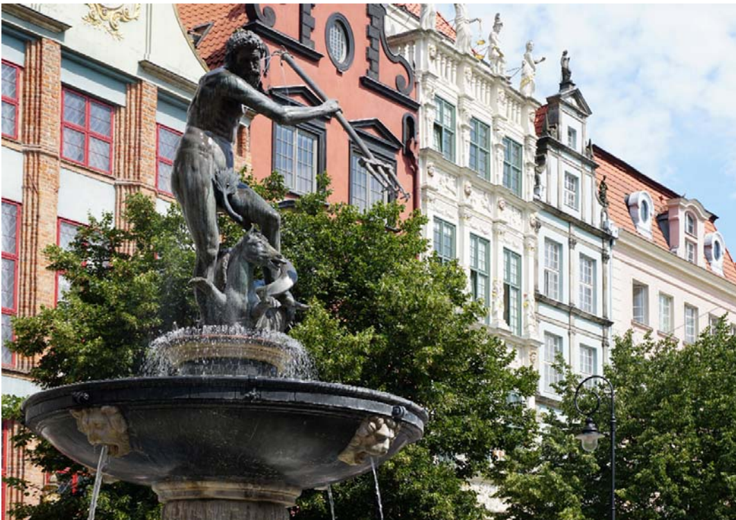
Fig. 4. The Neptune Fountain in Gdańsk by Abraham van den Blocke.

Sculptures are also performing additional functions like the aestheticization of space or being a symbol of the city. An example of such a monument may be the Neptune Fountain in Gdańsk (Fig. 4) – designed by Abraham van den Blocke. The statue was cast in 1615, and the trellis with golden coats of Gdansk and Polish eagles dates back to 1634 [10]. The fountain was positioned in such a way that each side had a suitable background. When standing in front of Neptune, behind it, we see the façade of Artus Court. When looking at it from the Green Gate - the fountain has the Town Hall of the City in the background. When looking at it from the Długa street, it has the Royal Road in the background. It is a monument strongly integrated into the town's urban fabric. An indispensable element of Gdansk, attracting many tourists.