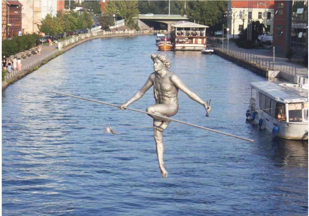
Fig. 12. Crossing the river by Jerzy Kędzior.

Ryc. 12. Przechodzący przez rzekę autorstwa Jerzego Kędziora.