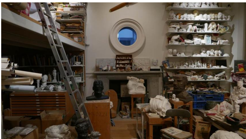
Fig. 6. Paolozzi studio at Scottish National Gallery of Modern Art Two.

Ryc. 5. Ręka.