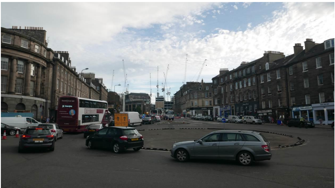
Fig. 2. Leith Walk – the view on revitalized St James Shopping Center.

Ryc.1. Wzgórze Arthur Seat, Edynburg od strony południowej.