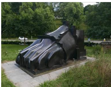
Fig. 4. Foot.

Ryc. 3. Kostka