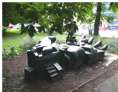
Fig. 5. Hand.

Ryc. 4. Stopa