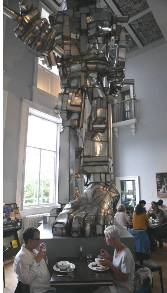
Fig. 9. Paolozzi sculpture 'Vulcan' in the restaurant corner of National Galleries of Scotland.

Ryc. 8. Rzeźba Paolozziego pt. 'Parthenope', 1996, tymczasowo przeniesiona z powodu prac remontowych umiejscowiona w okolicy Wydziału Nauk Biologicznych Uniwersytetu Edynburskiego.