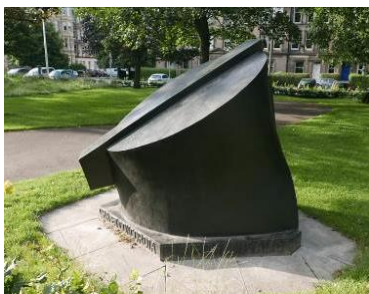
Fig. 3. Ankle

Ryc. 3. Kostka