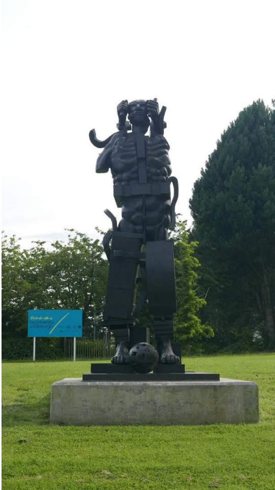
Fig. 8. Paolozzi sculpture 'Parthenope' 1996 temporary location due to the construction works near the School of Biological Sciences, The University of Edinburgh.

Ryc. 8. Rzeźba Paolozziego pt. 'Parthenope', 1996, tymczasowo przeniesiona z powodu prac remontowych umiejscowiona w okolicy Wydziału Nauk Biologicznych Uniwersytetu Edynburskiego.