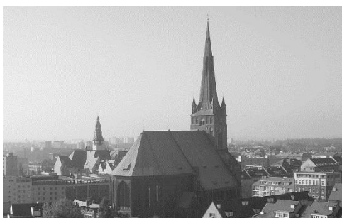
Fig. 3. The cathedral after the reconstruction of the helmet in 2008. Ryc. 3. Katedra po odbudowie hełmu w 2008 roku.