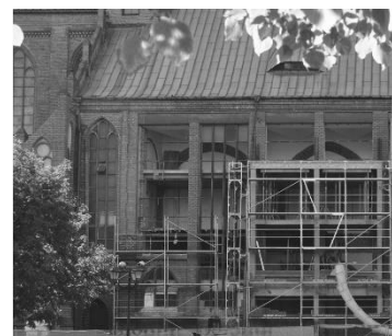
Fig. 4. Regotization of the northern facade - 2018. Source: author. Ryc. 4. Regotyżacja ściany północnej – 2018 r. Źródło: autor.